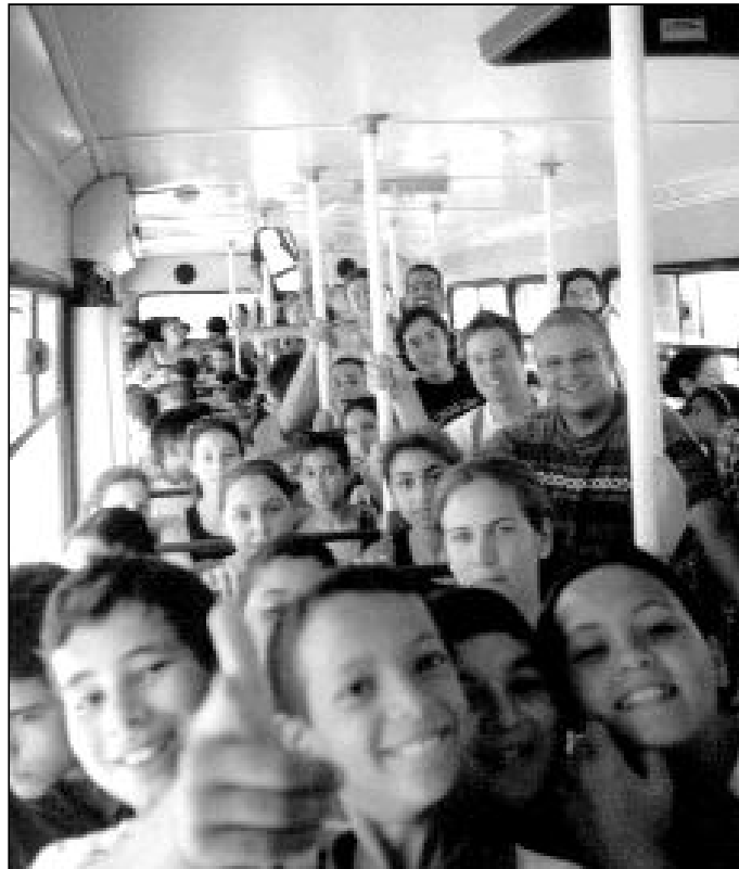
Los campos de trabajo son una buena opción para evangelizar en verano

Los seminaristas de cursos menores tienen un seguimiento más cercano y sus actividades están más organizadas, mientras que los de cursos avanzados están llamados a desarrollar su creatividad y su capacidad de desenvolverse en nuevas áreas. Quienes más lo notan son los que van a ayudar en una parroquia, como es el caso de