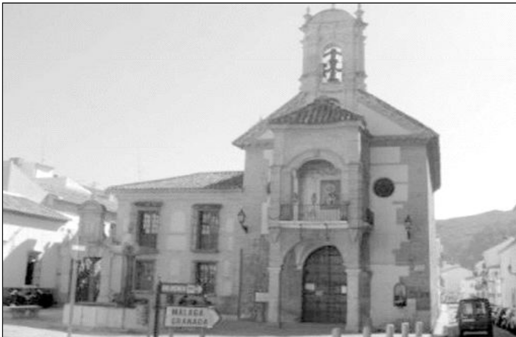
La iglesia de Santiago de Antequera

El interior es muy sencillo, consta de una sola nave cubierta con bóveda de medio cañón y capilla mayor con media naranja, algo reducida. En el retablo mayor se abre el camarín de la Virgen de la Salud, precioso habitáculo rococó de blancas y rizadas yeserías, realizado en 1765. La imagen de la Virgen, de vestir y del siglo XVIII, se ubica sobre un templete de madera dorada, que en su expresión y estilo, concierta perfectamente con las yeserías del camarín. En sendas hornacinas laterales del retablo, se albergan las esculturas de San Luis y Santiago. El resto del templo se