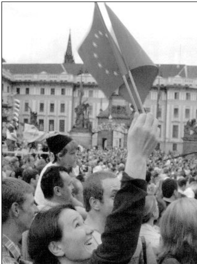
Ciudadanos de la República Checa celebran su ingreso en la Unión Europea

Son oportunidades providenciales para muchos creyentes, para un número considerable de toda clase de personas de buena voluntad, incluso para los que sólo pueden seguir esos encuentros a través de la televisión y de la prensa. Una gran oportunidad que se ofrece para la reflexión personal y comunitaria, para la plegaria participativa y para la renovación de la fe, así como para un mayor conocimiento y práctica de la misma. En esta ocasión, y coincidiendo con el próximo ingreso de otros países europeos en la Comunidad de Europa, la reflexión abarcará principalmente el hecho histórico de las raíces cristianas de Europa y su misión evangelizadora en otros continentes.