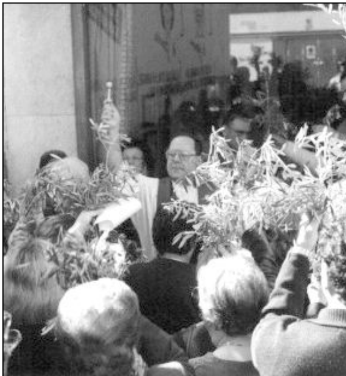
Celebración del domingo de ramos en la parroquia de S. Juan de la Cruz de Málaga

Hay palabras, dice S. Agustín, que se han dejado por su santa y venerable autoridad en su forma primitiva, aun cuando hubieran podido ser traducidas: