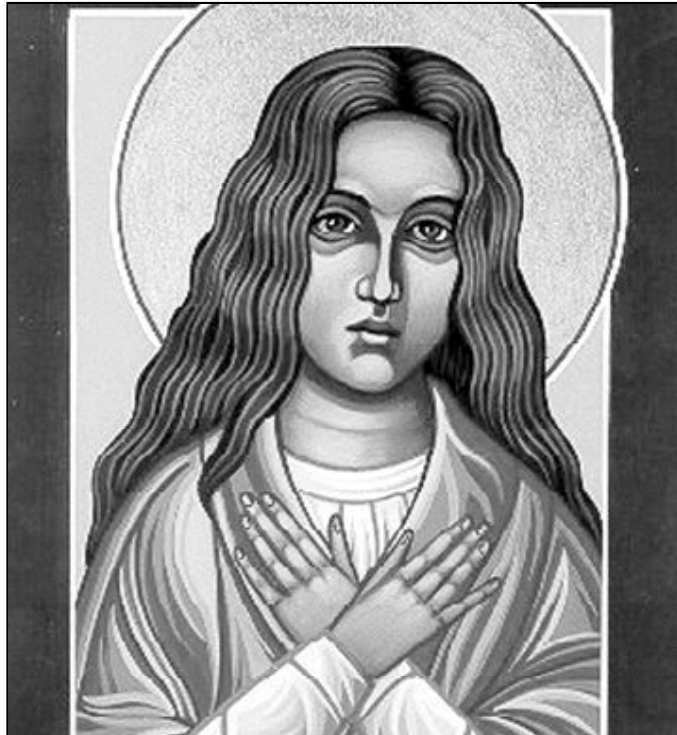
Este año se han cumplido 100 años de la muerte de Santa María Goretti

Para el Papa, este mensaje de castidad sigue siendo «actual» en estos momentos en los que «se exalta a menudo el placer, el egoísmo o la inmoralidad, en nombre de falsos ideales de libertad y de felicidad». Por ello, consideró necesario «reafirmar con claridad la defensa de la pureza del corazón y del cuerpo, porque la castidad custodia el amor auténtico». Juan Pablo II destacó, así mismo, que «las múltiples ocupaciones y los ritmos acelerados