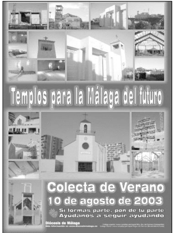
Cartel de la Jornada Pro-templos

La colecta de verano es sólo una ayuda para este fin, puesto que la mayoría de los gastos son asumidos por los propios feligreses de las distintas parroquias. La colecta del año pasado ascendió a 83.000 euros (unos 13 millones de pesetas). Una cifra que demuestra la solidaridad de los cristianos malagueños, pero que debe seguir creciendo cada año, puesto que el presupuesto de obras para el año que viene anda en torno a los 6 millones de euros (1.000 millones de pesetas). Es responsabilidad de todos.