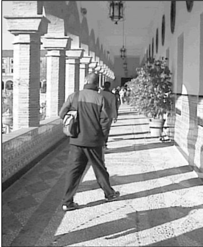
La Casa Diocesana de Espiritualidad es uno de los lugares para hacer Ejercicios

Los ENS, en concreto, organizan tres tandas de ejercicios para matrimonios. Dos de ellas cuentan con un servicio de guardería, ya que la mayoría de los participantes son matrimonios jóvenes con niños pequeños. La tercera tanda está pensada especialmente para matrimonios con hijos mayores. Cada tanda de ejercicios dura un fin de semana y reúne en la Casa Diocesana de Espiritualidad a más de 40 matrimonios que viven una experiencia de silencio absoluto, sólo interrumpido en las horas de las comidas, cuando hijos y padres se reúnen para compartir la mesa. El encargado de dirigir las charlas es siempre un sacerdote, bien de la diócesis