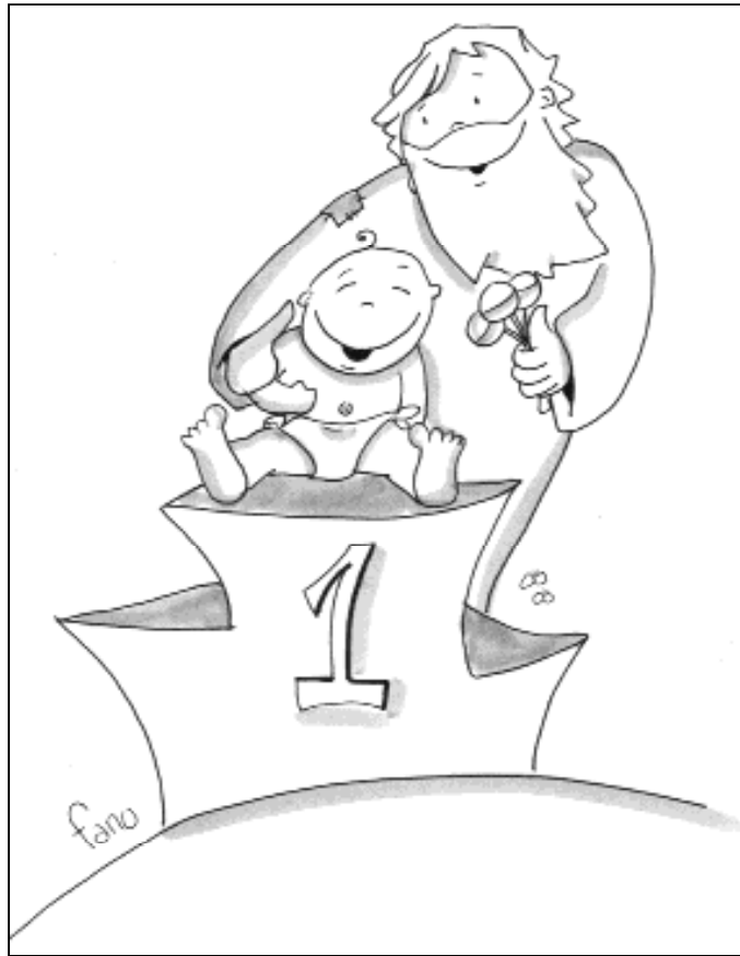
"Quien quiera ser el primero, que sea el último"

Movida por el Espíritu de Jesús, la Iglesia desde el principio sintió la necesidad de ponerse a servir como hacían los esclavos y los criados. Era la expresión de la vivencia de la misericordia, tan esencial en la persona