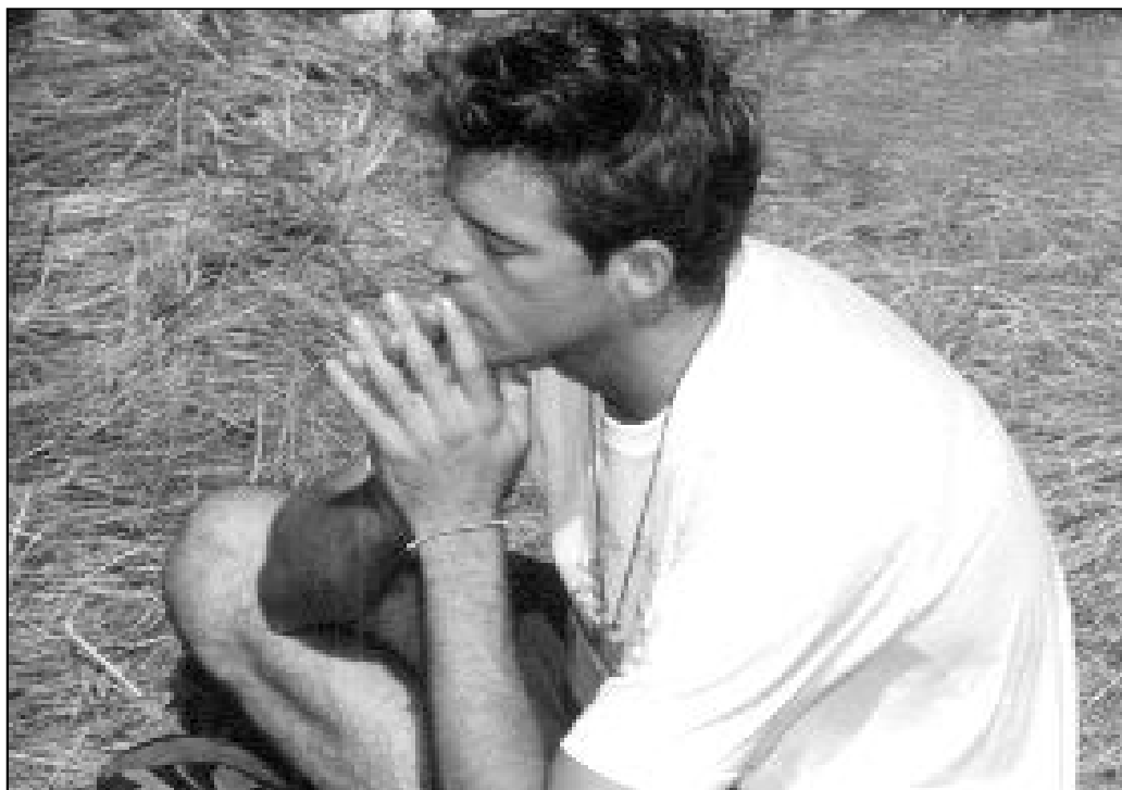
Son muchos los jóvenes que se deciden a realizar unos días de Ejercicios Espirituales