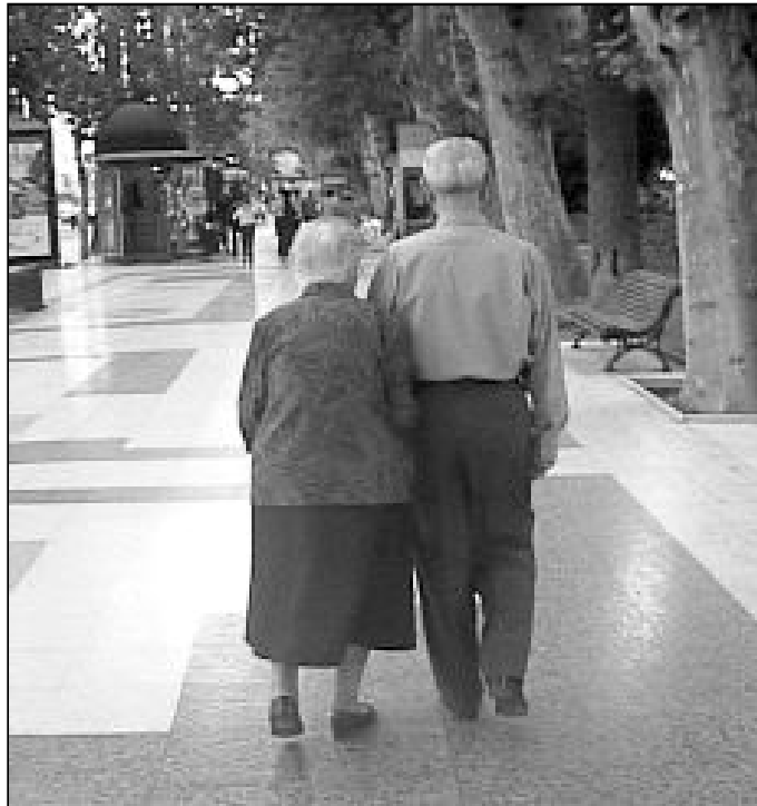
Los mayores analizarán su papel en la sociedad y en la Iglesia

Saben que no por muchos años que viva, acaba el hombre de aprenderlo todo, y menos aún de conocer por completo el amor que Dios le tiene, por eso, no se conforman con la tarea diaria, sino que han programado el desarrollo de un congreso que reúna a las diócesis del sur de