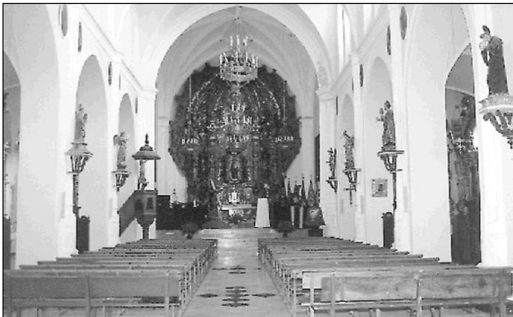
Iglesia de la Santa Ana, Archidona

El templo de Santa Ana no es el único de Archidona. Se encuentra arropado por otros como San