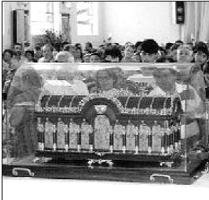
Urna que contiene las reliquias de Santa Teresita

«Nosotros, hombres y mujeres de religiones distintas, provenientes de muchos partes del mundo, nos hemos reunido en Aquisgrán para invocar de Dios el gran don de la paz, esa paz que la humanidad muchas veces no sabe darse», señala el texto. «En el corazón de Europa, hemos contemplado las esperanzas de paz y de justicia del mundo. Nos hemos interrogado sobre nuestras responsabilidades; nos hemos