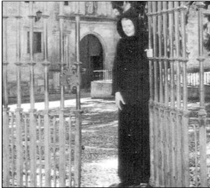
Un congreso estudiará en Asís la importancia de la vida monástica

Un «difundido sentimiento de miedo» es el nexo común a dos momentos separados por cuatro décadas, según reconoce el cardenal Sodano en su prefacio. El purpurado recuerda además los cuatro pilares que propuso Juan XXIII —verdad, justicia, amor, libertad— para la construcción de la paz, que exigen el respeto de la dignidad de la persona y de sus derechos, la observancia de los deberes, la conciencia de pertenecer a la comunidad mundial y la necesidad de una autoridad supranacional. Por su parte, monseñor Martino reconoce otros elementos de gran actualidad en la «Pacem in Terris», como el análisis sobre el derroche