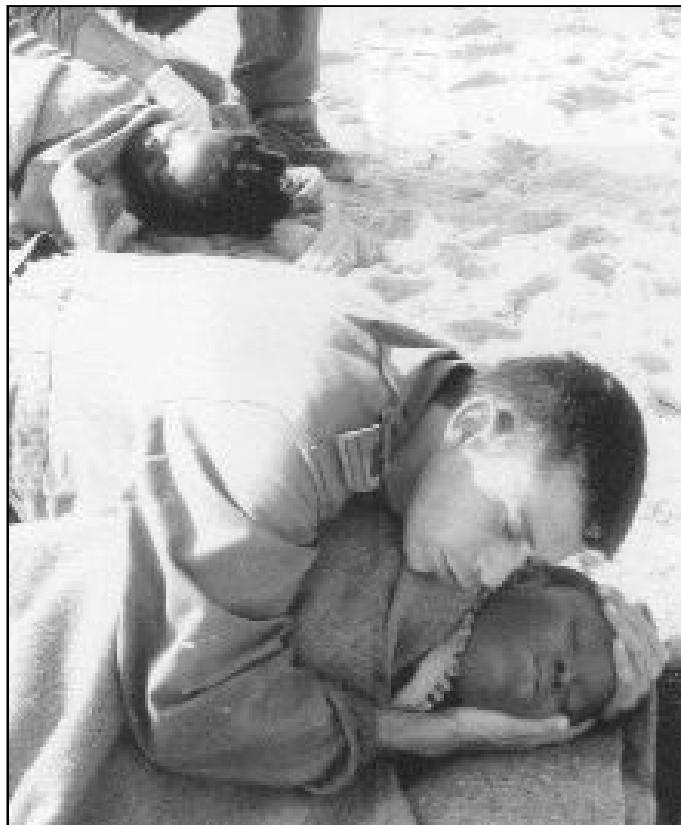
Un guardia civil da calor a un inmigrante llegado a la costa

La Pastoral de Migraciones de nuestra diócesis trabaja, como el resto de secretariados y delegaciones, siguiendo las líneas de este documento y, desde ellas, trata de atender a las personas inmigrantes en todo aquello que le afecta. Los responsables de este secretariado hablan desde su experiencia cuando nos dicen que los principales obstáculos que se encuentra el que llega a nuestro país son la vivienda y el trabajo. La primera, por el imparable aumento de los precios de alquiler; y el segundo, porque sigue existiendo discriminación,