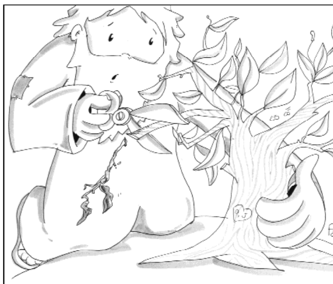
"Lo que te impide crecer, córtalo"

En primer lugar Juan le plantea el problema de los que expulsan demonios en su nombre sin ser de los suyos. En este tema los discípulos se muestran recelosos, sectarios, pretenden monopolizar el espíritu de Jesús. Pero el Señor los llama a la tolerancia, a la apertura de mentes: "los que no están contra nosotros están con nosotros". En la evangelización siempre sumar, nunca restar.