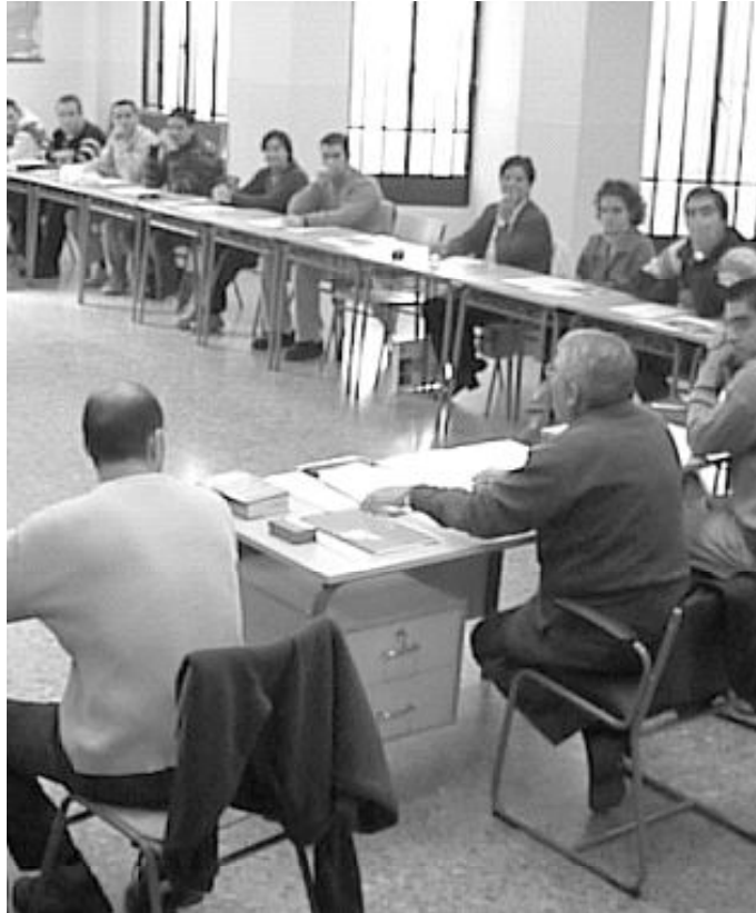
Por la experiencia vocacional "Monte Horeb" han pasado ya más de 400 jóvenes