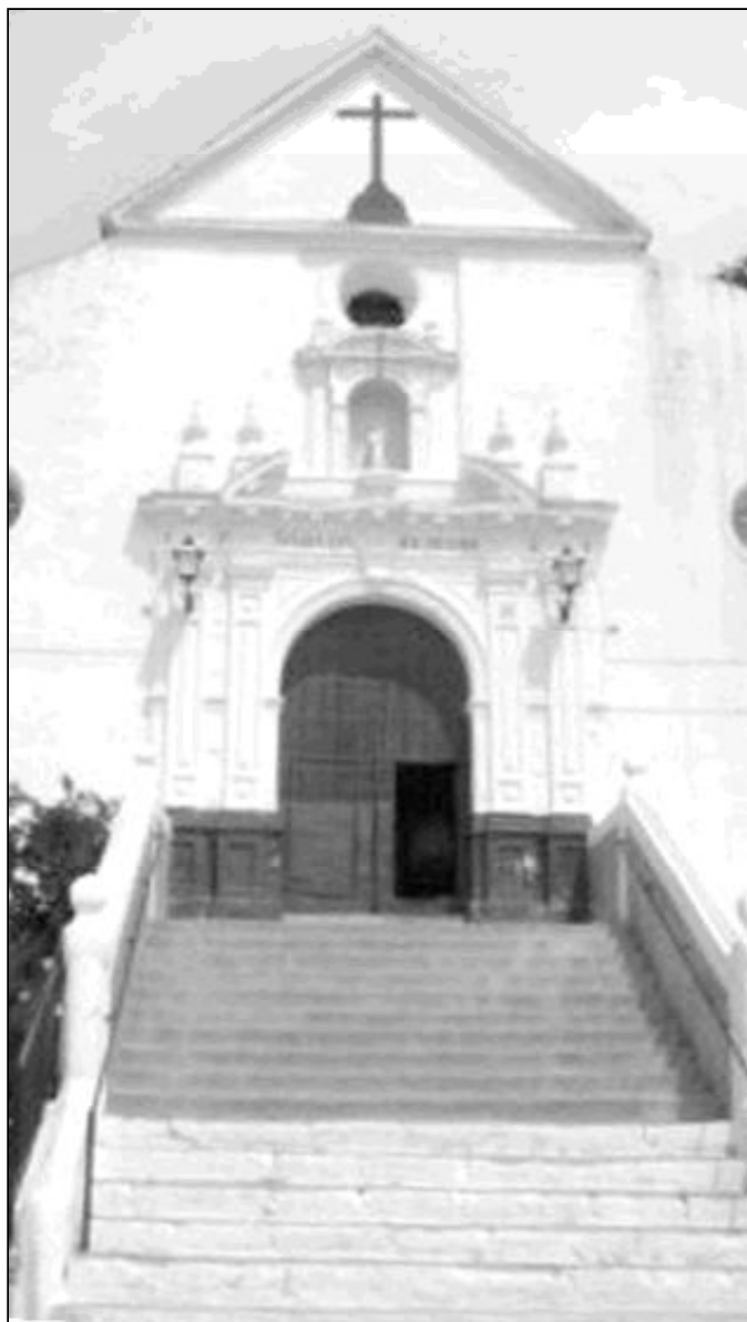
Iglesia Ntra. sra. de los Remedios, Ardales

El patrón, San Isidro, se encuentra en una de las capillas laterales, que se caracteriza por la decoración de yeserías (hojarasca, angelotes, rocallas...). Del resto de las capillas laterales destacan la de la Virgen del Rosario, la de la Virgen de los Dolores y la del Cristo de la Sangre, también conocido como el Cristo del Milagro. Esta última es una curiosa escultura ensamblada a partir de tres imágenes distintas que habían sido destrozadas en la guerra civil. La parroquia desarrolla muchas de sus actividades en el ya mencionado "convento", ya que la ubicación y la escalinata de entrada a la iglesia hacen complicado el acceso a la misma, sobre todo para las personas mayores y con discapacidad. Aquí se celebra la Eucaristía de lunes a sábado y es el lugar de encuentro de los grupos de la parroquia.