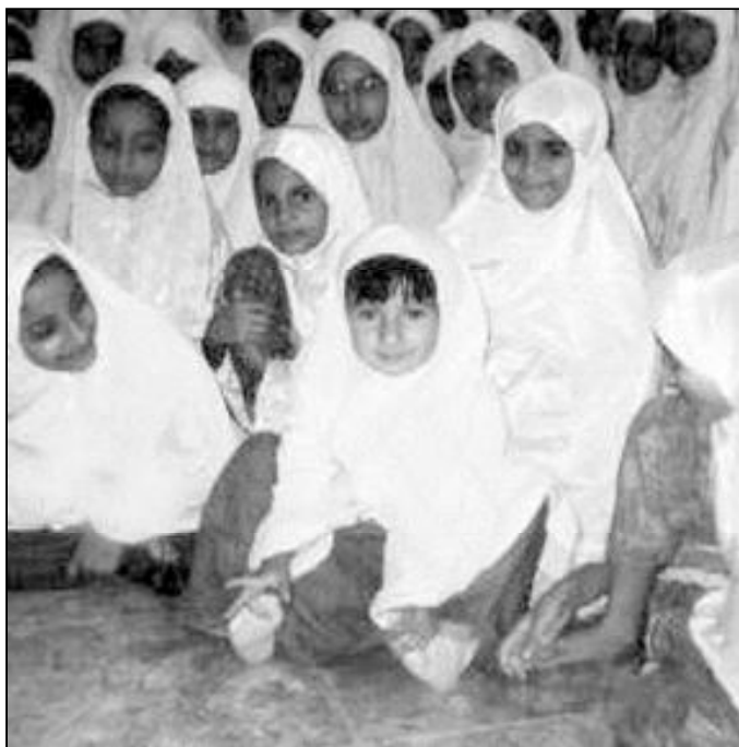
Francia prohibirá la exhibición del velo islámico en la enseñanza pública

La Cámara aboga por una ley "breve, simple y clara" que prohíba el porte "visible" de todo signo religioso y político en el recinto de los centros escolares públicos, sin distinción, por tanto, entre aulas,