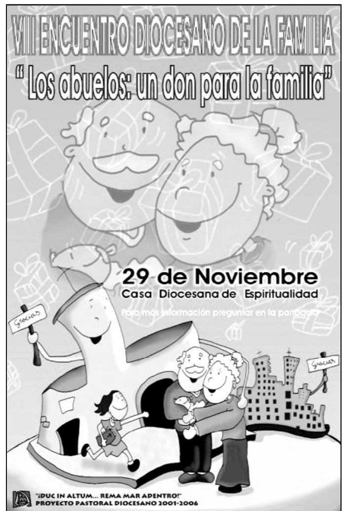
Cartel del VIII Encuentro Diocesano de la Familia