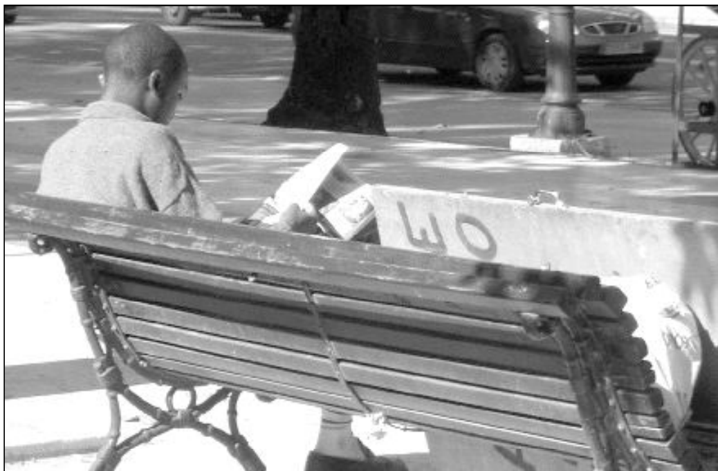
Para solucionar el problema de los sin techo es necesaria la actuación conjunta de la administración y la sociedad civil

Para los que tenemos una vivienda es difícil imaginar lo que significa carecer de ella. Pero