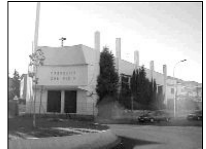
Parroquia de San Pío X

Con motivo del 50 aniversario, las Hermanitas vienen celebrando diversas actividades. El pasado domingo 23 de noviembre, el Sr. Obispo presidió la Eucaristía en la parroquia de San Pío X.