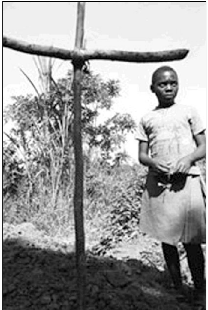
Los países más pobres son los que más sufren el azote del sida