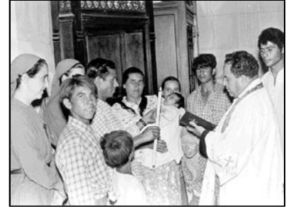
Hermanitas con unos vecinos en los años 60

- Una llamada a conocer la vida real de los pobres.