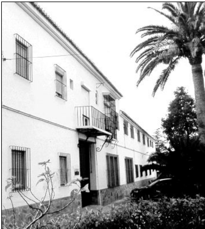
Cáritas de Málaga sostiene la Casa de acogida Colichet para enfermos de sida