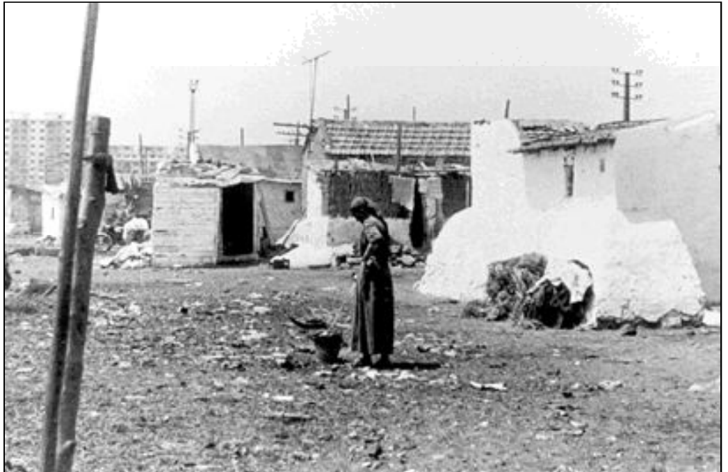
Una hermanita en las chabolas de la playa de San Andrés

El sábado día 17 se trasladan a la chabola. Los vecinos acogen a