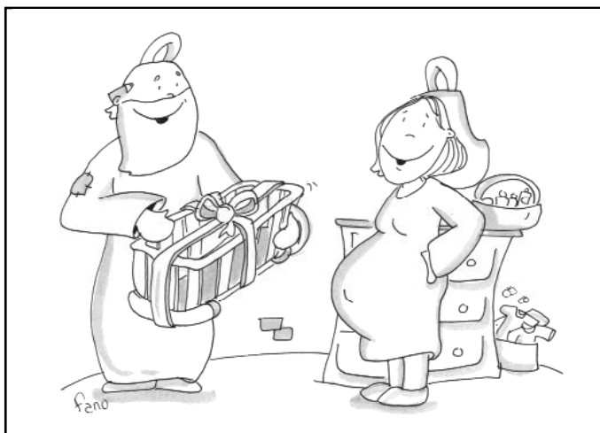
"Preparad un sitio al Señor"

Jesús es un regalo de Dios Padre. Inmerecido, desborda todo lo imaginable, don para todas las personas, por encima de razas, dases, ideologías. Así lo anuncia el evan-