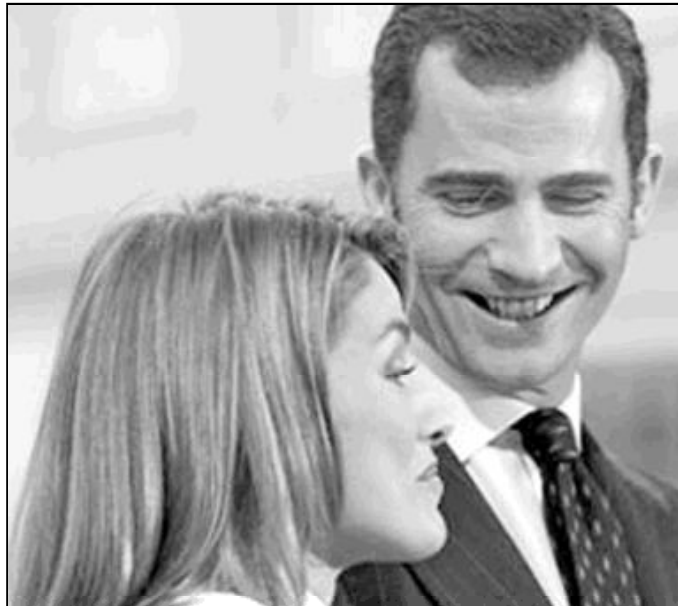
Los futuros reyes de España deberán hacer los cursillos prematrimoniales

De nuestro país saltamos a Alemania. Allí acaba de ser nombrado nuncio apostólico en