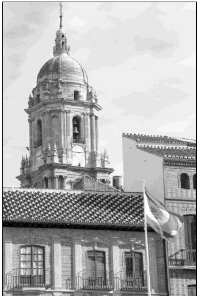
Vista de la Catedral malagueña desde la plaza de la Constitución