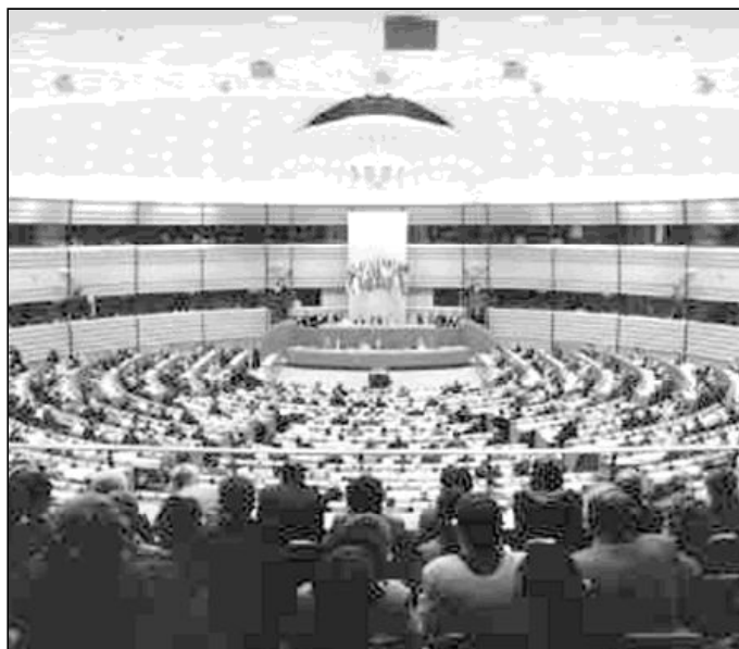
Panorámica del Parlamento Europeo

En muchas de las intervenciones del Papa, en estos últimos días, ha hecho alusión a este tema. En primer término, haciendo caer en la cuenta y desde su autoridad como Vicario de Cristo, que se debe tener presente, en las reuniones, debates, ... de los responsables la importancia del borrador de este preámbulo, su