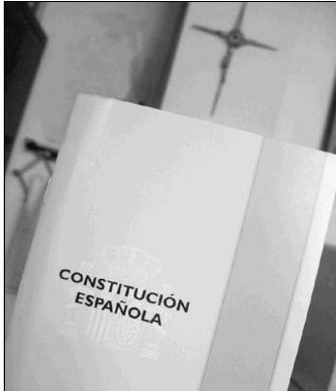
La Constitución garantiza la libertad religiosa de los españoles

-Debemos estar orgullosos de la Constitución. Fue un ejercicio de posibilismo, de auténtico consenso. En un momento difícil de la historia, los políticos y gobernantes fueron capaces -con renuncia a muchos de sus postulados- de encontrar una norma de mínimos suficiente. Todo el ordenamiento jurídico anterior y posterior se ha ajustado a la Constitución, y se han desarrollado todas las instituciones que la misma consagra. El Tribunal Constitucional se ha esforzado en una labor incesante de interpretación y de