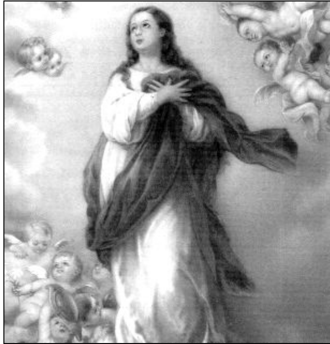
La Inmaculada Concepción

Porque en esas fechas en que la obsequiamos, también iniciamos el tiempo de Adviento y es Ella, “la senda por donde se abrevia el camino”, quien nos va a coger de la mano, para ayudarnos a recorrer estas semanas de preparación, de espera, en que vamos a revisar nuestra actitud para