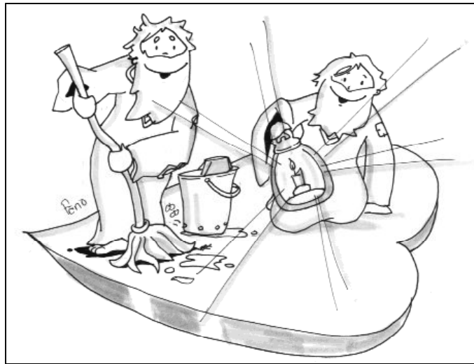
Yo os bautizo con agua. Él os bautizará con fuego

dicación de Juan el Bautista, "El que tenga dos túnicas, que las reparta con el que no tiene y el que tenga comida haga lo mismo". Aún hacen falta comedores y hogares para dormir. ¿No nos han sorprendido los últimos programas en televisión y radio sobre Bolivia, el Congo y tantos otros países? Con toda la dificultad que encierra, ¿qué sentimos ante los inmigrantes no integrados que pasean a la fuerza por las calles?