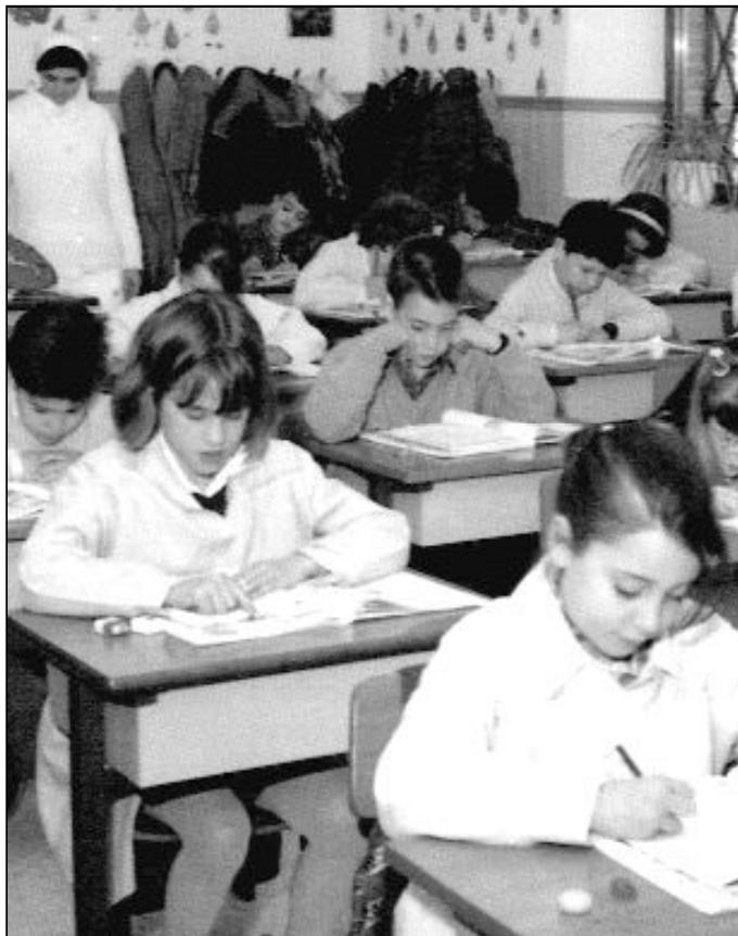
La escuela, lugar de evangelización

Desde la Delegación Diocesana de Enseñanza se intenta que todos los profesores conozcan el Proyecto Pastoral Diocesano y lo hagan suyo, porque desde el aula de un colegio se puede hacer un trabajo precioso con los