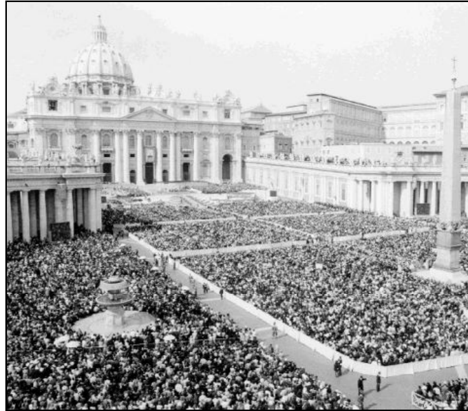
Ceremonia de canonización en la plaza de San Pedro

Lo más importante y la misma finalidad de la canonización es la ayuda que supone para acrecentar más el fervor de los miembros de la Iglesia, por la posibilidad de su