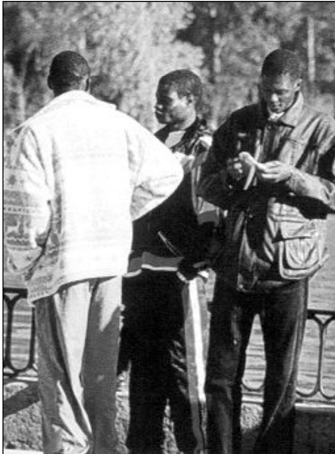
Los inmigrantes son cada vez más perseguidos por las autoridades