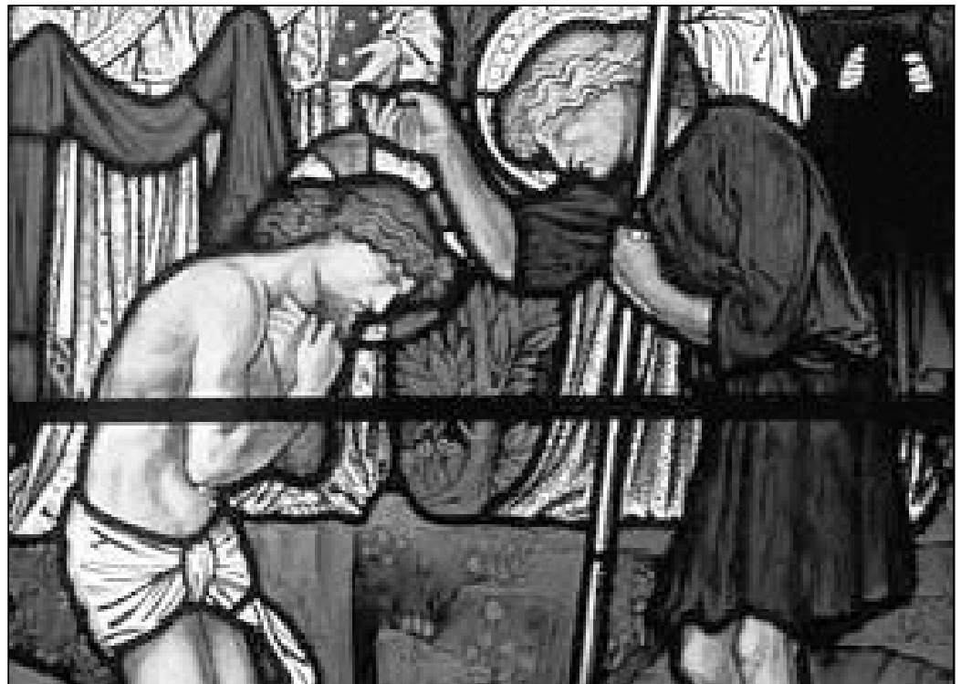
Bautismo del Señor

De esta forma, y según los datos del Obispado, cerca de 9.000 niños y mayores se abren a una vida nueva cada año. Son los bautizados, los nuevos cristianos malagueños.