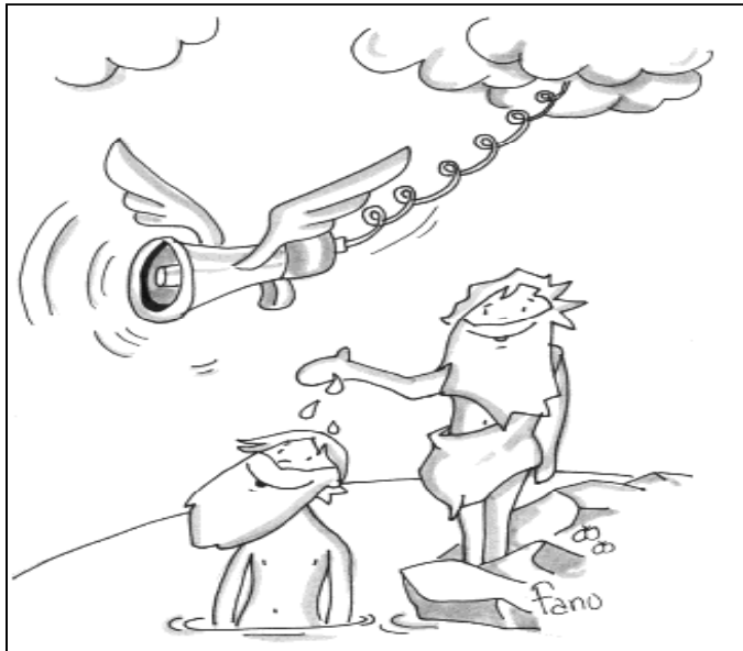
"Tú eres mi hijo el amado"

Dios Padre ha tenido una vez más misericordia con nosotros y nos ha ayudado a creer en Jesús, Hijo de Dios. Por eso Él es "la salvación", que es obra de sólo Dios, porque sólo Dios es el contenido de la liberación y de la promesa que desde el inicio de la historia salvadora se hace presente como