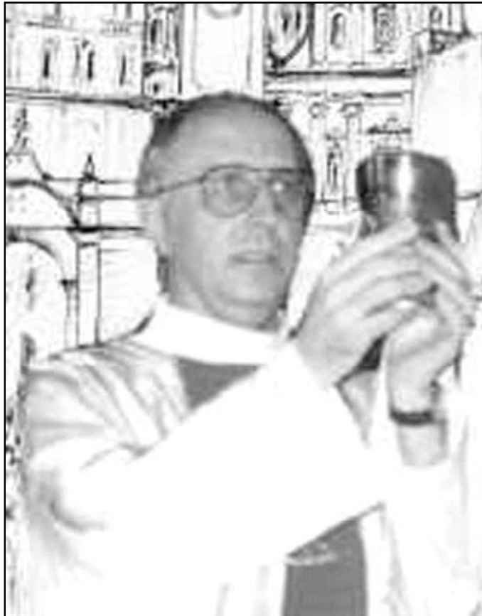
Mons. Fernando Filoni, nuncio apostólico en Irak

De Oriente Medio pasamos a otro lugar también azotado por la barbarie, Irak. Allí la misa del día de Navidad fue presidida en Bagdad por el nuncio apostólico en Irak, el arzobispo