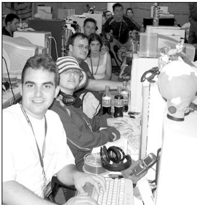
Jóvenes en una campus party o encuentro en torno al mundo de la informática

¿Cómo ocupan el tiempo con los digitales? En primer lugar con el correo. Es mucho más rápido y les permite crear un nuevo lenguaje, distinto del que aprenden en la