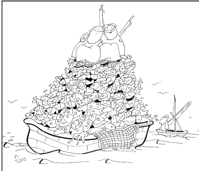
"Remad mar adentro y echad las redes para pescar"

Se ha hecho famosa la expresión del Evangelio de este domingo, "Remar mar adentro..." La escribió el Papa en el documento "Al comienzo del nuevo milenio", y ese amor adentro, aventura especial, también tiene una dirección, la mayor experiencia interior de