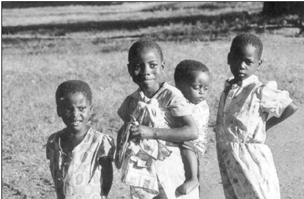
El trabajo de Manos Unidas de Málaga y Melilla posibilita el desarrollo de proyectos en todo el mundo

Los interesados en unirse a ellos pueden llamar al 952. 21.44.47.