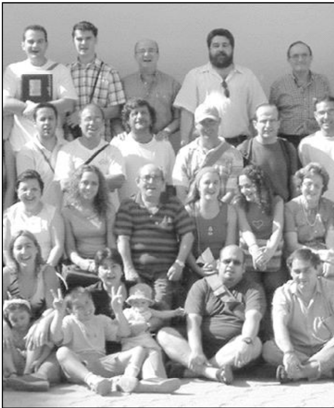
Miembros de Acción Católica en uno de sus encuentros

La Acción Católica General tiene una sección compuesta por niños; otra, por jóvenes; y otra, por adultos. Además,