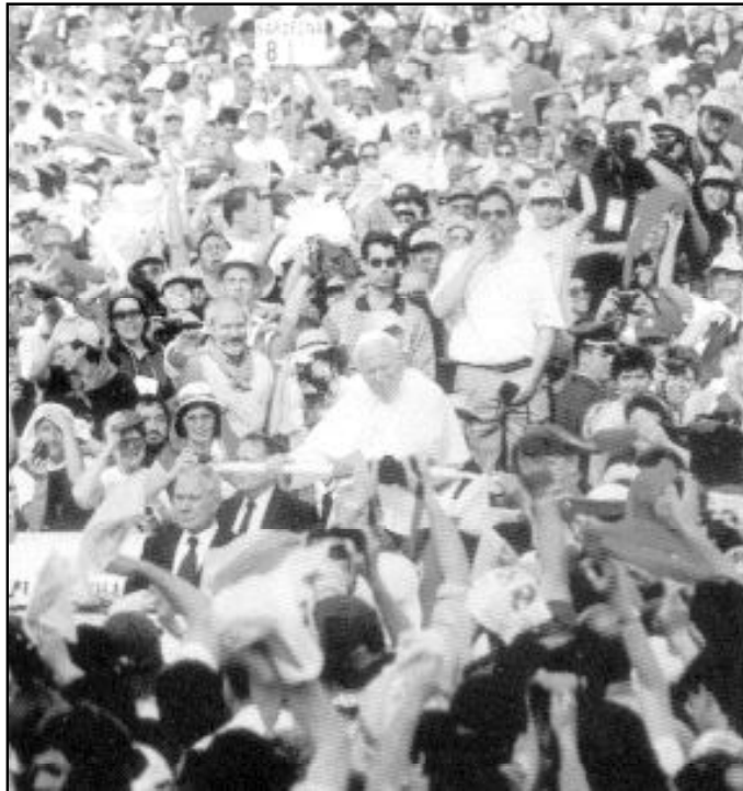
La visita del Santo Padre congregó en Madrid a católicos de toda España

Estos datos, ciertamente, redundan en el número de seminaristas. El País Vasco, antiguo semillero de misioneros, apenas tiene ya aspirantes al sacerdocio. Según los datos de la Conferencia Episcopal Española (CEE), en el año 2002, las tres diócesis vascas sólo contaban con 31 futuros sacerdotes. La situación es peor aún en Cataluña, donde el seminario interdiocesano (de cinco diócesis catalanas) apenas tiene 24 estudiantes. La diferencia con otras regiones en este punto es abismal. Mientras en Toledo hay