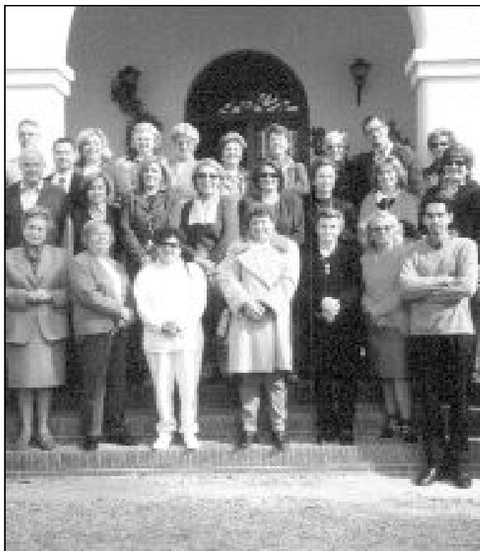
Un grupo de participantes de los Cursillos de Cristiandad

Implica también colaborar en la misión y en la proclamación del Evangelio y participar en las necesidades del servicio a la Diócesis, parroquias y centros de formación teológica que conduce al fortalecimiento de la fe. Como es sabido, el Cursillo de Cristiandad se viene celebrando