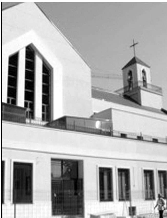
Templo de Benalmádena costa

Está distribuida en doce aulas para la catequesis, además de salas para la formación de jóvenes, adolescentes y mayores, Cáritas y salas de lectura y acti-