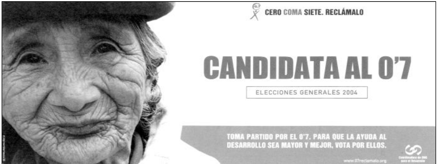
Cartel de la campaña de la CONGDE para pedir a los gobernantes que el 0,7 por ciento del PIB se destine a ayuda al desarrollo para los países pobres