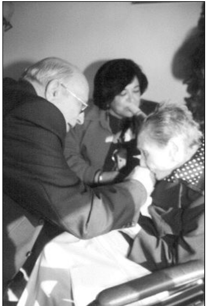
En las Visitas Pastorales, D. Antonio tiene la oportunidad de acercarse a todos