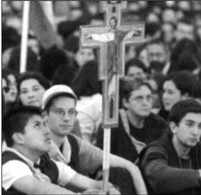
El Papa convoca más jóvenes en sus encuentros que cualquier artista

La Comisión de Enseñanza y Catequesis de la Conferencia Episcopal Española ha iniciado