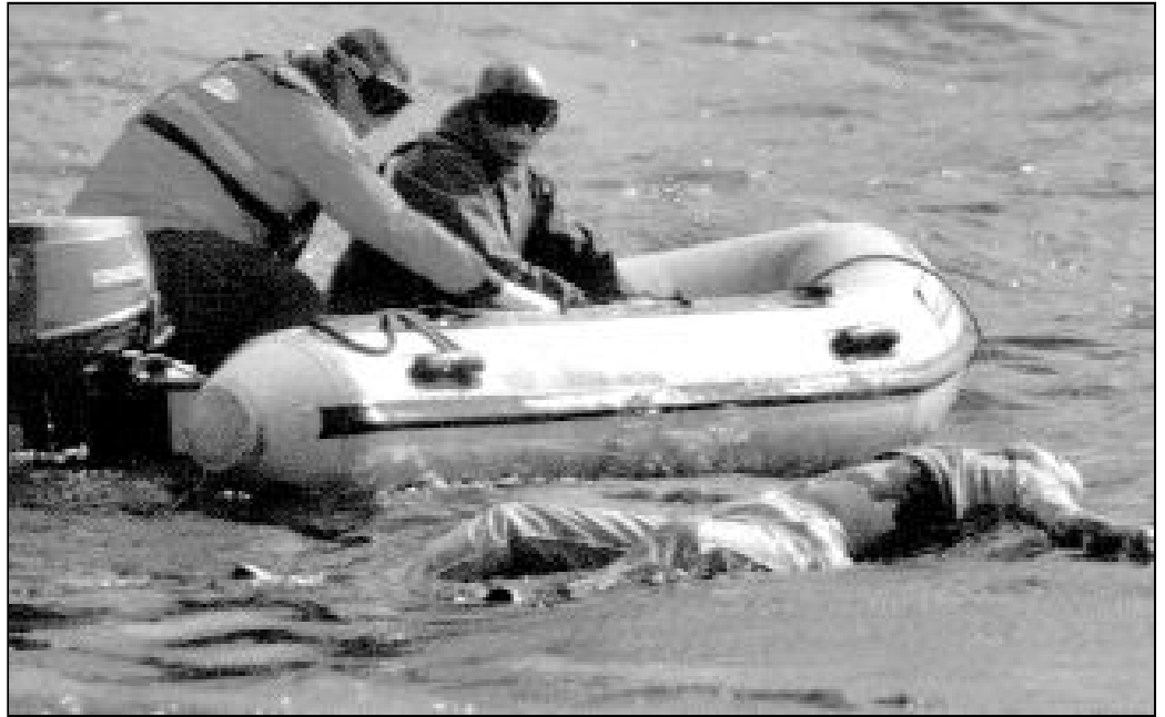
La desesperación empuja a miles de personas a asumir riesgos incalculables en busca de una vida más digna

Semejante actuación no puede tener los resultados que pretende conseguir porque no atiende a la razón primera, la que tal vez sea la causa más poderosa del fenómeno de la emigración. Esta causa sería el estado de desesperación que es capaz de empujar a miles de personas a asumir ries-