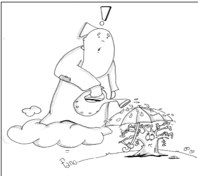
"Busco fruto y no lo encuentro..."

Dios que, como reza el salmo, hace tanto por nosotros: rescata la vida de la fosa, colma de gracia y de ternura... defiende a todos los oprimidos. Compasivo y misericordioso... se levanta su bondad sobre sus fieles". ¿Qué filósofo es capaz de decir de Dios que nos llena de ternura, que es compasi-