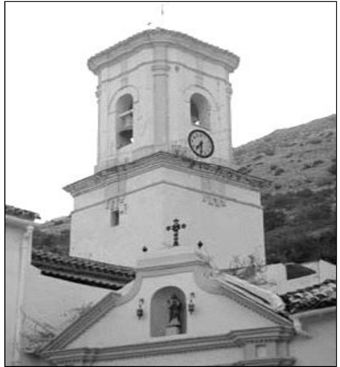
Campanario de la parroquia de Benaoján

A última hora de la tarde, se procede a la subasta de un rosco de grandes dimensiones, “el rosco del Niño del Huerto”, por el que se llegan a pujar cantidades muy elevadas. El dinero de la subasta es destinado a Cáritas, por lo que, para ellos, esta tradición tiene un sabor muy especial.