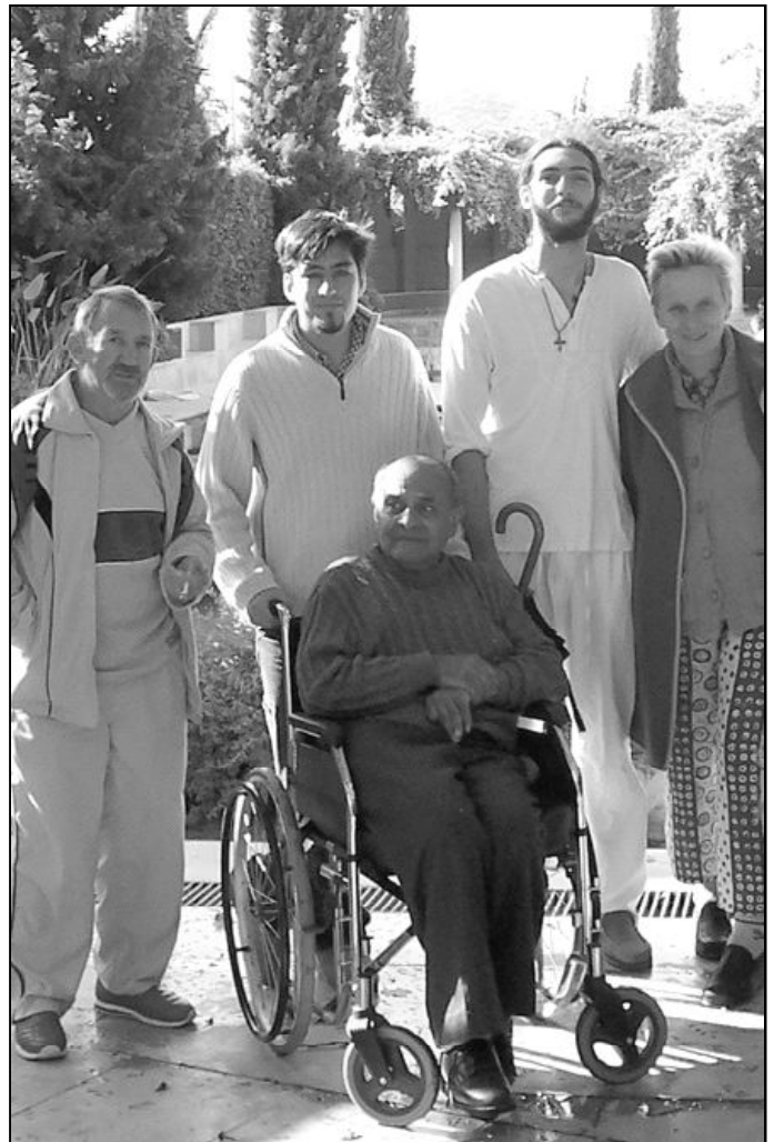
Varios seminaristas colaborando en el "Hogar Pozo Dulce"