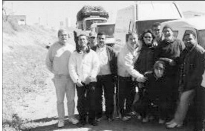
La expedición de Cáritas en un poblado cercano a Alhucemas lista para repartir calzado, alimentos, mantas y medicinas

Como ya es habitual cada año durante la Cuaresma, el señor