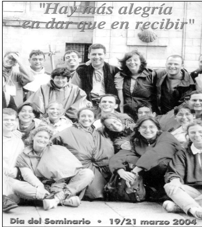
Cartel del Día del Seminario 2004

El Seminario Mayor lo forman 34 jóvenes. Resulta curioso que la mayor parte de ellos procedan de los pueblos de Málaga, sobre todo del arciprestazgo de Archidona-Campillos. Esta realidad ha hecho que los formadores del Seminario se pregunten qué falla en la animación vocacional de las parroquias de la capital. Desde la Pastoral Vocacional, se está pensando en trabajar más el tema vocacional con los catequistas, que son quienes tienen más contacto con los jóvenes. En los pueblos, el sacerdote es un habitante más de la localidad, que conoce casi de forma personal a sus fel-