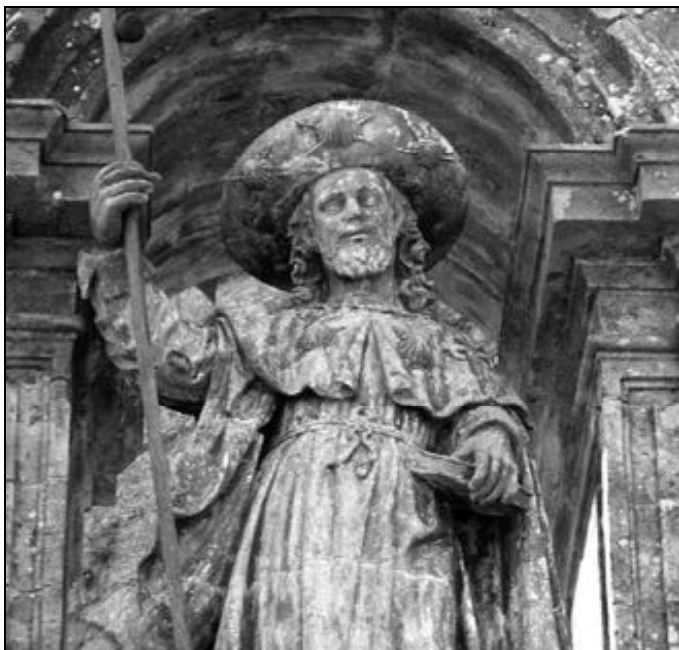
El 2004 es Año Santo Compostelano

Más difícil que construir un templo es edificar la comunidad parroquial, pues el templo termina en unos meses o unos años y es asunto de dinero, pero la comunidad cristiana es un trabajo delicado, en continua revisión. Es un don de Dios y una tarea de los fieles.