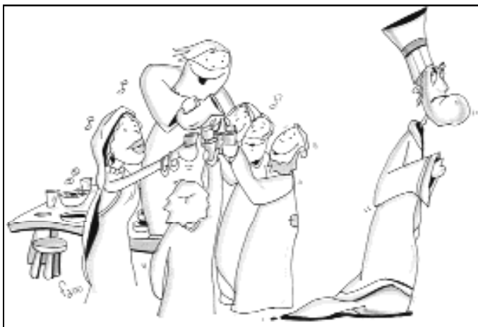
"Acoge a los pecadores y come con ellos"

Como Teresa de Lisieux decía, "es Padre y Amor misericordioso". ¿Nos lo acabamos de creer? Cuántas imágenes de Dios tenemos y, sin embargo, cercana la Pascua, Jesús nos da la que es: Dios es Padre lleno de perdón, de olvido de lo mal hecho, de amor que permanece, que crece hasta lo infinito. Toda angustia, sentido de culpa, remordimiento por el mal hecho, cuando se ha producido el