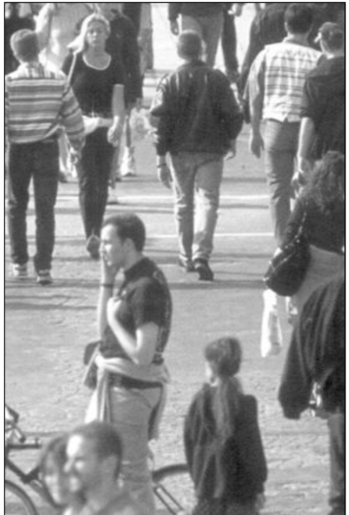
Los cristianos "de a pie" también tenemos la misión de construir un mundo mejor