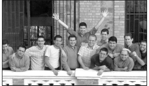
Seminaristas de los últimos cursos de Teología

El Seminario Mayor está formado en la actualidad por 34 jóvenes que serán los futuros sacerdotes de nuestra diócesis. El Seminario ofrece a los chicos un proceso de formación de siete años en los que centran su vida en la oración, la formación académica y la formación pastoral para ver cómo hacer llegar la Buena Noticia de Dios a todos los rincones de la diócesis.