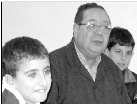
Vice-rector del Seminario Mayor con chicos del Menor

Curiosamente, existe el mismo número de sacerdotes con más de 90 años, que con menos de 30. Y, tanto unos como otros poseen la misma ilusión por responder a la llamada que el Señor les ha hecho.