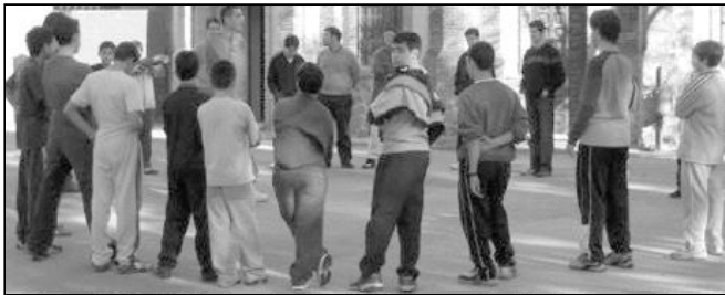
Un grupo de seminaristas menores realizando una actividad