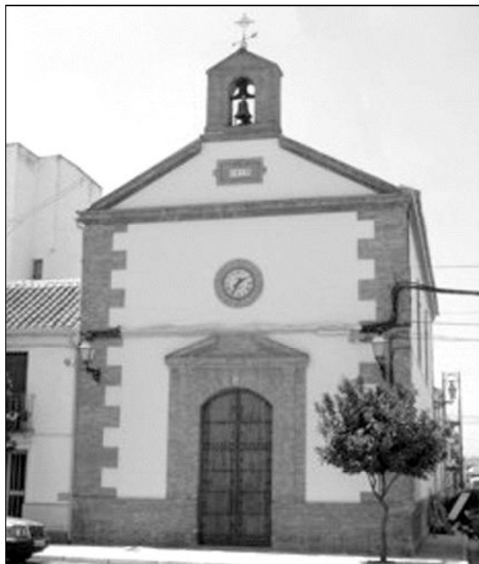
Bobadilla cuenta con dos templos parroquiales separados por tres kilómetros

Señora de los Dolores, durante el invierno se celebra la Eucaristía los martes y jueves, a las 18,00 horas; y los domingos y festivos, a las 12 de medio-