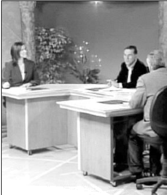
El programa "Fe y Cultura. El debate" de Popular TV, una de las iniciativas del Foro