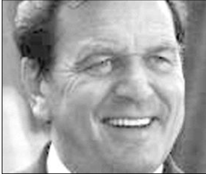
Gerhard Schröder, canciller alemán

El canciller alemán considera que Juan Pablo II ha sido un puente entre el Este y el Oeste de Europa, que ha contribuido decisivamente a la unificación pacífica del continente. Así lo testimonia Gerhard Schröder en una carta que ha escrito al Papa para felicitarle con motivo de la asignación del Premio Carlomagno. El galardón, instituido en los años cincuenta, se asigna a personas e instituciones que han tenido un papel importante en el proceso de unificación de Europa. «El Papa tiene el mérito extraordinario de haber contribuido a la unificación pacífica de Europa, de haber promovido sin descanso los contactos y el diálogo, actuando de manera decisiva como puente entre el Este y el Oeste», afirma la misiva. «La fe que alienta a los ciudadanos de los países del Este --escribe el canciller, refiriéndose a la próxima ampliación de la Unión Europea-- les ha dado el valor y la fuerza para superar los regímenes comunistas y hacer difíciles reformas».