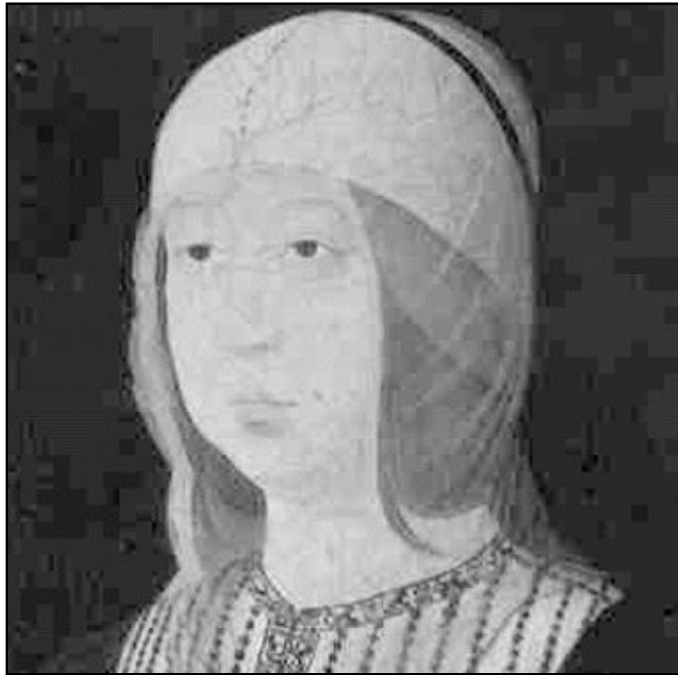
La reina Isabel la Católica

La Pascua, fiesta central en el calendario cristiano, es una fiesta móvil, pues se celebra en el primer domingo después de la luna llena del equinoccio de primavera; es decir, entre el 22 de marzo y el 25 de abril. A causa de los ajustes que caracterizaban al calendario juliano (establecido por Julio César el año 46 a.C.), el Papa Gregorio XIII (1582) esta-