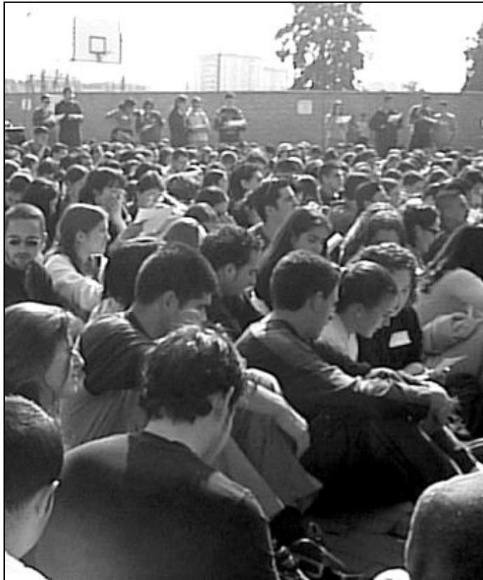
Cientos de jóvenes se reunirán este domingo en el Seminario Diocesano

A las 9,30 de la mañana comenzará la acogida de los participantes, que será llevada a cabo por miembros de Misioneros de la Esperanza. A cada participante se le entregará el