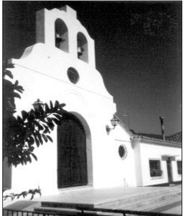
Templo de Ntra. Sra. del Carmen, en Caleta de Vélez

El 16 de julio, día de la patrona y protectora de este barrio marinero, comienza con la celebración de una Eucaristía en su honor, a la que acuden todos los vecinos. Ya por la tarde tiene lugar la procesión organizada por la Cofradía de Pescadores, que procesionan la imagen hasta la playa, donde continúa el recorrido por el mar. Más de cien barcos del puerto pesquero se engalanan para que todos puedan acompañar a la Virgen en este trayecto que ellos viven con tanto fervor.