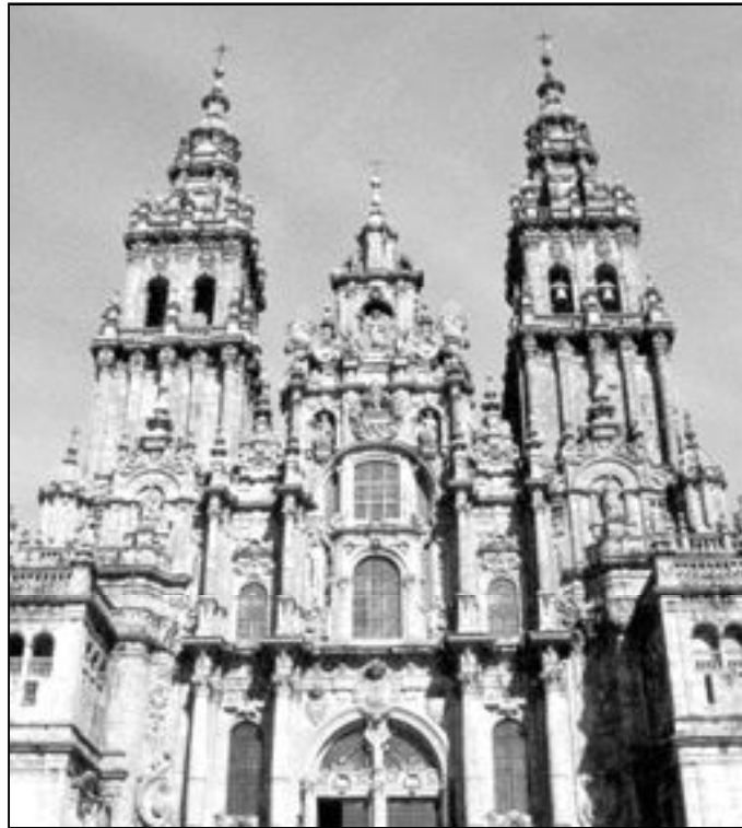
Fachada de la Catedral de Santiago de Compostela

«Implica diversos tipos de explotación de niños, mujeres y hombres --recordó-- y los somete a condiciones de esclavitud en el trabajo, a los abusos sexuales y a la mendicidad. Arrebata a las personas la dignidad que Dios les ha dado y alimenta la corrupción y el crimen organizado». «El tráfico de seres humanos ha pasado a ser una industria de