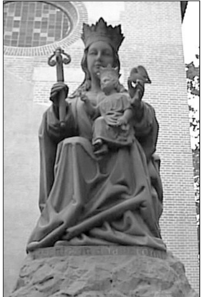
Reproducción de la Virgen de la Victoria junto a la Iglesia del Sagrario