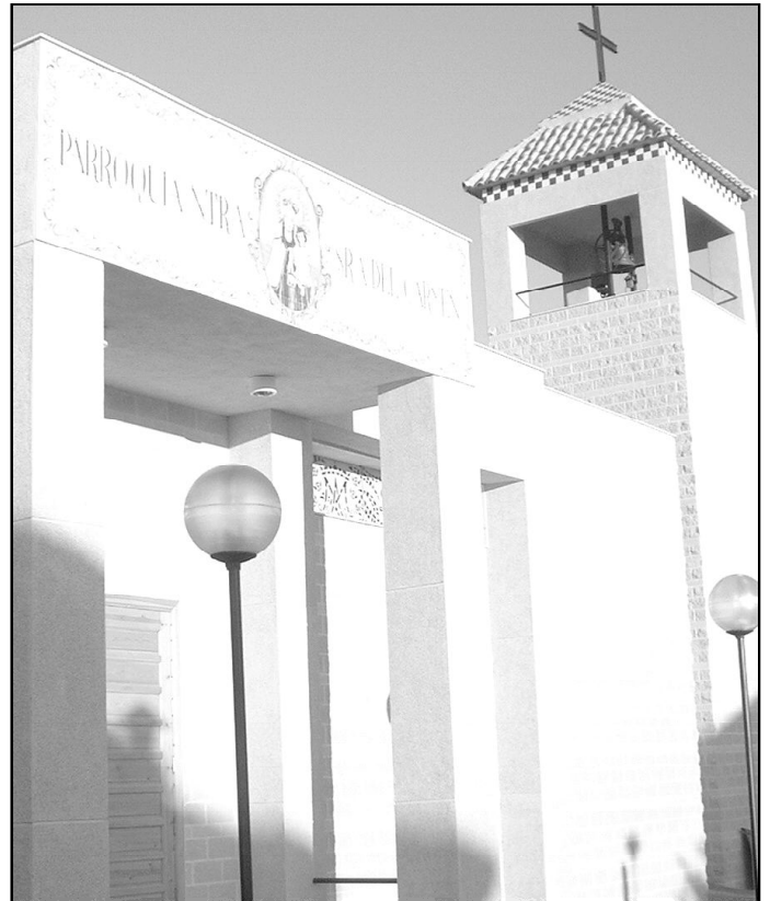
El nuevo templo de Campanillas es uno de los más modernos de la diócesis