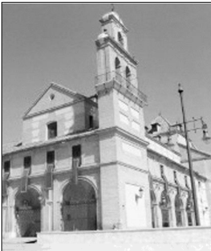
Santuario de Santa María de la Victoria

El funcionamiento de esta zona pastoral de la Diócesis, además de las numerosas actividades de cada una se caracteriza por la existencia de tres Comisiones