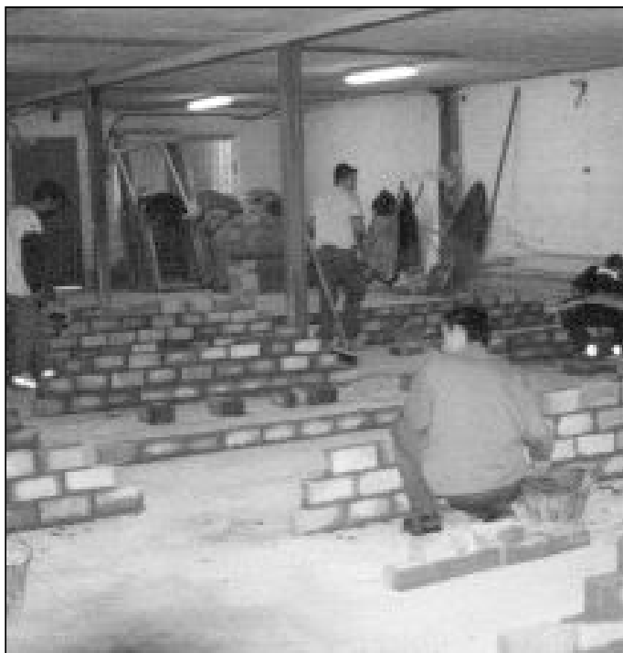
Una clase del curso de albañilería en la parroquia Santo Ángel

Este Secretariado nos recuerda que "la Iglesia no es ajena a la mundo del trabajo, porque no es ajena a la persona ni al Evangelio del trabajo (expresión utilizada por Juan Pablo II en su encíclica "Laborem Exercens" de 1981). La Iglesia está llamada a proclamar este evangelio , por eso sale al encuentro de los trabajadores y los invita a descubrir el sentido pleno del trabajo". La realidad del trabajo es tema de amplia reflexión, tanto por parte de los políticos, como de los empresarios y los trabajadores. Según los datos de la última encuesta de población acti-