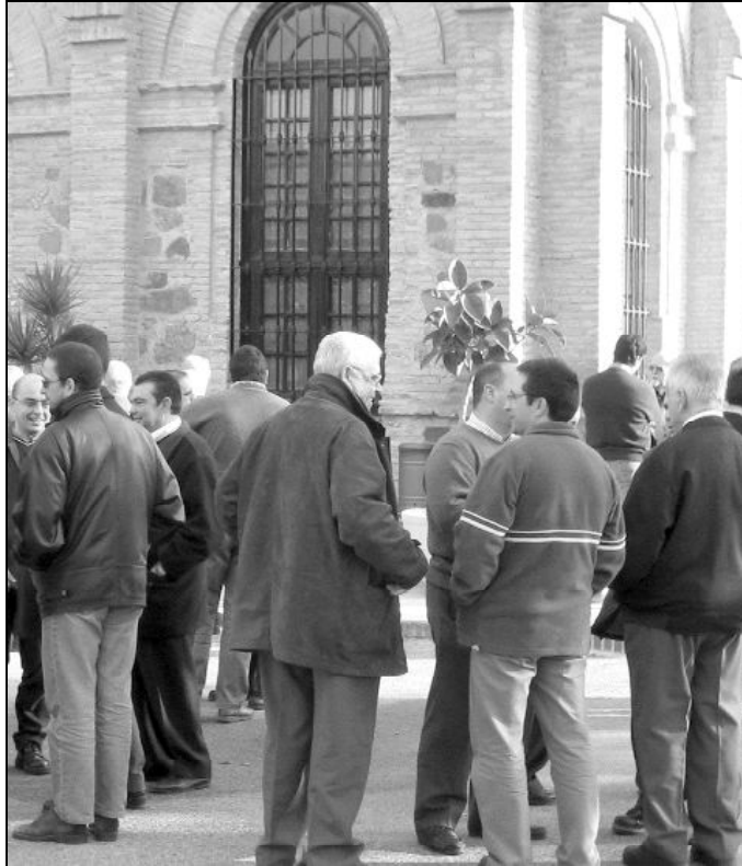
Descanso en la última convivencia del clero

Según los últimos datos que tenemos, el número total de sacerdotes de la diócesis es de