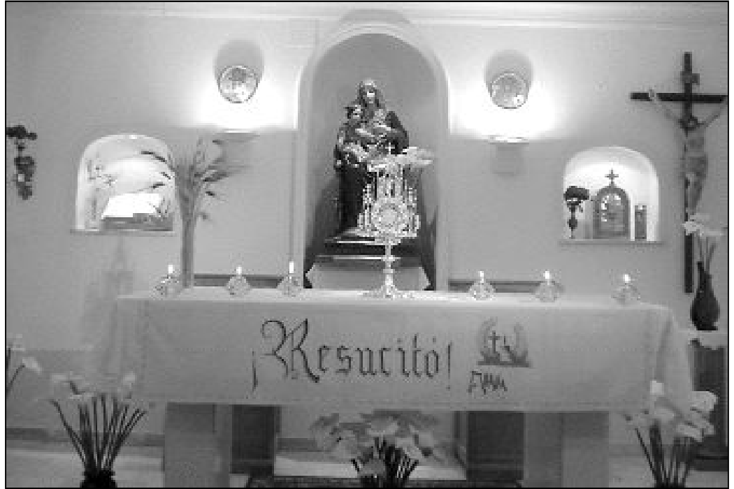
Presbiterio de la parroquia Corazón de María