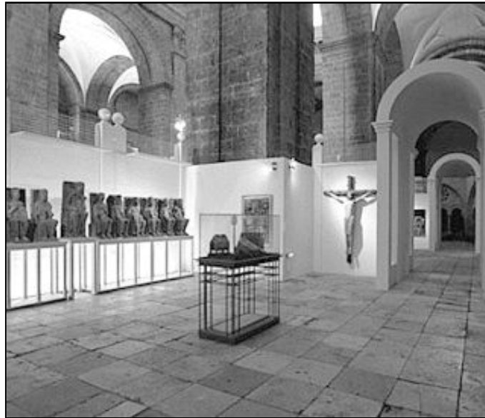
La exposición cuando se presentó en la Catedral de Segovia

De las 270 piezas que componen «Testigos», 200 son grandes obras de escultura y pintura y el resto, pequeños objetos de orfebrería y libros. Muchas proceden de las once diócesis de Castilla y León, y