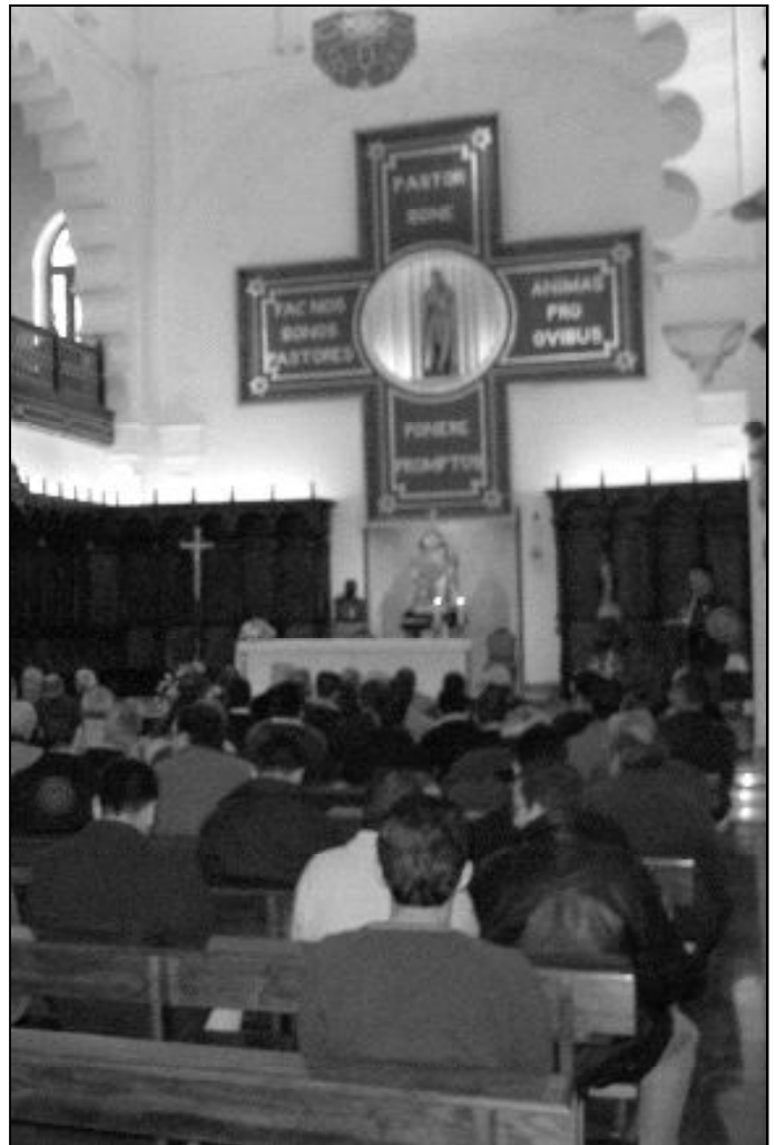
Sacerdotes diocesanos en uno de los últimos encuentros de este año