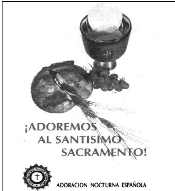
Tríptico de la Adoración Nocturna Española

Entre ellos, recordamos hoy a ANFE (Adoración Nocturna