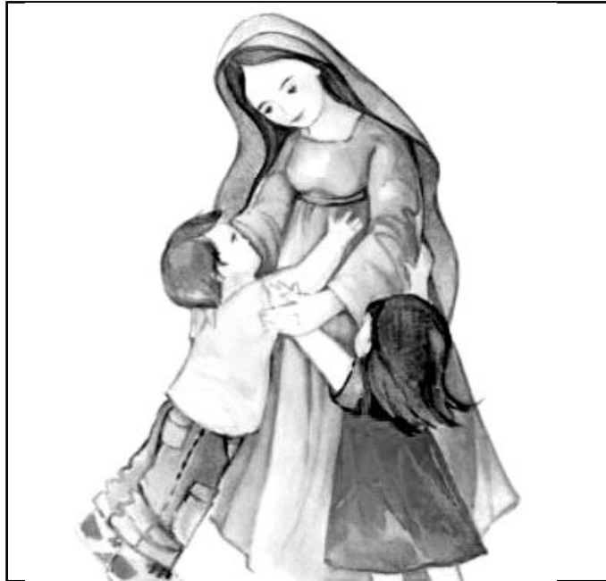
Virgen María de los Niños

En su visita a su prima Isabel, siente un íntimo alivio. Ellas perciben las caricias de Dios que las han colmado de dones y de gracias. Este encuentro hace que María haga un stop en su vida para cargar las pilas y seguir el camino extraño pero fascinante de su aventura por las rutas de lo divino. Su fortaleza la muestra de forma delicada y bella cuando se dirige a José a comunicarle el anuncio de que es su prometido. El joven, extrañado, dice que si