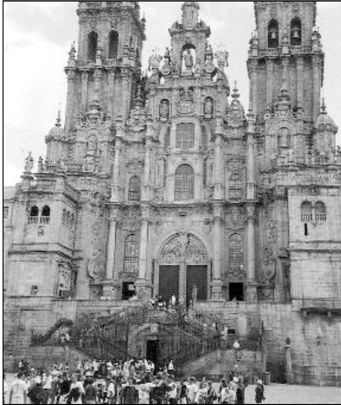
Llegada de peregrinos a la Catedral de Santiago

Es mucha la espiritualidad que el paso de los kilómetros va dejando en el alma del caminante. Así lo recogía el arzobispo de Pamplona y obispo de Tudela, D. Fernando