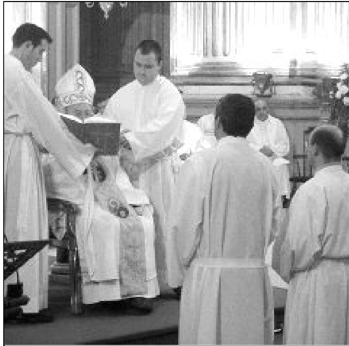
Ordenación de diáconos celebrada el sábado 15 de mayo

Hay, sin embargo, una vocación que no está de moda. En la posguerra, estaba muy bien vista y daba "pote" tener un seminarista en la familia, quizás por una reacción después de una época de anticlericalismo, o quizás por un "por si acaso", que al mismo tiem-