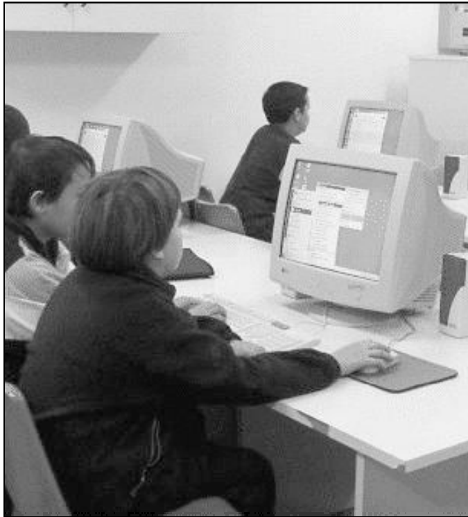
Los niños comienzan a manejar los ordenadores a una edad muy temprana