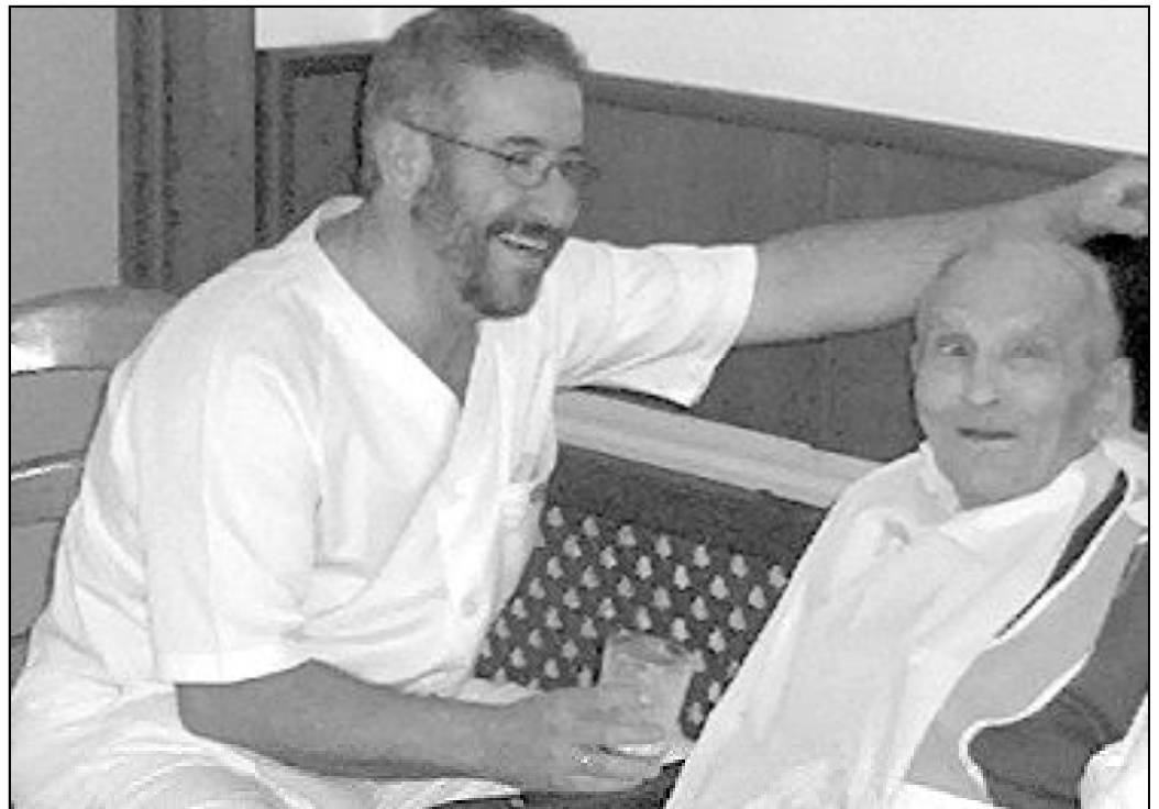
En “El Buen Samaritano” se busca la mejor calidad y calidez de vida posible