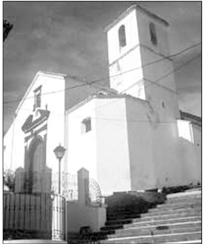
Templo de Ntra. Sra. del Rosario, en Cartajima

La cortesía es el nombre que recibe la tradición que se viene llevando a cabo el Domingo de Resurrección. Las calles se adornan con ramas y plantas, especialmente, el lugar donde se colo-