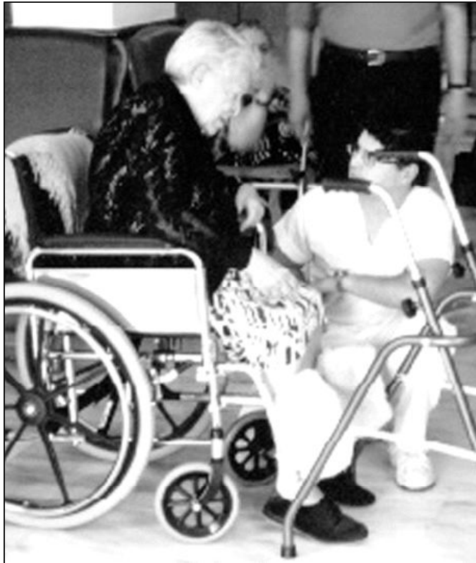
El nivel de atención personal es fundamental en "El Buen Samaritano"

Entre otros servicios, "El Buen Samaritano" cuenta también con dos plazas de "respiro familiar". Este servicio consiste en dar acogida completa durante