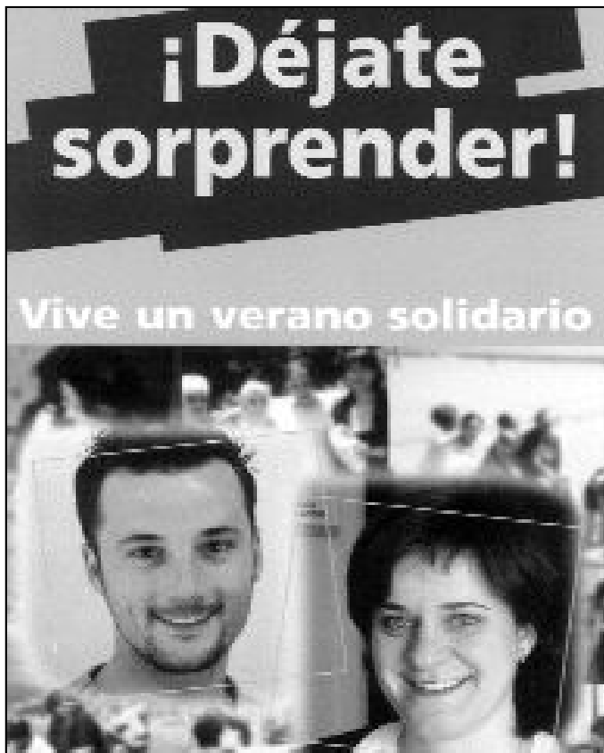
Detalle del cartel de los campos de trabajo de las Hermanas Hospitalarias