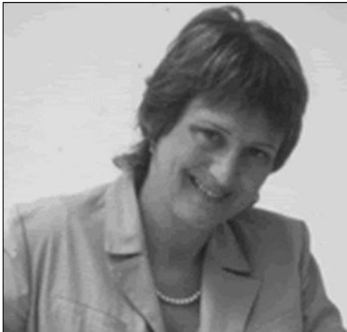
Las madres conocen a sus hijos mejor que nadie

Cualquiera que sea el problema, recuerda que puedes solucionarlo. Mira el bien y lo bueno que hay en