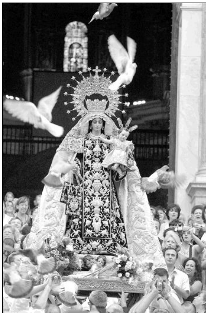
Los devotos del Carmen se cuentan por miles en Málaga