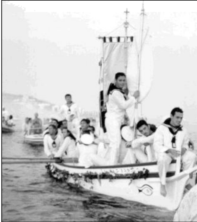
La marina sustituyó hace dos siglos el patrocinio de S. Telmo por el del Carmen

A este respecto, cabe recordar la pastoral que nuestro Sr. Obispo publicó en DIÓCESIS a primeros de mayo, en la que, entre otras cosas, nos recuerda que "la devoción a la Santísima Virgen no significa en absoluto que la equiparemos con Dios. El Concilio Vaticano II sintetiza con cuatro verbos cómo debe ser esta devoción filial, que consiste en conocerla, en amarla, en imitarla y en invocarla. No olvidemos que, además de ser su Madre, María fue la mejor discípula de Jesús, la cristiana más lograda, y tiene mucho que enseñarnos (...) En lugar de evadirlas mediante un sentimentalismo estéril, nos vendrá bien centrar nuestra devoción en estos cuatro verbos, para conocerla mejor, amarla más, imitarla en su condición de discípula de Jesús e invocarla en