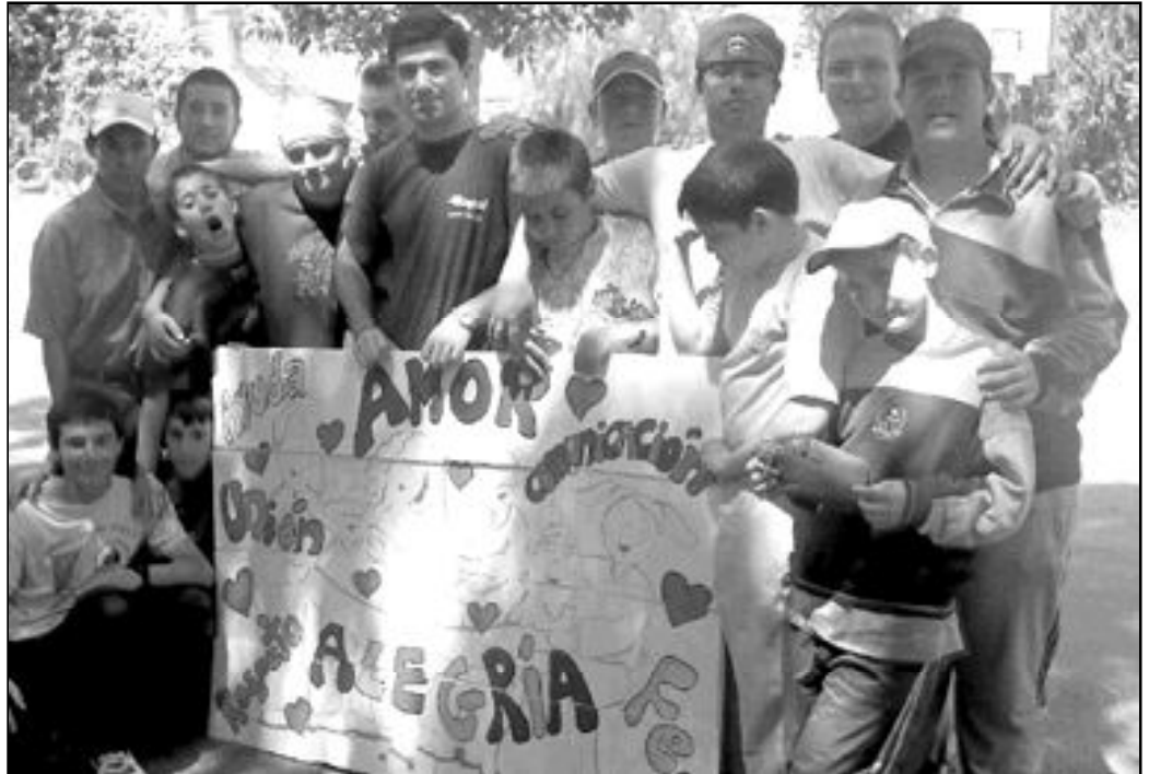
Participantes en la convivencia de verano del Seminario Menor 2003, junto a sus monitores

A lo largo de cada día, los niños y jóvenes, distribuidos por grupos y guiados siempre por un monitor que se responsabilizaba de ellos, han podido desarrollar su fe gracias a diferentes actividades, tales como la presentación del nacimiento de Jesús a través del Evangelio de Mateo, las oraciones individuales en la capilla, la cele-