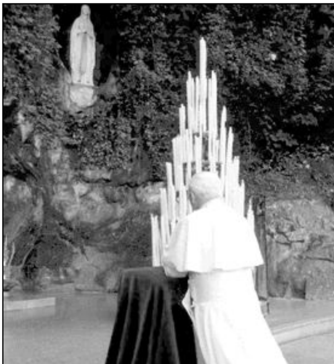
Juan Pablo II fue el primer Papa en visitar Lourdes, el año 1983

Según el portavoz del Vaticano, el Papa partirá del aeropuerto romano de Ciampino a las 9:30 del sábado 14 de agosto y aterrizará en el aeropuerto de Tarbes, desde donde se trasladará en automóvil a Lourdes. El domingo, 15 de agosto, tomará el vuelo de regreso a Roma a las 18:45, y su llegada está prevista a las 20:45. Se trata del séptimo viaje que el Papa realiza a Francia y el segundo al santuario mariano de Lourdes, aunque como ya han