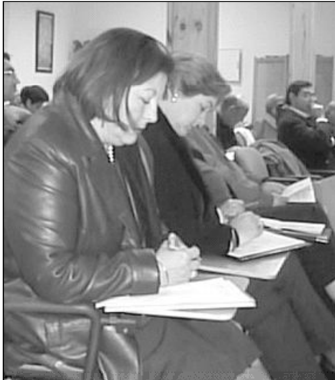
Mujeres participantes en una de las reuniones del Consejo Pastoral Diocesano

«Las tres expresaron admirablemente la síntesis entre contemplación y acción. Su vida y sus obras testimonian con gran elocuencia la fuerza de Cristo resucitado, que vive en su Iglesia: fuerza del amor generoso por Dios y por el hombre, fuerza de auténtica renovación moral y civil».