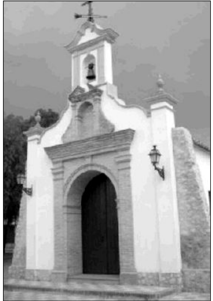
Templo de la Purísima Concepción de María, en Cartaojal

En Cartaojal existe una especial devoción a María Auxiliadora. Durante todo el año, la asociación que lleva su nombre se encarga de promover distintos actos cuyo fin es el de recaudar fondos para el día de la Patrona. Así pues, la jornada del primer domingo de julio amanece repleta de actividades organizadas por las mujeres que compo-