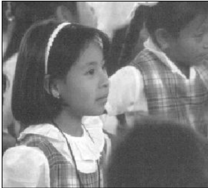
La libertad religiosa sigue siendo vulnerada en numerosos puntos del planeta