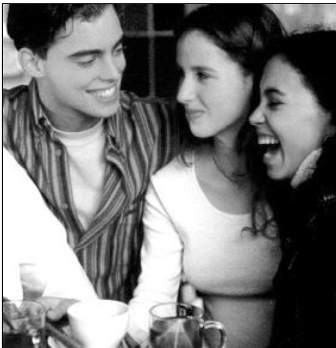
Los adolescentes eligen un look en busca de su propia identidad

Tener un look es como enviar un mensaje a los demás acerca de sus propios valores y su concepción de