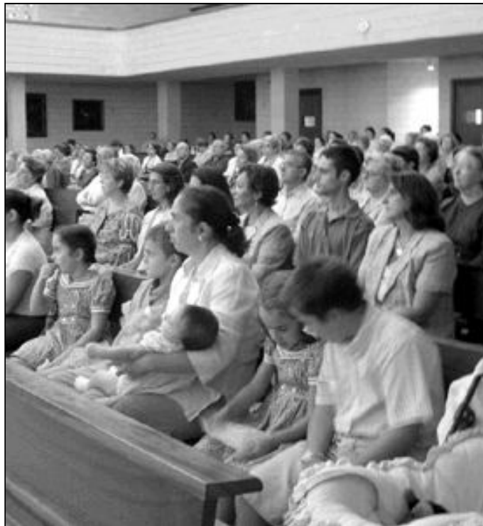
El silencio es un elemento indispensable en nuestras celebraciones litúrgicas

A los equipos de animación litúrgica cuando preparan las celebraciones, y a algunos sacerdotes, les da miedo tener silencios en la celebración. Existe la conciencia de que es un tiempo perdido, vacío y hay que llenarlo a toda costa. Es el abuso de las palabras en la celebración, donde cabe todo menos el silencio. Esto es una realidad a la que el Misal le da mucha importancia y, en los principios y normas que nos indican la forma de celebrar la eucaristía, dice cómo deben ser esos tiempos que “dependen de los momentos de la