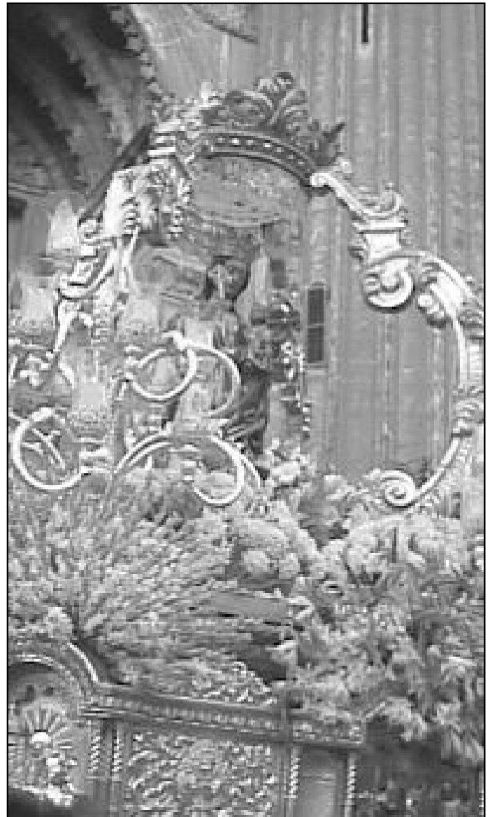
La patrona de la diócesis de Málaga, a su salida de la Catedral