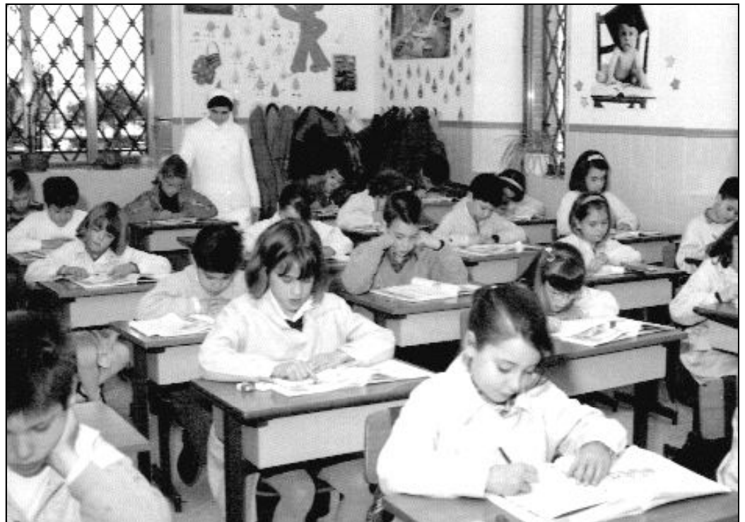
Las instituciones escolares no son "aparcaniños", sino colaboradores de los padres en la educación de los hijos