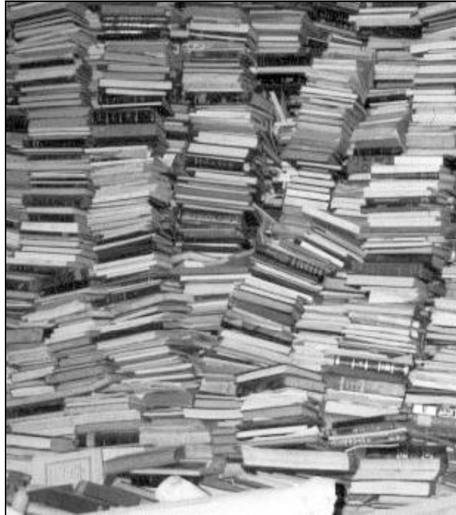
El patrimonio histórico-bibliográfico de la Iglesia es impresionante

estos más de veinte siglos, ha vivido y sigue viviendo las dos dimensiones del pasado y del presente con una vitalidad increíble y encomiable. Desde su fundación hasta hoy, la Iglesia mantiene el fuego de la hoguera cultural y religiosa como monumento vivo conservado y reavivado en sus tesoros artísticos, históricos, literarios y documentales de ayer y de hoy.