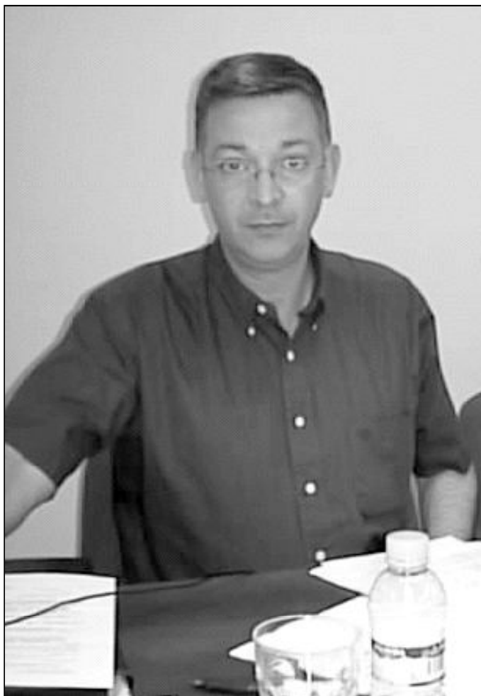
El hasta ahora Secretario General marchará un año a Madrid para doctorarse

Un sacerdote joven de esta diócesis leía hace unos días un libro titulado "Ser sacerdote hoy", cuyo autor es Gisbert Greshake. Entre tantas páginas sabias sobre la situación actual de los sacerdotes destacaba que "la obediencia en Jesús es un radical desasimilamiento de sí mismo, Él no se reserva nada para sí, no se aferra a nada, sino que se humilla y hace una entrega total de sí mismo. Por tanto, el servicio pastoral se fundamenta en la actitud personal de escuchar la Palabra de Dios, o genera un dercalismo que sólo sabe desempeñar funciones. La obediencia es -con suprema lógica- entrega de la pro-