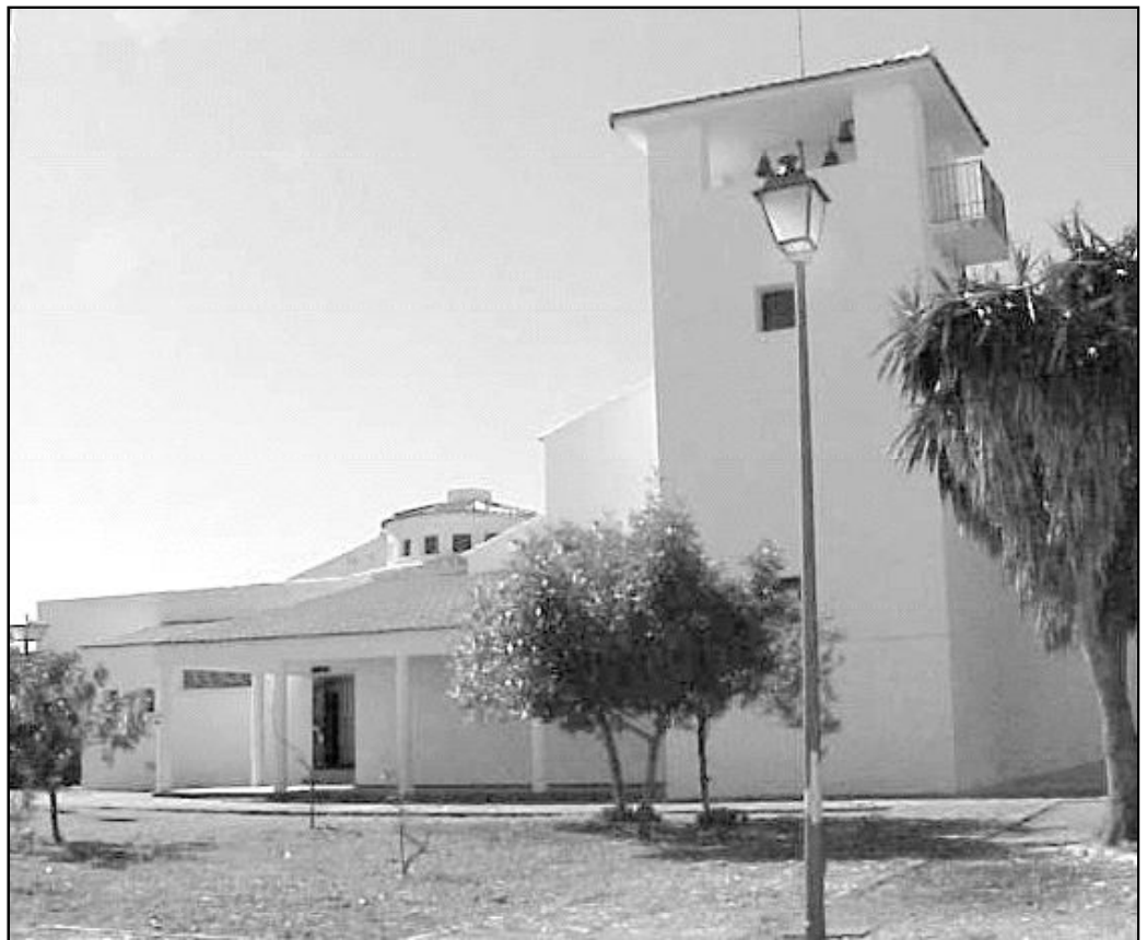
El templo parroquial de Cerralba es una moderna construcción dedicada a Ntra. Sra. de la Rosa

La fiesta grande de la Barriada se celebra a mediados del mes de Junio, disfrutando de tres días de Feria, a la que cada año asisten más visitantes.