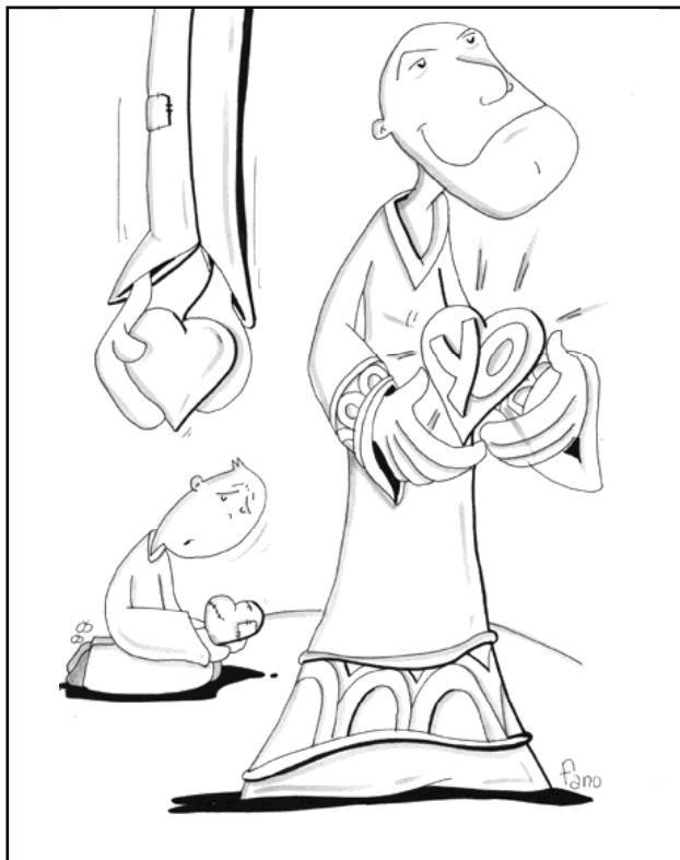
"El que se humilla será enaltecido"

dad de que nada somos ante Dios, que nada tenemos que Él no nos haya dado, que nada podemos sin que Dios lo haga en nosotros.