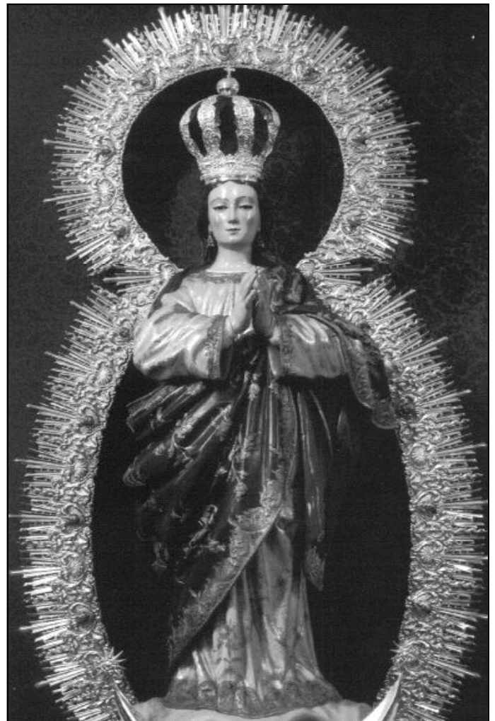
La Inmaculada Concepción de María ha sido motivo de numerosas obras de arte