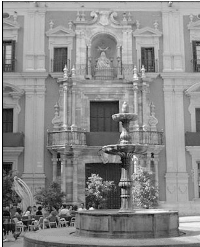
El Palacio Episcopal albergará la Magna Exposición "Tota Pulchra"

A continuación, pasamos de lo general a lo cercano, y nos venimos a Málaga. Aunque es cierto que no fue mucho el peso de nuestra ciudad en el proceso