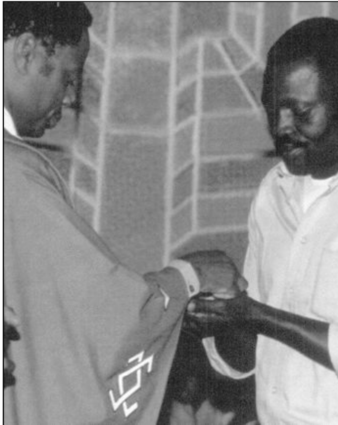
En la Eucaristía se irradia el mensaje de Cristo, luz del Mundo

En la ciudad mexicana, explicó el Santo Padre, «durante ocho días se ha celebrado y adorado a la Eucaristía como "luz y vida del nuevo milenio". "Luz", porque en el misterio eucarístico se irradia la presencia de Cristo, Luz del mundo; "vida", porque, en la Eucaristía, Jesús se nos ha entregado como Pan de la vida». «En el surco del Concilio Vaticano II y del Gran Jubileo del año 2000 -subrayó-, el Año de la Eucaristía quiere ser un tiempo fuerte de encuentro con Cristo, presente en el Sacramento de su Cuerpo y de su Sangre». El deseo del Papa, manifestado al final de su intervención, es que este año, que conducirá con el Sínodo de obispos sobre la Eucaristía, previsto para octubre de 2005, se convierta en «un momento de profunda conversión a Cristo y de intenso compromiso para difundir su