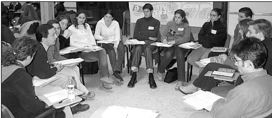
Uno de los grupos de trabajo de un encuentro de universitarios cristianos

nes cristianos den testimonio de su fe en el ocio, en el trabajo, en los estudios, y en todos los momentos de su vida. También es importante que pongan en común esta experiencia, ése es uno de los objetivos que mueve a Pastoral Universitaria a celebrar el XIII Encuentro Universitario Cristia-no, que tendrá lugar el próximo domingo, 7 de noviembre, en la Casa Diocesana de Espirituali-dad.