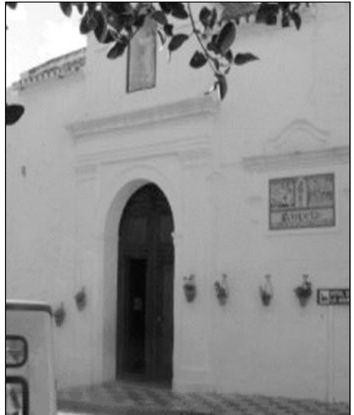
Fachada de la parroquia Ntra. Sra. de la Asunción, de Cómputa

Existen en Cómputa siete hermandades, muestra de una gran tradición de Semana Santa, que se ha ido transmitiendo de generación en generación. En estos días, son los jóvenes los encargados de representar la Pasión de Cristo. Además, el Viernes Santo, tiene lugar el Via Crucis o Procesión de los hombres, en la que el respeto y el silencio inundan las calles del pueblo.