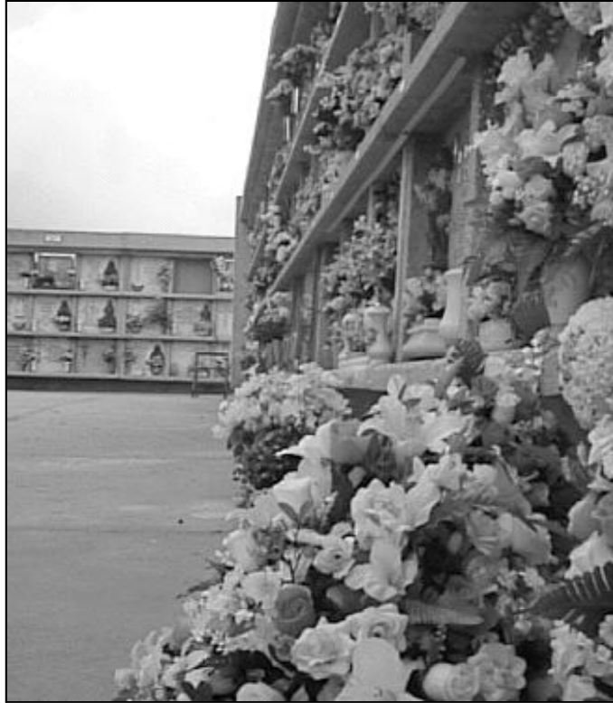
"Cada persona hace el camino de duelo a su manera"

El duelo acompaña a la muerte. Cada uno de nosotros lo encuentra en su camino, día tras día. Afecta a nuestro ser completo a causa del lazo personal con la persona fallecida. Este lazo se rompe, se experimenta el vacío y la ausencia. Hay que aprender a vivir de otro modo.