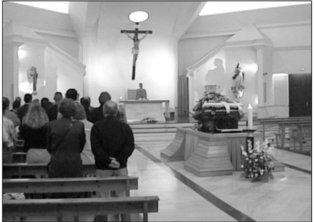
En la celebración de la Misa por un difunto, la Iglesia ora por él, por su familia y expresa su fe en la resurrección

La fiesta más importante para el cristiano es la Eucaristía, y por este motivo, ante la muerte de una persona, los familiares y amigos se reúnen para celebrar-