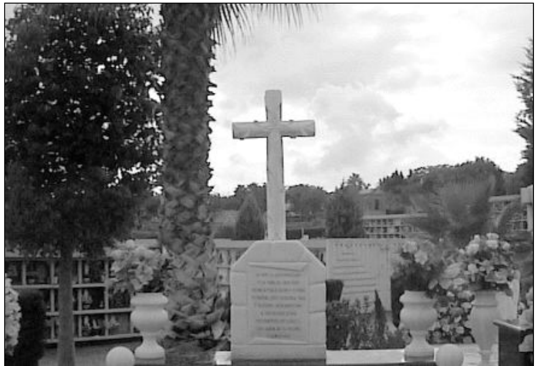
La Fiesta de todos los santos celebramos la unión de la Iglesia de la tierra y la del cielo