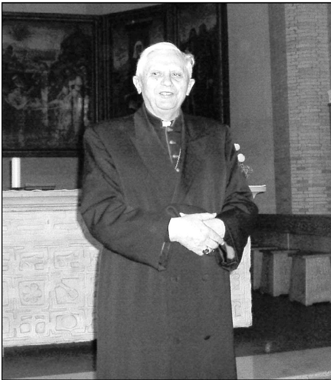
Ratzinger llama a los cristianos a afrontar con valentía los desafíos de la sociedad

«Existen patologías de la religión y de la razón y ambas constituyen peligros mortales para la paz y, me atrevería a decir, para la entera humanidad», ha afirmado en un artículo publicado por la revista Vida y Pensamiento el cardenal Joseph Ratzinger en Italia. «Si la imagen de Dios se convierte en algo parcial hasta identificar el absoluto de Dios con una comunidad concreta o con ciertos intereses de la misma, destruye el derecho y la moral», indica el cardenal. «También existe la patología de la razón totalmente separada de Dios», subraya Ratzinger en el artículo que lleva por título Occidente, Islam y los fundamentos de la paz . «Lo hemos visto en las ideologías totalitarias que negaban toda relación con Dios e intentaban así construir el hombre nuevo, el mundo nuevo». En este sentido, el cardenal cita los ejemplos de Adolf Hitler, «de los realizadores del marxismo» y de los comunistas de Camboya, «quizá la expresión más dramática de esta patología de la razón». «Sólo una razón que se mantenga abierta a Dios, una razón que no exilia la moral a la esfera subjetiva y no la reduce a puro cálculo, puede evitar la manipulación de la noción de Dios y las enfermedades de la religión y puede ofrecer alguna terapia», escribe. El car-