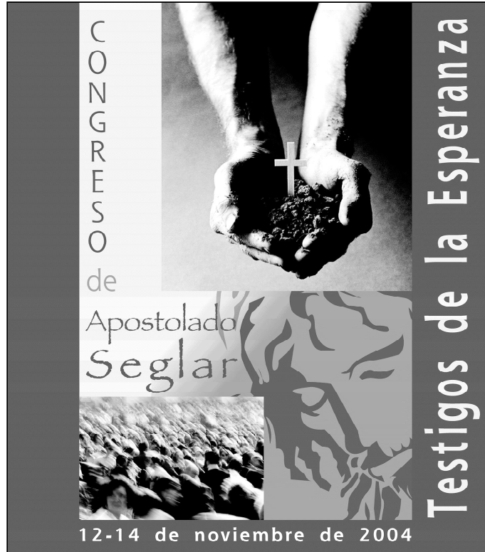
Detalle del cartel editado con motivo del Congreso de Apostolado Seglar

La ventaja de estas dificultades es que están haciendo reaccionar a los católicos de a pie. Las diversas plataformas que se han movilizadas para recoger firmas en favor de la enseñanza de la religión o de la familia son un ejemplo más de que algo se está moviendo dentro del Pueblo de Dios. Y es que la misión específica de los seglares cristianos no consiste sólo en dar catequesis o en promover la beneficencia, sino en actuar en el campo sindical, político, cultural y docente para que avance la implantación de los valores cristianos en la sociedad. Entre ellos, y como parte integrante del Evangelio, los derechos humanos, el derecho que asiste a los padres a decidir qué tipo de educación desean para sus hijos, el derecho de los niños