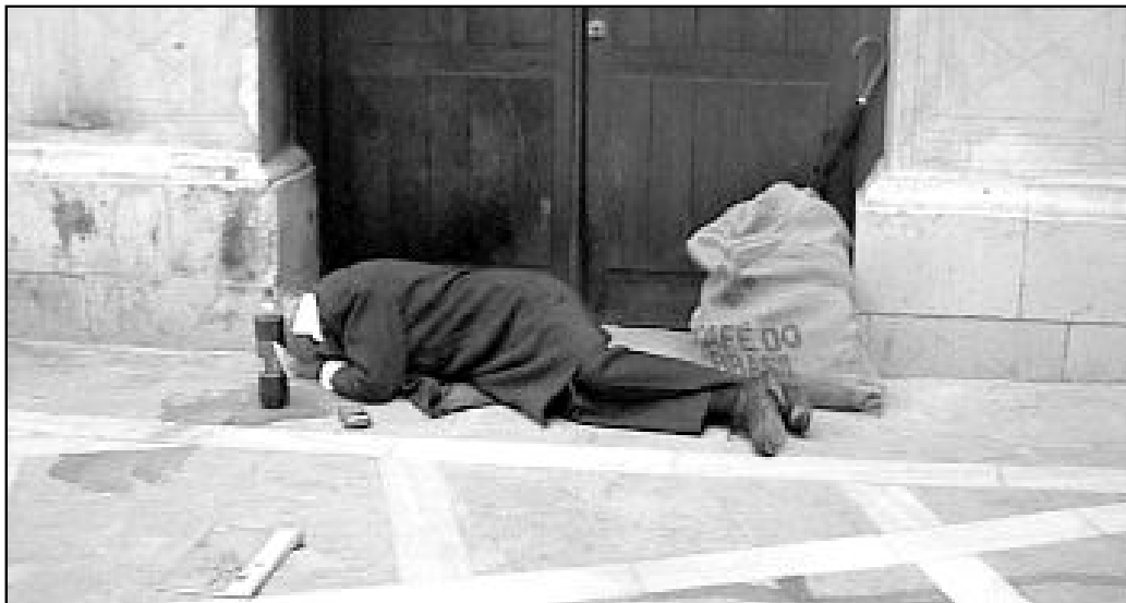
En Málaga sólo hay 223 plazas para acoger a un total de 400 personas "sin techo"

reinserción social tienen una menor presencia, solo un 13% de ellas.