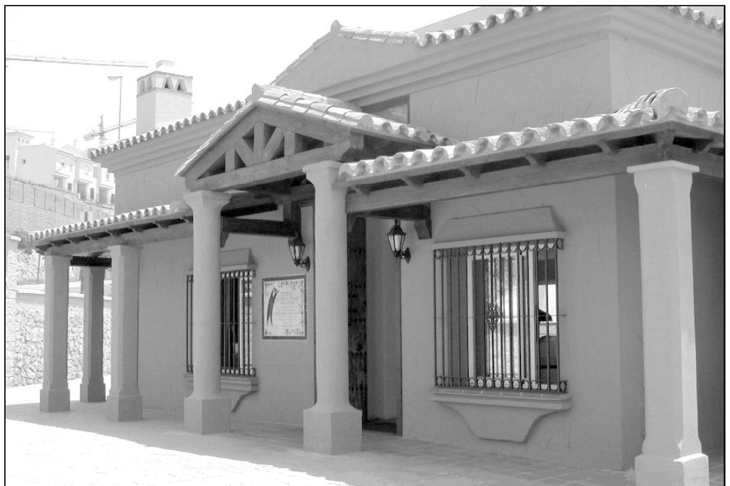
Fachada de la sede de la Fundación CUDECA, en Arroyo de la Miel