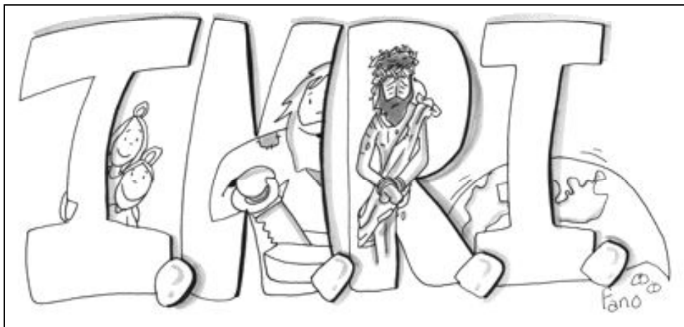
“Jesús Nazareno REY de los judíos”