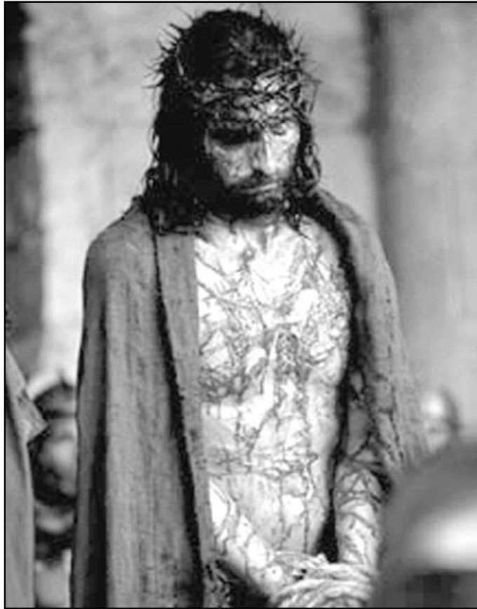
Fotograma de la película "La Pasión de Cristo", dirigida por Mel Gibson

La Biblia decía que el envejecimiento del hombre no proviene de su cuerpo, sino de su corazón. Y cuando san Pablo denuncia la carne, no es al cuerpo a quien con-