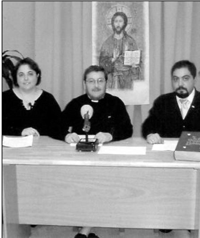
En Mijas Costa la apuesta por los medios es decidida