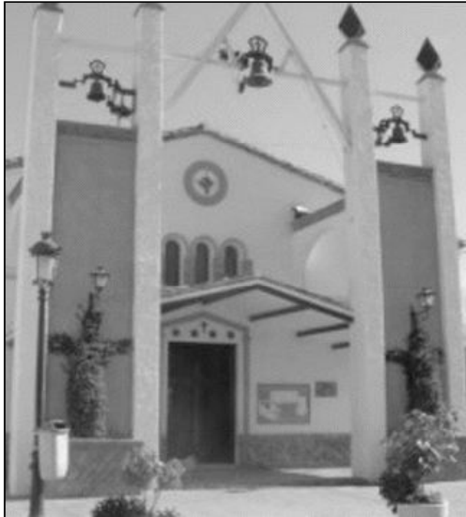
Parroquia de San Antonio Abad, en Churriana

Para los días 16 y 17 están previstas la procesión y Eucaristía en honor al patrón. Todos estos eventos concluirán con una celebración eucarística oficiada por el Sr. Obispo,