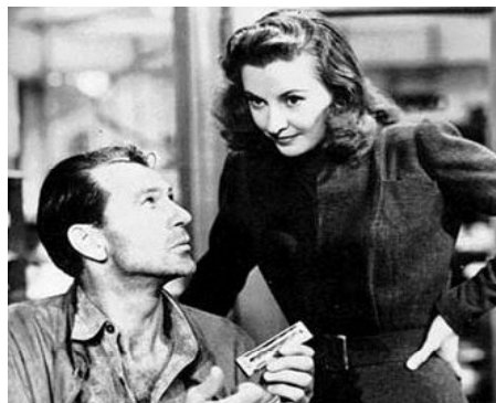
Fotograma de la película "Juan Nadie"

Y ahí está mi Buena Noticia de hoy, me enfrenté de nuevo a una película que me hace sentir persona: "Juan Nadie". Una película de los cuarenta con un tema maravilloso. El des-