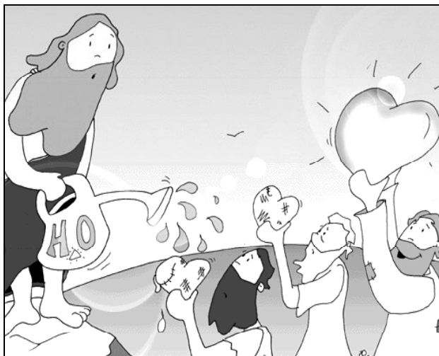
“Soy yo el que necesito que tú me bautices ¿y tú acudes a mí?”

tuvo Pedro. Y la Iglesia en su conjunto lo mismo. Nunca existirá la comunidad perfecta, sin mancha ni arruga. El Concilio Vaticano II lo recordó: “La Iglesia ... es a la vez santa y siempre necesitada de purificación y busca sin cesar la conversión y renovación” (LG.8)