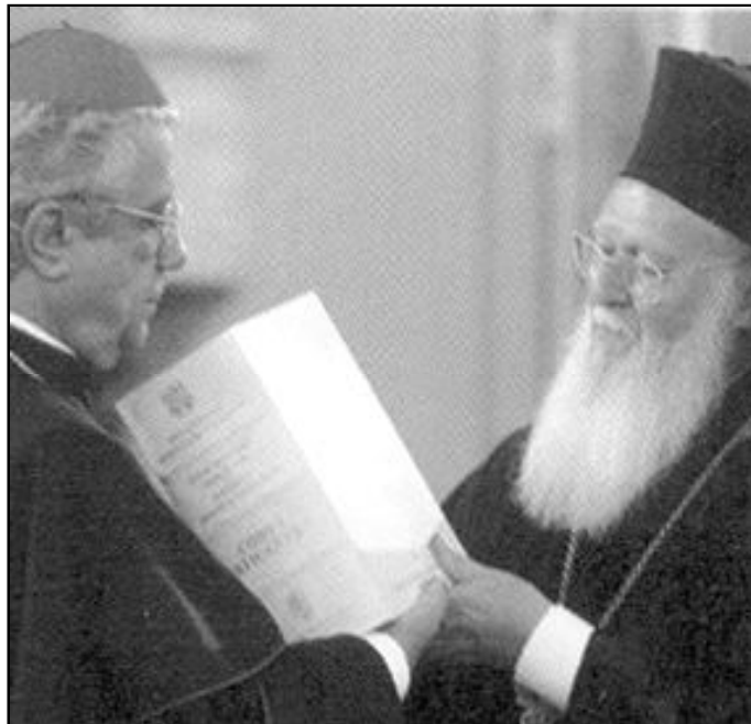
Patriarca ecuménico Bartolomé I (derecha) y el Nuncio de Turquía

Desde otras instancias oficiales también se ha lamentado que no se haya aprobado la petición de reconocimiento jurídico a las Iglesias cristianas presentes en el país: «Esto es un grave defecto en el campo de los derechos humanos, de modo particular por lo que respecta a la libertad religiosa, hay que reco-