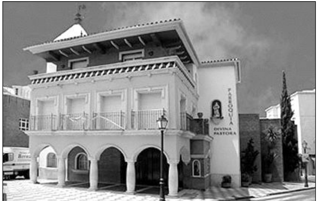
El templo parroquial de la Divina Pastora de Marbella acoge celebraciones de ucranianos ortodoxos

Es el caso, por ejemplo, de la atención que recibe la comunidad de ucranianos ortodoxos residentes en Marbella. Hace cinco años que comenzaron a reunirse en la parroquia de