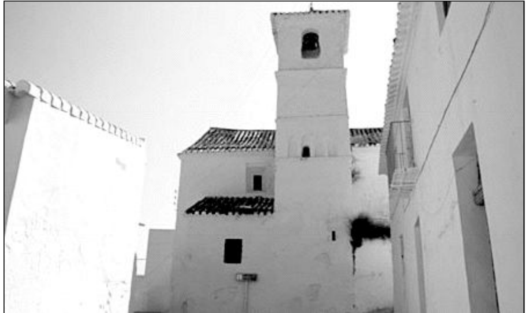
Imagen del templo de la pedanía de Daimalos que aparece en la web www.portalaxarquico.com

Otros valores destacados de la iglesia, también conocida como del Santo Cristo, son su cubierta realizada en madera y la capilla bautismal que se abre en el