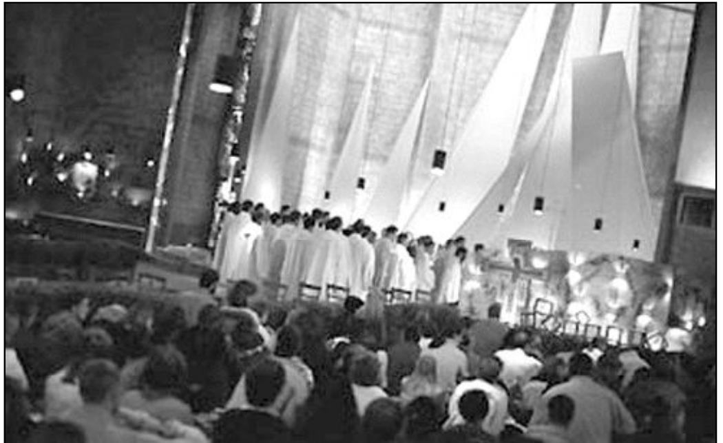
En Taizé oraron por las víctimas del maremoto

Recogido en oración por las víctimas y sus familias, el Papa ha seguido constantemente la evolución de la tragedia, manteniendo contacto con los nuncios apostólicos de las zonas afectadas. El mismo día de la catástrofe, tras rezar el Ángelus junto a miles de peregrinos congregados en la plaza de San Pedro en el Vaticano, Juan Pablo II expresaba su deseo de que «la comunidad internacional se afane para llevar alivio a las poblaciones afectadas», a la vez que aseguraba la oración y «nuestra solidaridad por cuantos sufren». El Santo Padre dispuso el envío de una primera ayuda de su parte a las poblaciones de los países afectados por el terremoto y el maremoto.