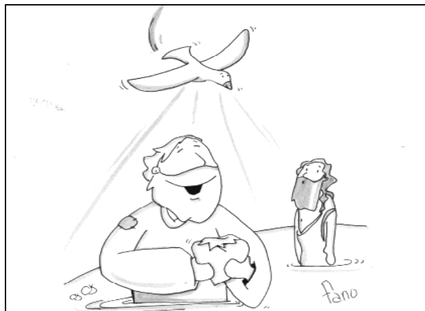
"Es el que ha de bautizar con Espíritu Santo"

todos están llamados a la santidad" (L.G. 39). El "modelo" del camino de santidad es único, es el Señor Jesús. Él es el Maestro, Él es quien nos santifica porque por la acción del Espíritu Santo nos hace "uno en Él". Se define como el Camino, la Verdad y la Vida. He ahí el horizonte amplio y bello que nos ofrece el Señor; la santidad de vida cualquiera sea nuestra situación actual. Es nuestra primera vocación que es primero don y después respuesta. Él, el Señor, nos ha consagrado y llamado a la santidad. ¿Lo agradecemos, interiorizamos el sentido que tiene, hacemos de nuestra vida, como enseña el Concilio, "espléndido testimonio"?