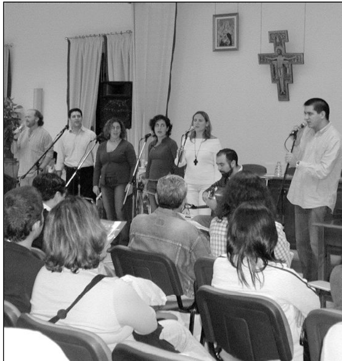
IXCÍ actuó en uno de los encuentros de Pastoral Universitaria

Según nos informa el coordinador de juventud del arciprestazgo de Archidona-Campillos, el domingo 19 de diciembre se celebró en el Instituto de Sierra de Yeguas el encuentro arciprestal de los jóvenes. Un grupo de unos noventa jóvenes compartieron el día bajo el lema "¿Navidad?". Se presentó la forma de vivir las fechas navideñas de nuestro mundo, manipulado por el consumo y los falsos buenos deseos, y se presentó otra forma de vivir la Navidad, más coherente con el estilo de vida de Jesucristo. Se compartió la Eucristía, una dinámica de grupo y la comida, y por