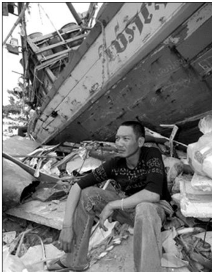
Un pescador observa atónito los efectos del tsunami

El domingo 26 de diciembre, mientras iba a la playa de Phuket, bajó para coger el autobús en el lugar de la parada habitual. Pero esta vez se fue más