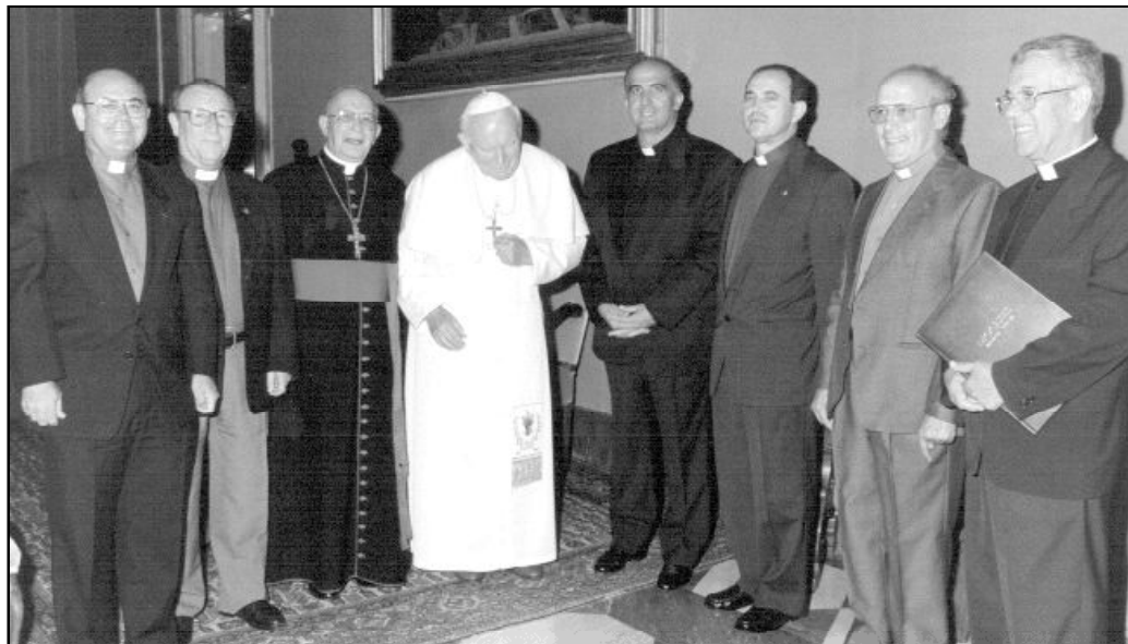
Curia diocesana en la última visita “ad limina”

El informe preparado este año por cada uno de los responsables de las distintas delegaciones diocesanas y revisado, primero por el