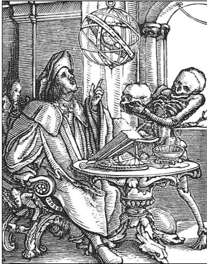
Un grabado antiguo que representa la figura del astrólogo

Un astrólogo había predicho en 2003 que el presidente