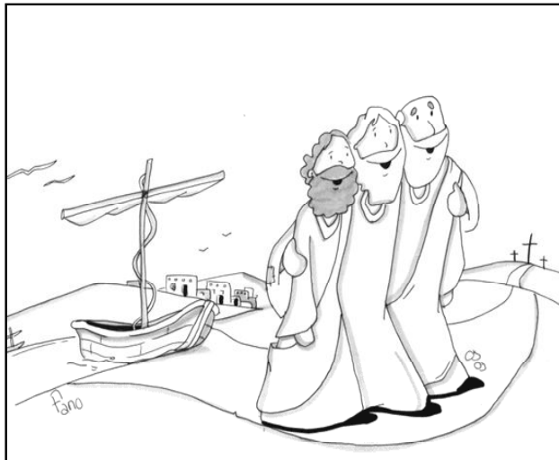
"Venid y seguidme"

tramos ejemplos en el Evangelio de este Domingo. Simón, Andrés, Santiago y Juan. Ser discípulos supone haber conocido y amado, por lo menos inicialmente, a Jesús. De alguna manera se sienten seducidos por Aquél que les ha llamado por su nombre. A la curiosidad sucede la fuerte atracción. Se encuentran con Él, conocen cómo vive y le siguen... Pero tiene un precio: deben dejar "la barca y a su padre". Son ejemplo de conversión. Un rato antes no le conocían, ahora le conocen e, inicialmente, están dispuestos a seguirle.