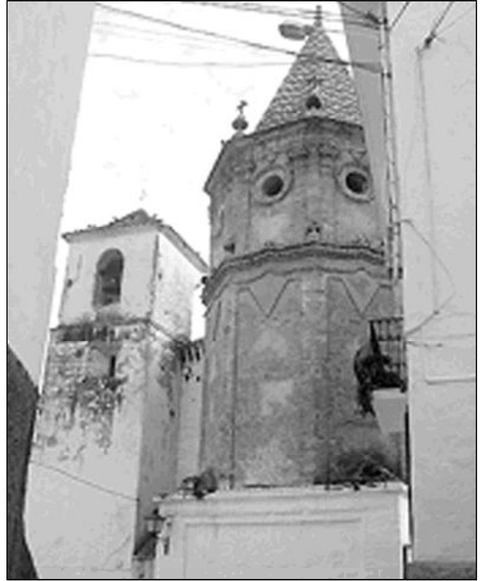
Vista de la parroquia de El Borge

La festividad del patrón de El Borge, San Gabriel, que la Iglesia festeja el 24 de marzo, se celebra con una Eucaristía y procesión tras la que comienzan las fiestas del pueblo. Ese día, repican de forma especial las campanas de la iglesia.