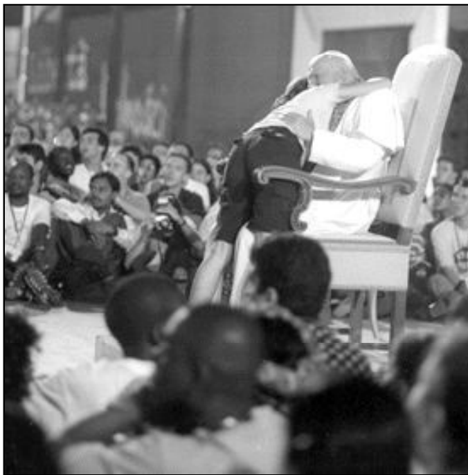
La Jornadas Mundiales de la Juventud serán del 18 al 21 de agosto de este año

Juan Pablo II tiene previsto participar en las Jornadas Mundiales de la Juventud visitando Colonia del 18 al 21 de agosto, según infor-