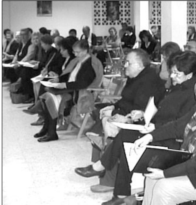
Participantes en unas jornadas diocesanas de Liturgia

En esta carta, el Santo Padre considera "una importante gracia del vigésimo séptimo año de ministerio petrino que estoy a punto de iniciar, el poder invitar ahora a toda la Iglesia a contemplar, alabar y adorar de manera especial este inefable Sacramento. Que el Año de la Eucaristía sea para todos una