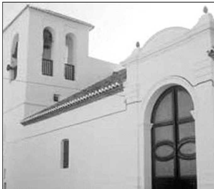
Fachada de la parroquia de El Burgo