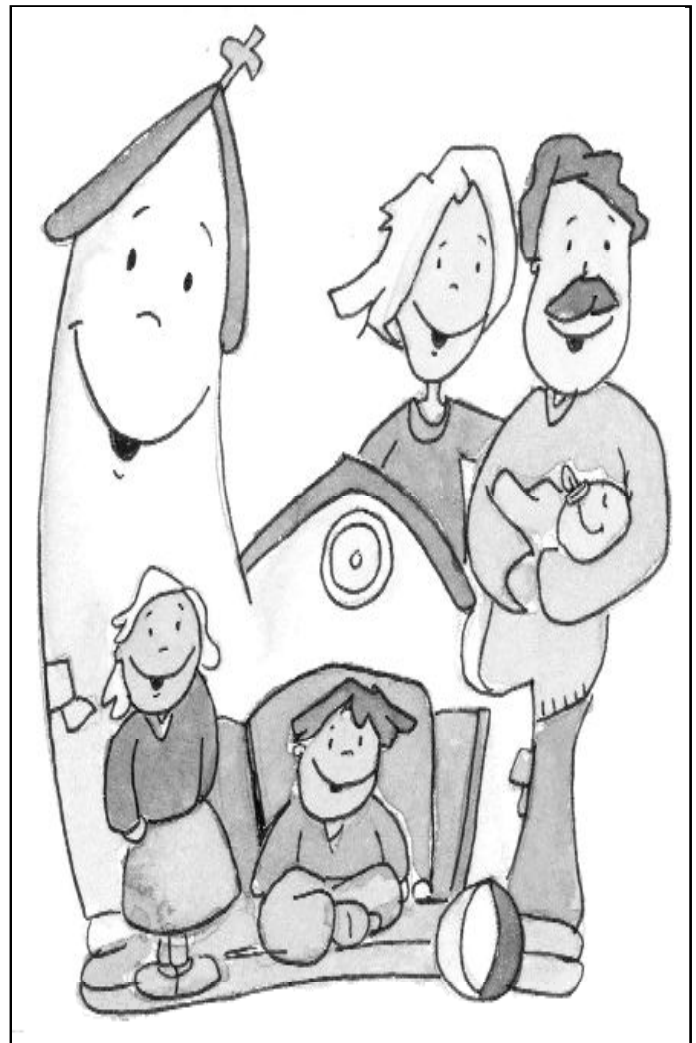
Ilustración de Pachi sobre la familia cristiana