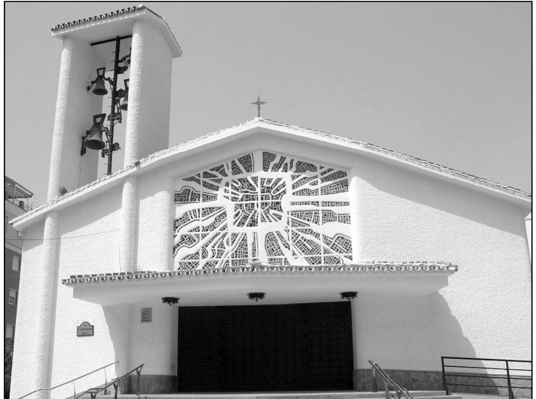
Fachada de la parroquia de San Andrés, en Torre del Mar

Pero el arciprestazgo no es sólo Torre del Mar, sino un conjunto de parroquias diseminadas. Varias de ellas organizan el cursillo en el lugar. Tal es el caso de Algarrobo, Sayalonga, Almayate, Benajáraf, Chilches, Benamocarra,