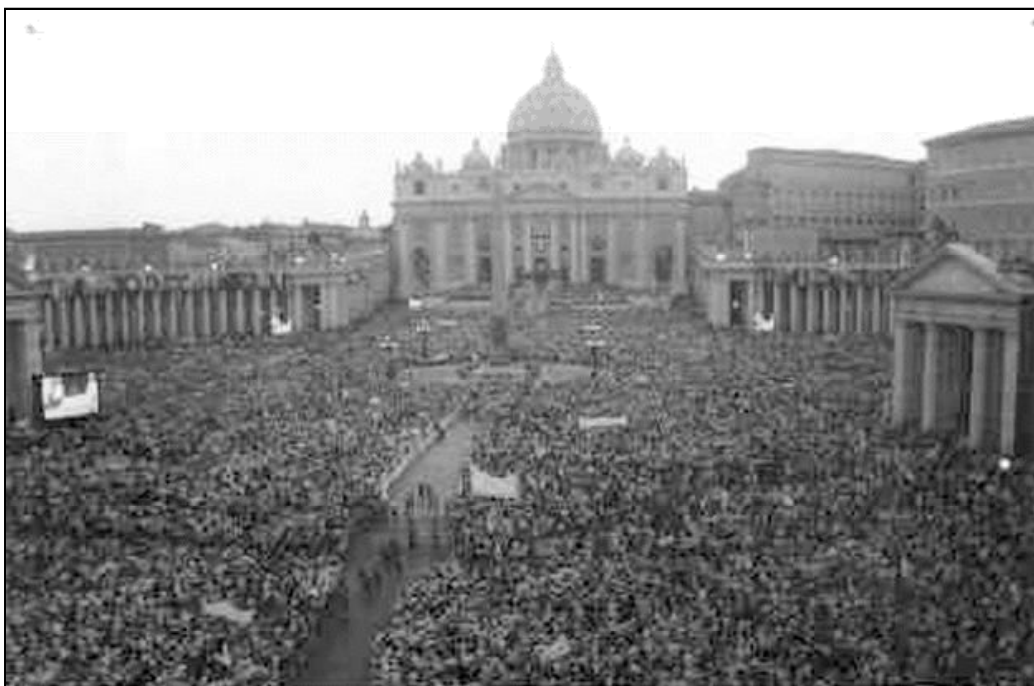
La Jomadas Mundiales de la Juventud serán del 18 al 21 de agosto de este año

La agenda del encuentro prevé el análisis de la situación ecuménica en Europa hoy, y trabajará para preparar la III Asamblea Ecuménica Europea prevista para 2007. La cita será ocasión también de revisar el trabajo de los citados organismos, del comité común para las relaciones con los musulmanes en Europa y de la relación entre Iglesias y Unión Europea. Los matrimonios mixtos serán, además, objeto de debate. En el marco de esta reunión tendrá lugar una celebración ecuménica en la catedral de Chartres y un encuentro con la Federación