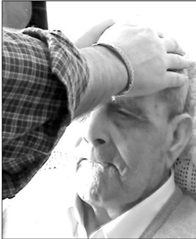
Un hombre enfermo recibe la unión de manos del sacerdote

En nuestros días, las comunidades parroquiales están profundizando en el papel que los enfermos desempeñan en la comunidad parroquial, con su oración y la ofrenda de sus limitaciones, y en la manera de mantenerlos integrados en la vida de la parroquia y facilitar su vida de fe. Los equipos de Pastoral de la Salud, que están surgiendo con fuerza