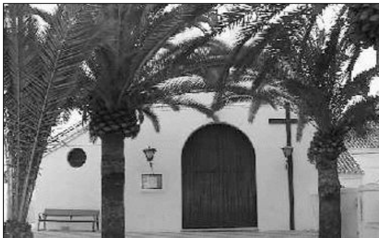
Fachada del templo de El Morche

El nuevo templo, con una capacidad mucho mayor que el ante-