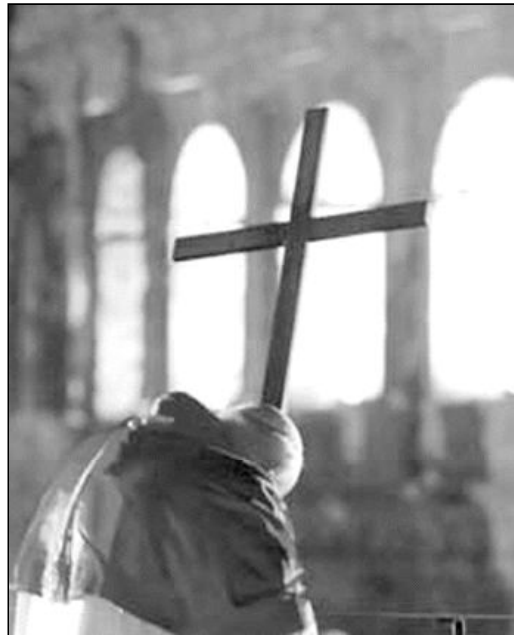
Juan Pablo II nunca ha faltado a la celebración del Vía Crucis en el Coliseo de Roma