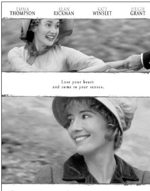
La película "Sentido y Sensibilidad" aborda la diferencia entre corazón y razón

Que la inteligencia esclarece el amor, le ayuda en velo diáfano, disipa los fantasmas..., es una verdad de experiencia que sólo niegan algunos románticos falsos que piensan que la sinceridad y la espontaneidad excluyen toda lucidez.