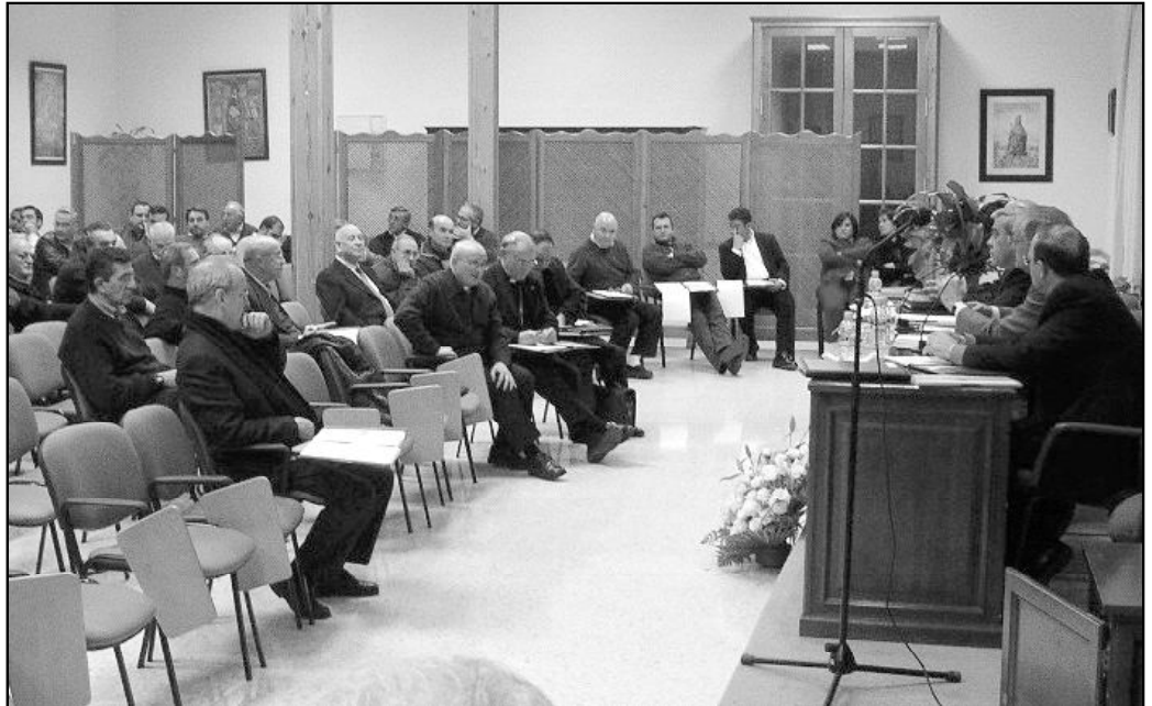
Último encuentro de Obispos, Vicarios y Arciprestes de la Provincia Eclesiástica de Granada

Los formadores de los Seminarios de Andalucía se reú-