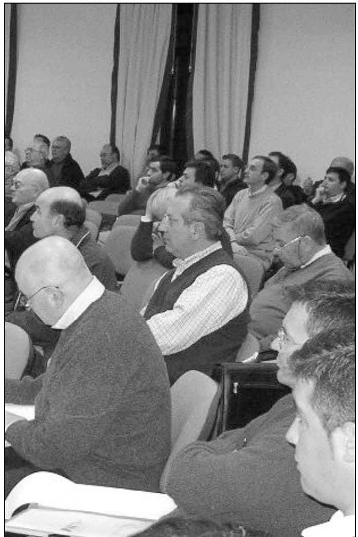
Vicarios y Arcepresbiteros de las diócesis andaluzas