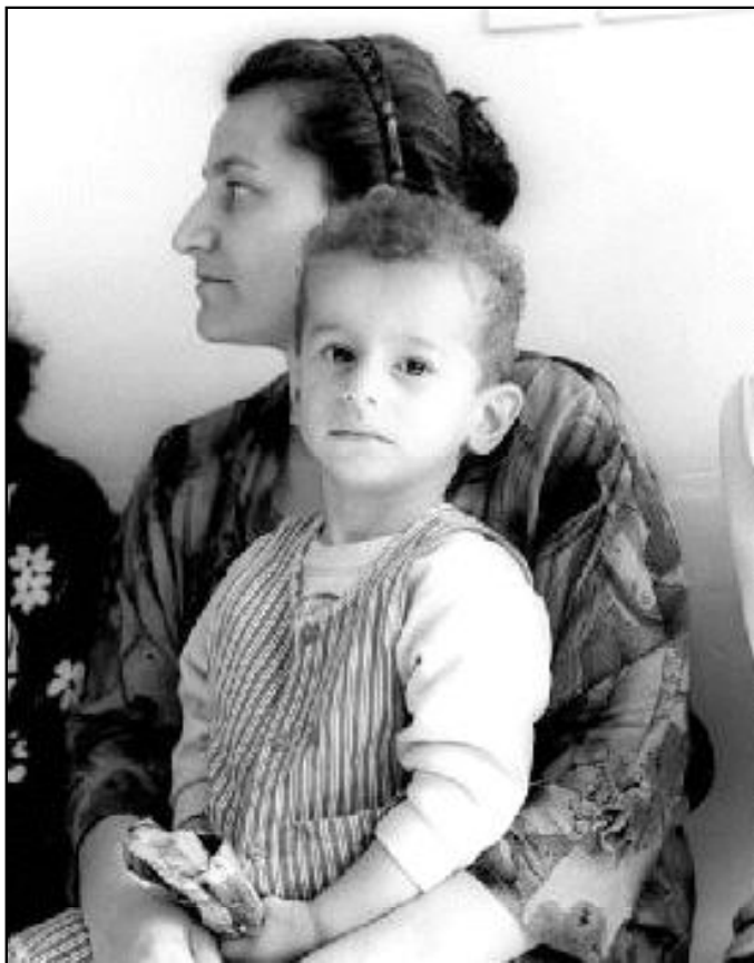
Cáritas ha atendido a un millón de personas en Irak desde que terminó la guerra

Según se señala en el plan analizado en la reunión de Roma, Cáritas Irak, en estrecha cooperación con la autoridades sanitarias del país y las agencias de Naciones Unidas, «puede desempeñar un importante papel en la