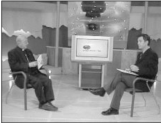
Los cristianos debemos evangelizar por todos los medios a nuestro alcance

Se acaba de hacer pública una carta apostólica dirigida a los responsables de las comunicaciones sociales con el título «El rápido