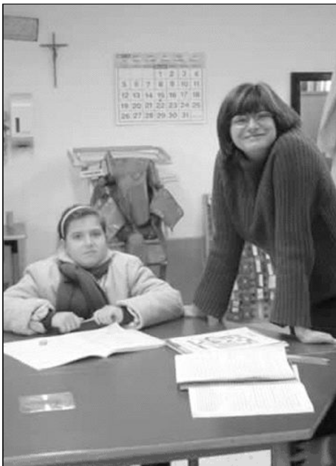
La Constitución ordena a los poderes públicos garantizar los derechos de los padres

Desde la Junta de Andalucía, se ha prometido que, para este curso próximo, ningún alumno de tres años tendrá que pagar para escolarizarse. Esta noticia ha animado a muchos centros privados a solicitar más conciertos, para poder así ofertar más plazas para aquellos alumnos