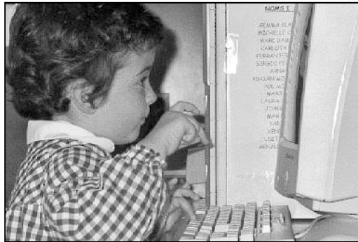
Internet es una valiosa herramienta de enriquecimiento cultural