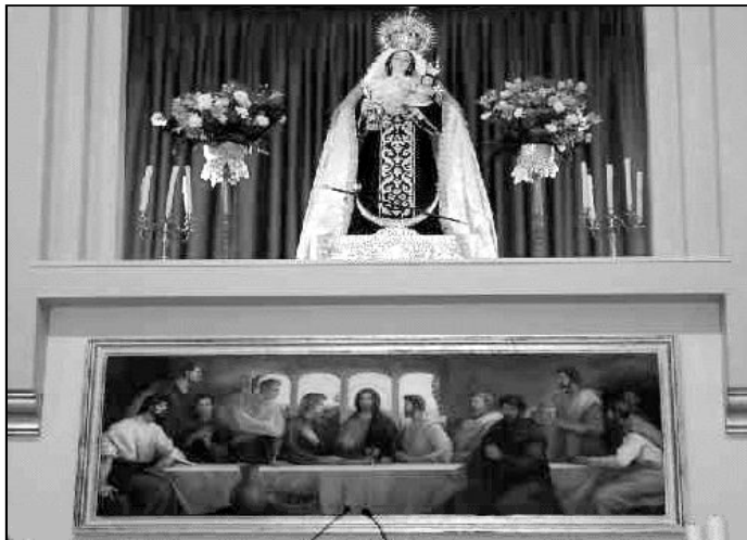
Capilla de la Virgen del Carmen

La imagen de la Virgen, realizada en 1.964, es una talla de vestir del imaginero sevillano Antonio Esteban Rubio. Todo el pueblo venera a la que es su patrona desde 1.990 y el día de su onomástica, a las 10 de la mañana celebran una Eucaristía en su honor. A la tarde, engalanados los barcos