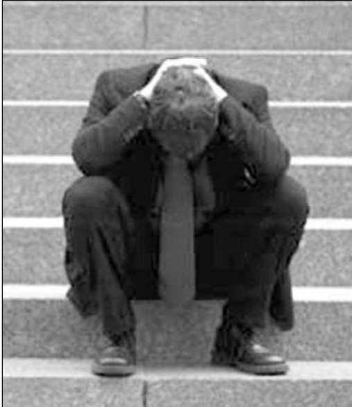
Hoy en día nos llevamos fácilmente por la actividad

Cada uno debe partir de su estado y ver si necesita un cuidado especial, un reposo, un descanso, una visita médica. No se puede estar si el cuerpo no funciona como debe. Y si no se fun-