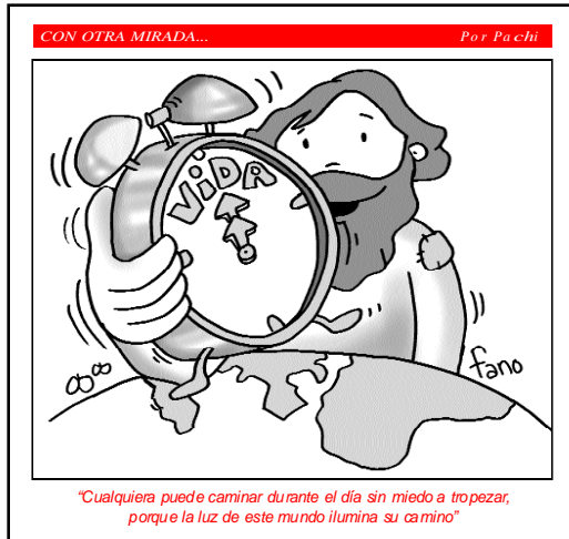
"Cualquiera puede caminar durante el día sin miedo a tropezar, porque la luz de este mundo ilumina su camino"

zamos en la edad, se nos hace más cercana. El anuncio de la muerte de familiares y amigos hace frecuente el encuentro en los cementerios. Es un dato sociológico, todos coincidimos que ese hecho es punto de convergencia de las personas de cualquier generación, de cualquier época, de todas las ideologías, de toda edad. ¿Dónde está la diferencia? En la certeza, con el solo apoyo de la palabra del Señor, de que quien cree en Él vivirá para siempre. Es la promesa que nos ha hecho quien resucitó como primicia de la resurrección de todos.