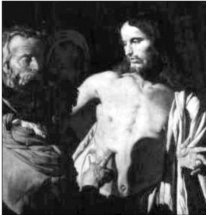
"Si no meto mis dedos en sus llagas..."

Con estas claves puedes hoy proclamar que no crees en un muerto muy importante por lo que hizo en su vida, sino porque ha vencido a la misma muerte como signo y símbolo de lo que le ocurri-