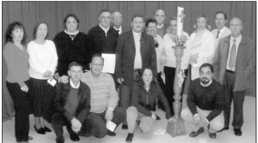
Último programa de "Mañana es...", que acerca las claves de la Pascua a través de la televisión de Mijas

vivo, podemos poner en circulación esos valores que hacen atractivas a nuestras comunidades. Empezando por la paz del corazón. En una situación histórica que está marcada por la violencia, la prisa y estrés, el seguidor de Jesús de Nazaret debe transmitir esa paz que no se deja impresionar por la superficie de las cosas y sabe buscar en las aguas profundas.