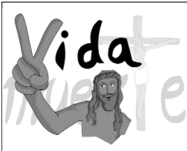
"Ha resucitado, como había dicho"

visto y hemos creído" y esto se manifiesta en nuestra vida.