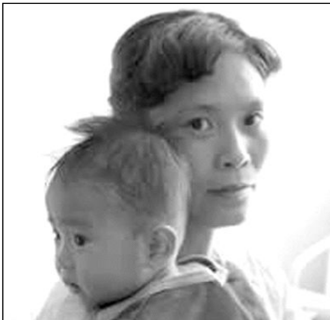
Corea, uno de los países necesitados de nuestro mundo

«Sin embargo, existen también crecientes diferencias en la población, entre «los que tienen» y «los