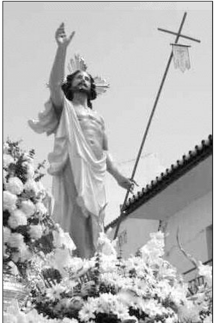
Imagen de Cristo Resucitado de Alhaurín de la Torre