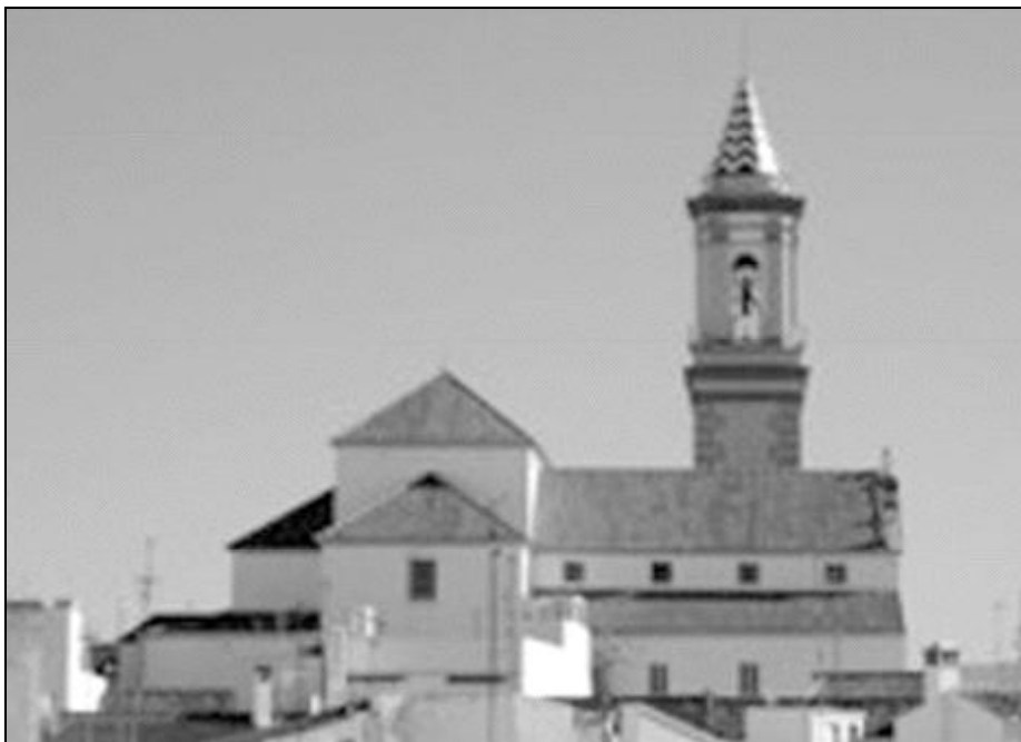
La torre de la iglesia de Santa María de los Remedios, se divisa desde cualquier punto de Estepona

En el Consejo Parroquial hay una gran diversidad de grupos, y entre ellos existen muchas personas implicadas y preocupadas