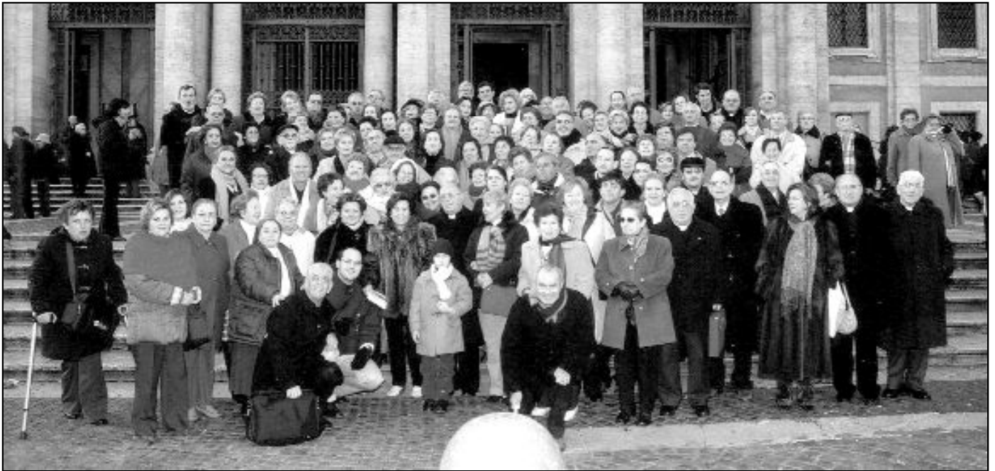
Los peregrinos malagueños que viajaron a Roma a primeros de marzo ya no pudieron ver a Juan Pablo II, pero rezaron para que Dios lo ayudara en su enfermedad