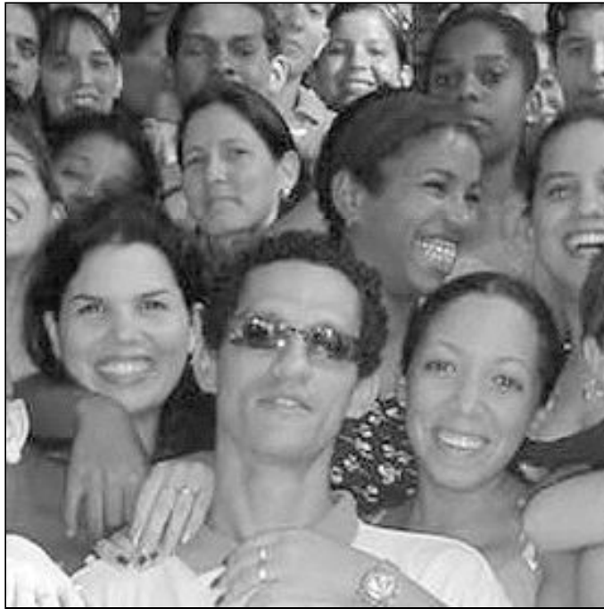
“¿Cuándo posee un joven el don del humor?”

Cuando un joven vive anclado en el humor sano, no pasa de nada ni de nadie, pero tiene algo de especial: no le da vueltas al coco ante lo que dicen los medios de comunicación sociales o el grupo de amigos. Sabe relativizarlo todo. Se queda con la parte bella, humorística y