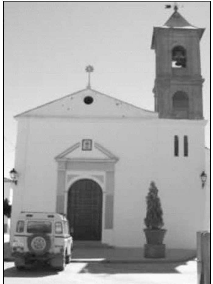
Fachada de la parroquia Ntra. Sra. del Rosario