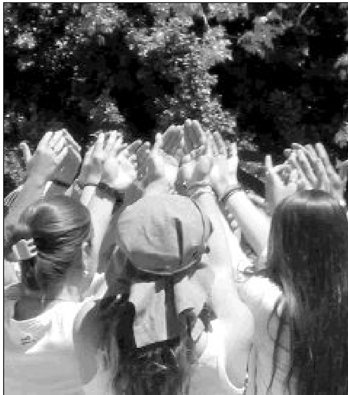
Uno de los momentos del Encuentro Diocesano de la Juventud del año pasado

Y está previsto que, unos días antes, el domingo 10 de abril, se celebre también en el Seminario el XVIII Encuentro Diocesano de la Juventud. Pretende ser un