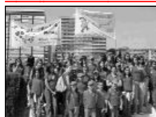
Niños de los colegios Ntra. Sra. de

la Victoria de Málaga y María Inmaculada de Antequera han participado recientemente en el Festival de la Canción Misionera celebrado en Valencia, representando a la diócesis de Málaga. Este coro interpretó una canción misionera compuesta por una Hermana Franciscana sobre el relato de los discípulos de Emaús. En la foto, junto a las pancartas que lucieron por las calles de Valencia.