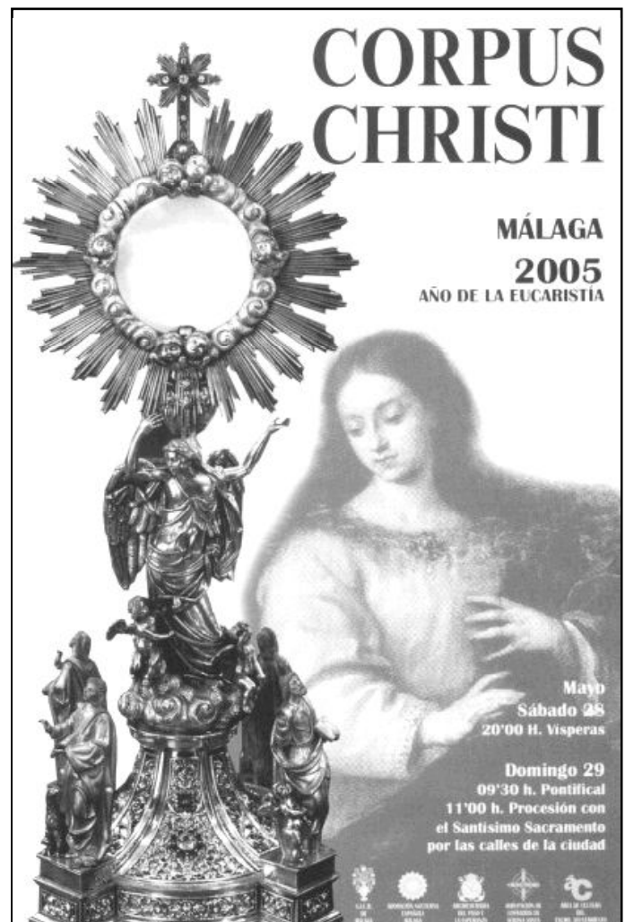
Cartel del Corpus Christi para este año 2005