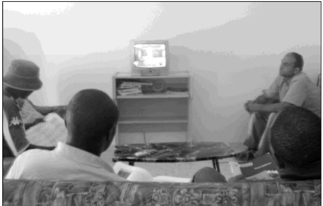
Un grupo de acogidos en el piso de Caritas viendo la televisión

El piso, que estaba totalmente amueblado, ha sido contratado en régimen de alquiler, y cuenta con cuatro dormitorios, baño y aseo, salón comedor, cocina, lavadero y patio. Está situado en el Arciprestazgo de Cristo Rey, cuyas Caritas parroquiales colaboran activamente en la Comisión que se ha constituido para la admisión, elaboración de las normas y seguimiento periódico (reunión cada 15 días) del buen funcionamiento del mismo. También están representados en dicha Comisión el Secretariado Diocesano de Pastoral de Migraciones y la propia Caritas Diocesana a través de la responsable del Área de Acción Social, una