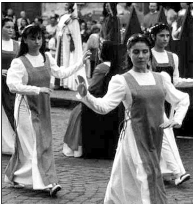
Celebración del Corpus de Orbiob

El Papa recuerda que este Congreso Eucarístico «se celebra en el contexto del Año especial de la Eucaristía, durante el que los católicos del mundo son