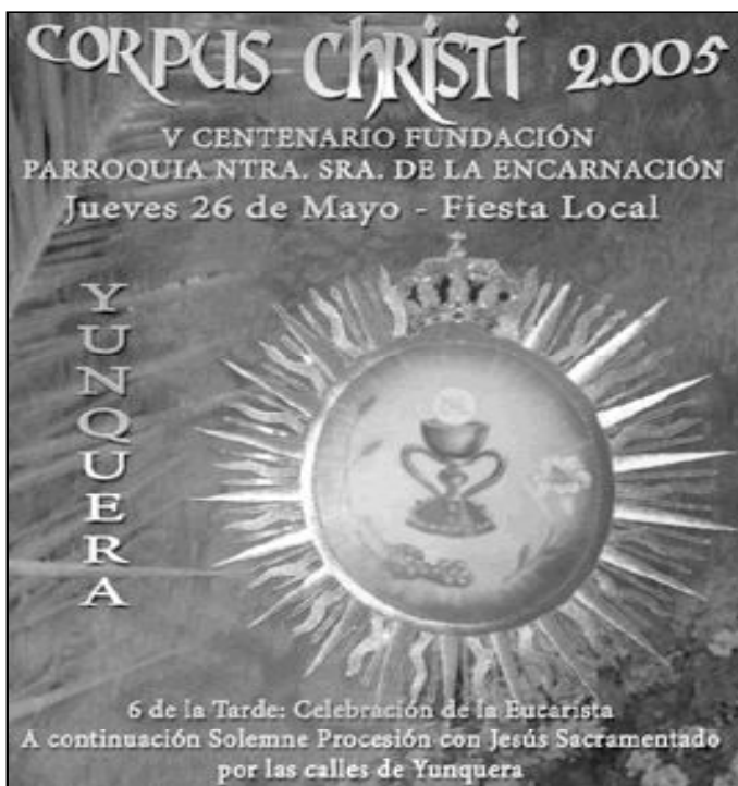
Detalle del cartel del Corpus de Yunqueira

1 Para nuestra Congregación, la Eucaristía está en la esencia misma del carisma y no podemos limitarlo a unos cultos determina-