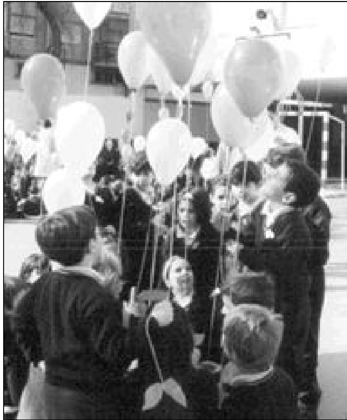
Los chicos celebran el final de curso

Así de directos se muestran ante este proyecto de ley y se suman a la preocupación de los profesores de filosofía, ética y humanidades por la reducción y eliminación progresiva que el Ministerio plantea de sus áreas de conocimiento; a la vez que denuncian "el previsible deterioro de la educación en