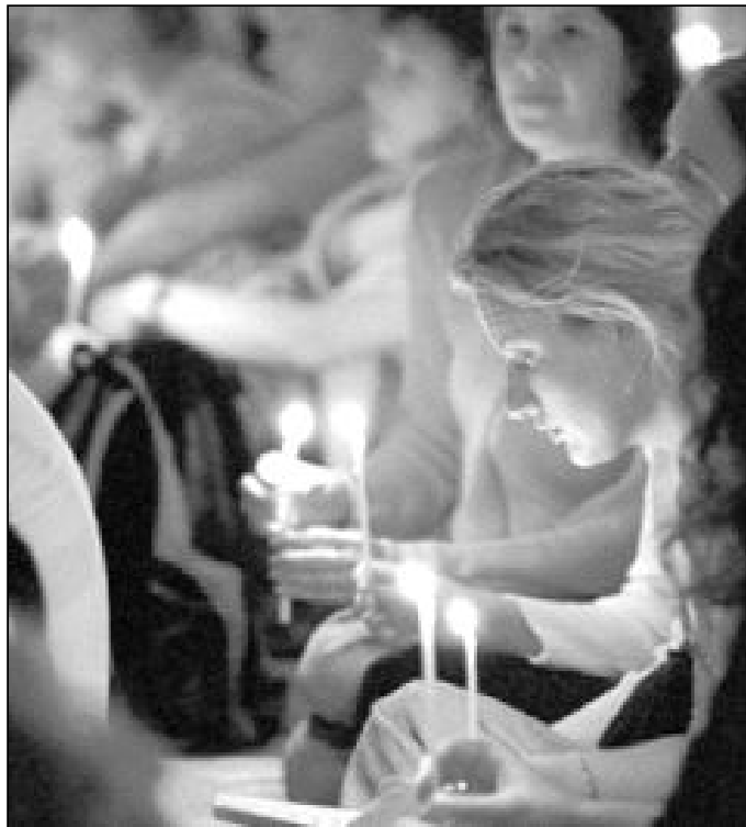
Jóvenes en un encuentro de Taizé

El modo de vivir su fe los musulmanes, judíos y budistas me alegra y decepciona. Puede que ellos reaccionen como nosotros cuando nos ven vivir. Admiro al judío, al musulmán y al budista que tienen sentido espiritual. Admiro al musulmán cuando veo que es una persona de oración. En el budismo se busca el silencio como un vacío interior. Para los cristianos, la fe nos pide un silencio interior habitado. Limpio los obstáculos para que la presencia de Cristo me clarifique plenamente. En el Islam, la práctica de las oraciones es importante. Cuando Jesús invita al ayuno, oración y limosna pide que las vivamos en secreto. Las prácticas en el Cristianismo están en segundo lugar. Nuestro único "fundamento" es Cristo. Y esto entraña una dificultad: hay una llamada a