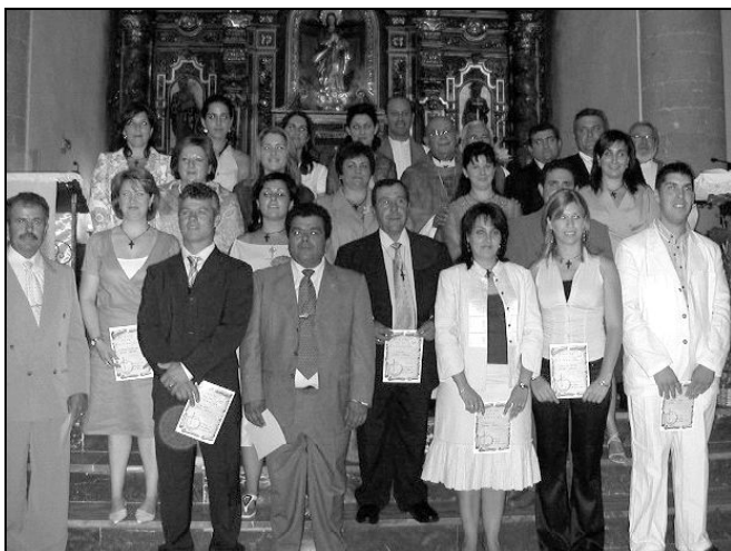
CONFIRMACIONES EN SAN JUAN DE COÍN.

El pasado domingo 19 de junio, en la parroquia de San Juan de Coín, el Sr. Obispo administró el sacramento de la confirmación a un grupo de 21 adultos que pertenecen a los distintos grupos de la parroquia. Se trata de un conjunto de matrimonios y parejas de novios que se han preparado para este momento. Uno de sus compromisos de confirmación, además de seguir en sus grupos de referencia, es la formación de un equipo de pastoral familiar, compuesto por matrimonios, por lo que desde la parroquia agradecen a Dios el don de su Espíritu para bien de su Iglesia.