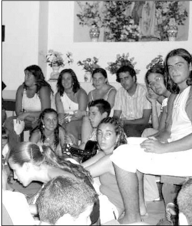
Participantes en el campamento de chavales del arciprestazgo de Coín el año pasado

Es curioso pero, uno de los avisos que se da a los niños en el folleto de inscripción es que “no pueden llevar teléfono móvil ni juegos electrónicos. El responsable o catequista de cada parroquia es el único que puede llevar móvil y será el que se ponga en contacto con los padres, si fuese necesario u oportuno”. No podemos olvidar que vivimos en el siglo en que vivimos, y en un país en que las nuevas tecnologías están al alcance de la mayoría de los ciudadanos. Pero también es importante enseñar a los niños a disfrutar de la Creación y a encontrar en ella tiempo y espacio para orar a Dios y descubrir los valores de los demás. Los chicos vivirán una experiencia inolvidable de gratuidad, generosidad, caridad, entrega y alegría, porque no está reñido, ni mucho menos, el tomar el sol, darse un buen baño, descansar unos días, y pasar ratos con el Señor y con los demás.