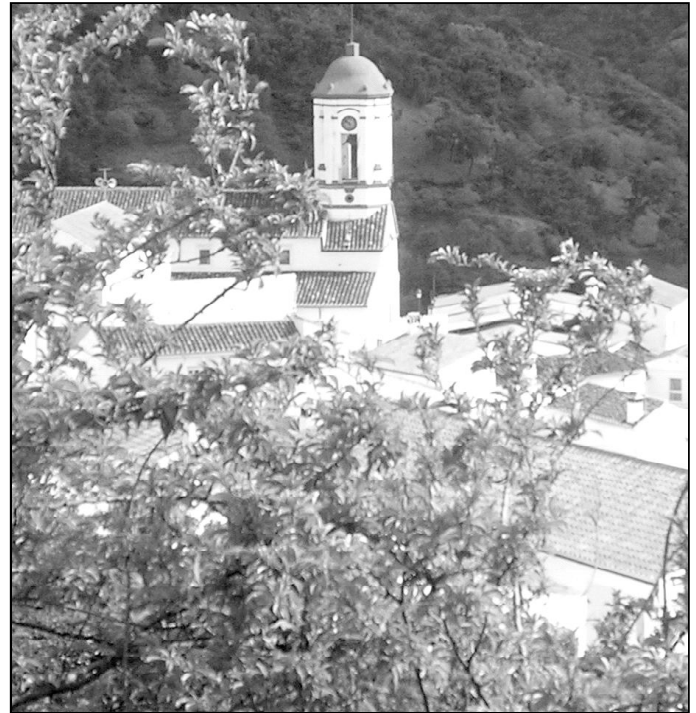
Vista de la parroquia de Genalguacil desde los alrededores del pueblo

Del buen funcionamiento de las catequesis se encarga su párroco, D. Rafael Rodríguez, y