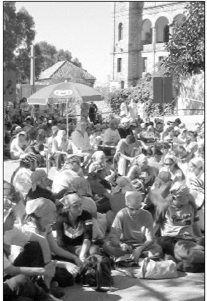
Jóvenes de la Diócesis en un encuentro de verano