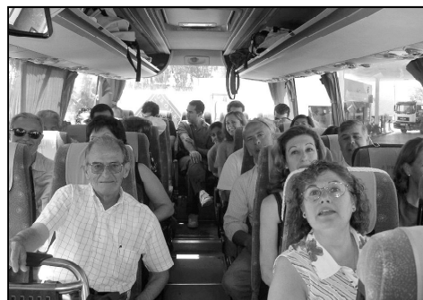
LA FAMILIA, SÍ IMPORTA

El pasado domingo 19 de junio, en la parroquia de San Juan de Coín, el Sr. Obispo administró el sacramento de la confirmación a un grupo de 21 adultos que pertenecen a los distintos grupos de la parroquia. Se trata de un conjunto de matrimonios y parejas de novios que se han preparado para este momento. Uno de sus compromisos de confirmación, además de seguir en sus grupos de referencia, es la formación de un equipo de pastoral familiar, compuesto por matrimonios, por lo que desde la parroquia agradecen a Dios el don de su Espíritu para bien de su Iglesia.