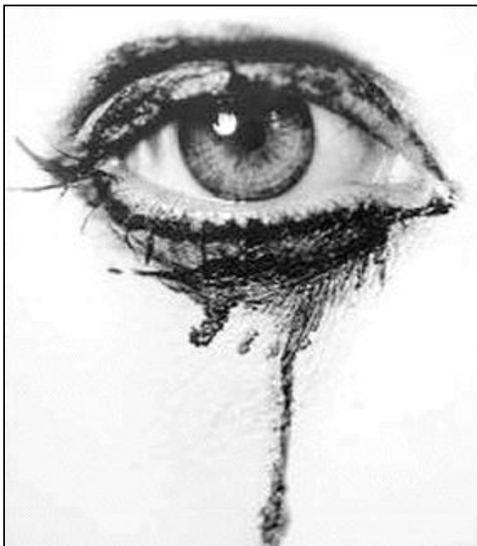
«La dignidad de la persona no puede pagarse», Bonetti

Es necesario «denunciar las injusticias y la violencia perpetradas contra las mujeres, en cualquier parte que tengan lugar», dijo el cardenal Hamao, quien alentó a los que trabajan