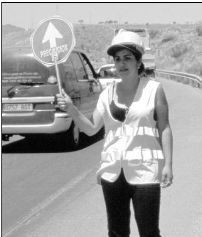
Trabajadora de tráfico en una carretera de la provincia

– En los meses de julio y agosto se detecta la mayor intensidad media diaria de vehículos en la provincia, pero es en los desplazamientos cortos donde se dan el mayor número de siniestros. Hace unos días se dio a conocer un estudio donde se reflejaba que el número de vehículos por persona en Málaga, superaba a Sevilla, Londres o París. Esto nos muestra la dependencia que tenemos de los vehículos, como también la escasa alternativa de utilizar otro medio de transporte en nuestra provincia, que no sea nuestro propio vehículo. Ecológicamente nos debe preocupar esta situación. La DGT pone en marcha las opera-