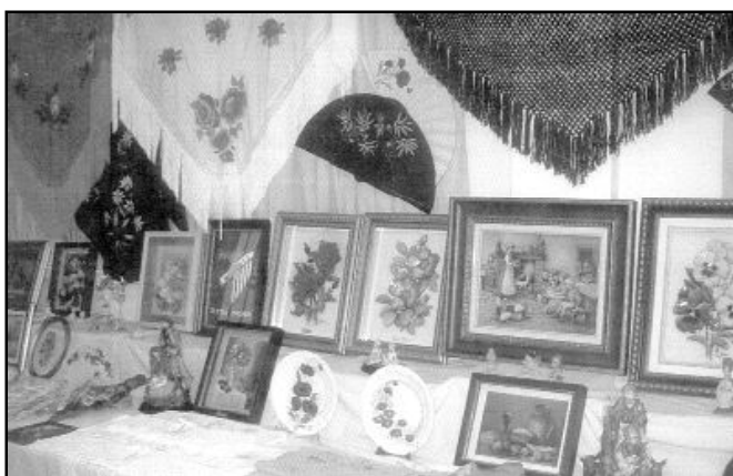
PARROQUIA NUESTRA SEÑORA DE FLORES

La parroquia de Nuestra Señora de Flores, en Málaga capital, ha organizado, en uno de sus salones, una exposición de todos los trabajos que han hecho las señoras que participan en un taller parroquial de manualidades. En la foto que acompaña a estas líneas pueden ver algunas de las obras realizadas. Varias alumnas afirman que lo mejor de este taller es la convivencia y amistad que se genera entre ellas, a la vez que aprenden tareas que nunca pudieron realizar. En diversas ocasiones han organizado también algún rastrillo para beneficio de la parroquia.