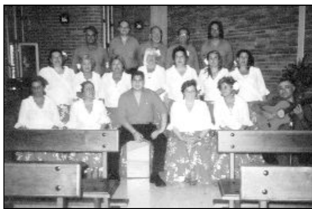
FIESTA DE LA PARROQUIA DE SAN ANTONIO DE PADUA

La parroquia de Nuestra Señora de Flores, en Málaga capital, ha organizado, en uno de sus salones, una exposición de todos los trabajos que han hecho las señoras que participan en un taller parroquial de manualidades. En la foto que acompaña a estas líneas pueden ver algunas de las obras realizadas. Varias alumnas afirman que lo mejor de este taller es la convivencia y amistad que se genera entre ellas, a la vez que aprenden tareas que nunca pudieron realizar. En diversas ocasiones han organizado también algún rastrillo para beneficio de la parroquia.