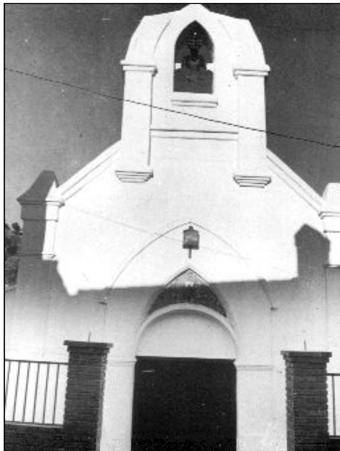
Fachada de la parroquia de Gibralgalia