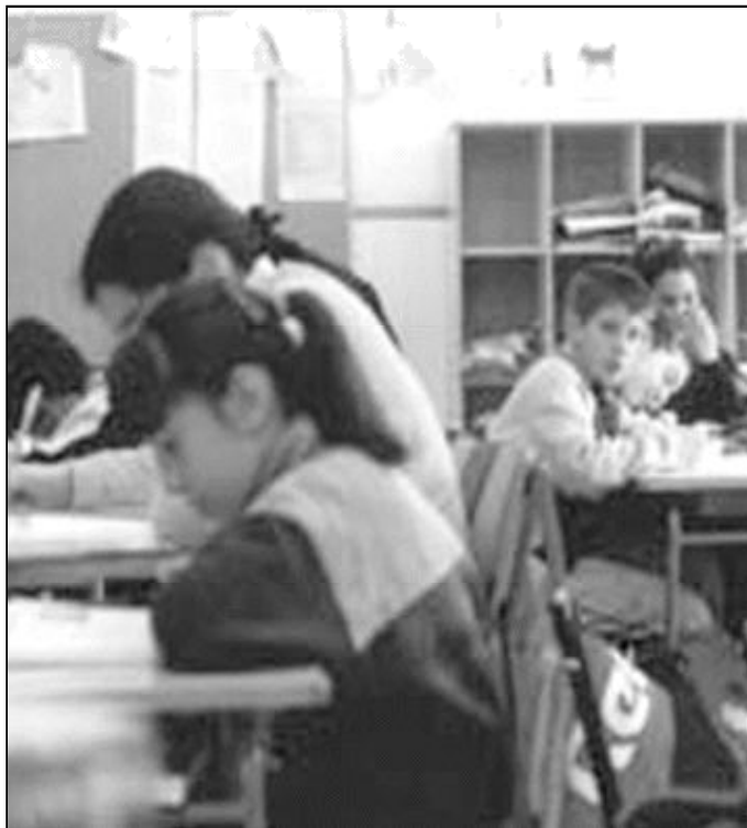
La enseñanza mixta de niños y niñas exige capacidad de adaptación en el maestro

En el campo de la escuela, dado que la mayoría de los enseñantes son mujeres, ¿no se corre el riesgo de no saber comprender y abordar a los chicos? Estos sienten necesidad de afrontar el problema para construirse; una mujer tiene difi-