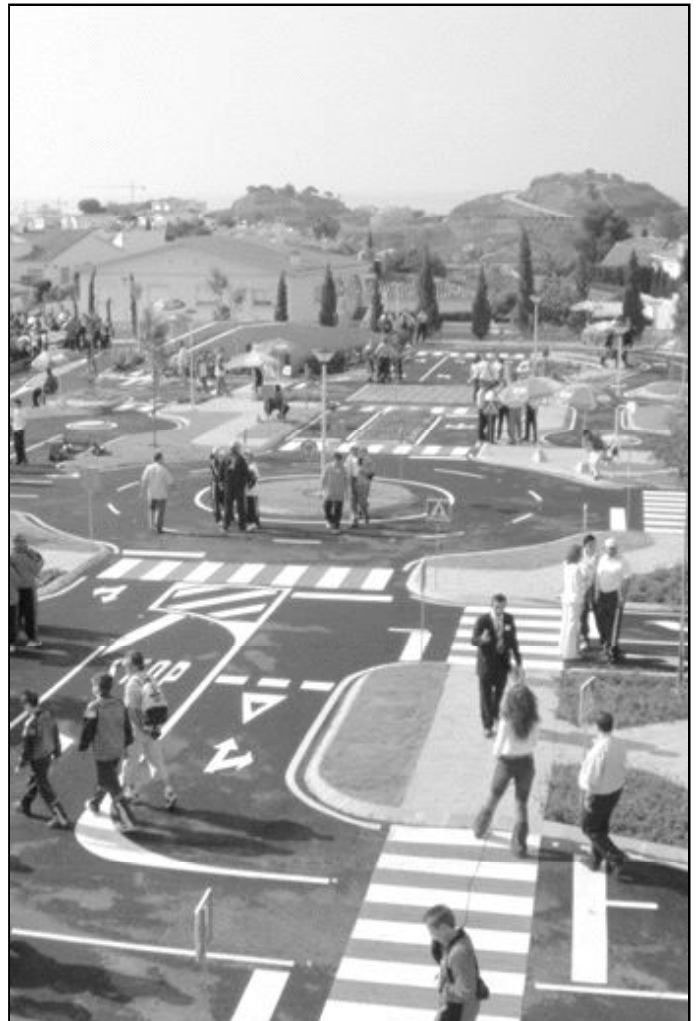
En el asfalto pasamos gran parte de nuestra jornada