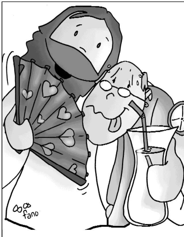
"Venid a mí todos los que estáis fatigados y agobiados, que yo os aliviaré"

También hoy el Evangelio resulta difícil y duro en muchas ocasiones. Pero el Señor encarna la dulzura y la humildad. Y su mensaje salvador y liberador no puede carecer de la misma dulzura y sencillez que resplandecía en Jesús.