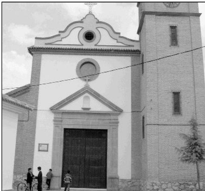
Fachada de la parroquia Santísimo Cristo de la Misericordia

Aunque no es una comunidad muy numerosa, la vida parroquial es muy activa en todos los ámbitos. Cáritas realiza una gran labor