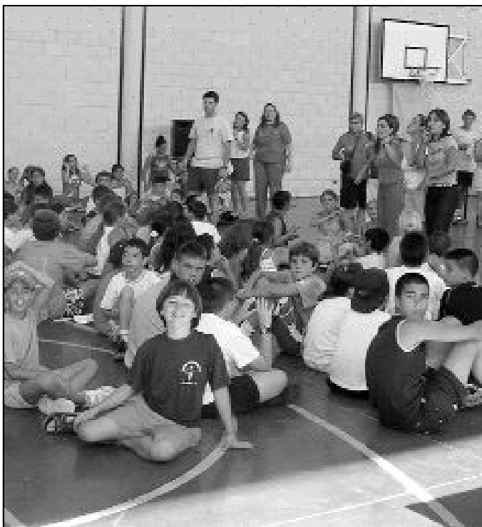
Participantes en el campamento de verano de la Fundación Diocesana de Enseñanza

enseñado a buscar y coleccionar fósiles, a familiarizarse con la vida y las costumbres de los animales, a conocer y diferenciar la flora del entorno y a caminar por el campo.