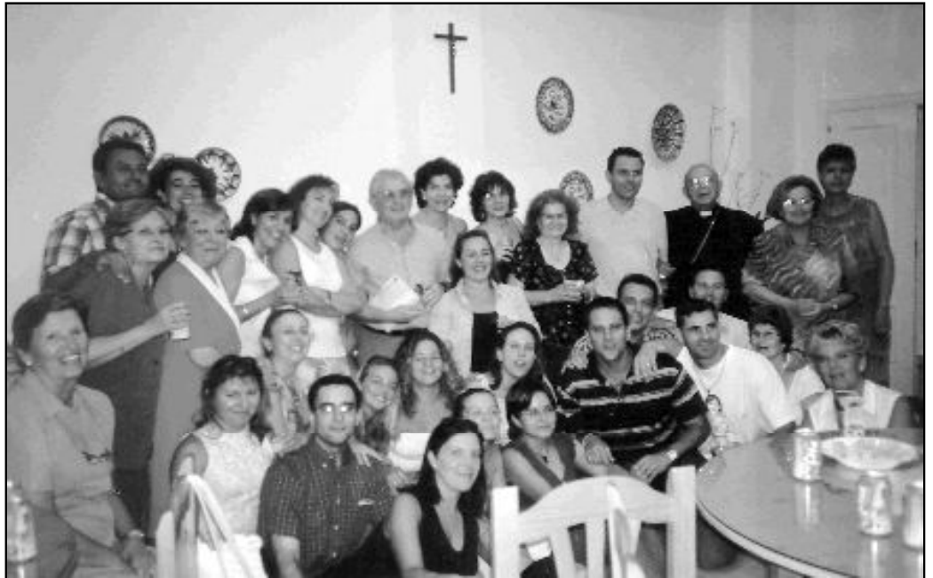
Cursillo 530, celebrado en Antequera y clausurado por el Sr. Obispo

Los Cursillos de Cristiandad se basan en los tres pilares de la propia Iglesia: oración, formación y acción; y están dirigidos “tanto a personas alejadas de la Iglesia, en búsqueda; como a los tibios que permanecen en ella, un tanto acomodados”, afirman los responsables. Las personas que llegan a los Cursillos conocen su existencia a través de la página web de la dió-