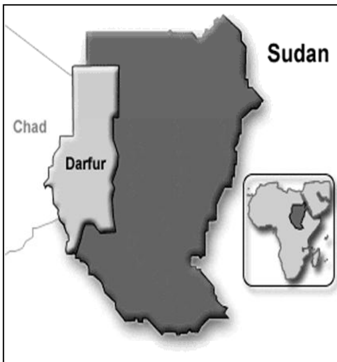
Mapa de la región sudanesa de Darfur

vias, todavía no hemos conseguido reponer nuestras reservas de comida, mientras que el número de personas que necesitarán alimento no ha dejado de aumentar.