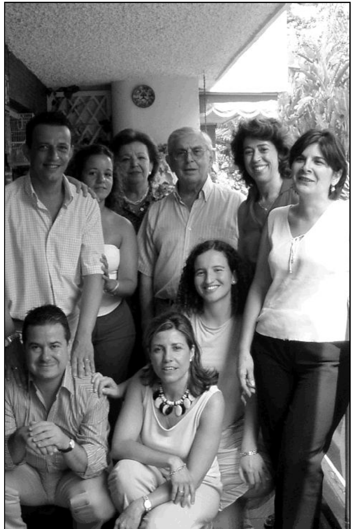
Actual Secretariado de Cursillos de Cristiandad