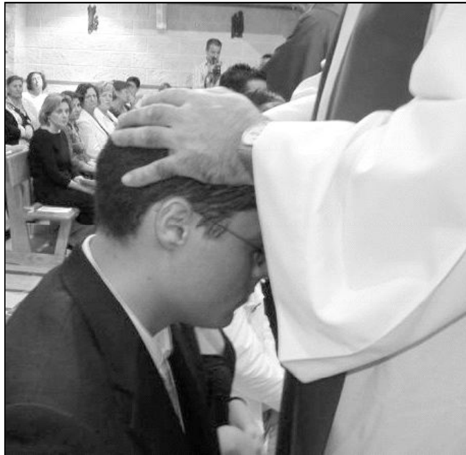
Un joven recibe el sacramento de la confirmación de manos del Sr. Obispo

1. La cuestión realmente radical: vivir de cara a Dios. Nada puede darse por supuesto. Las circunstancias de la vida hacen hoy más necesario el cuidado y el cultivo del don recibido. Nadie garantiza que podamos conservar siempre lo que hemos tenido el gozo de disfrutar. Menos, en tiempos en los que el ambiente más extendido es la increencia e invitación al cultivo del bien-estar. Buscar a Dios, y compartir esa búsqueda y sus descubrimientos con los demás: ése es el objeto (si es que esta palabra puede darse) de la vida cristiana. Todo lo demás es secundario o accidental. No sobra ni un solo esfuerzo para hacer de los cristianos/as mejores profesionales, pero siempre será mucho más importante habilitar a los cristianos/as para que busquen más intensamente a Dios. Contraponer ambos esfuerzos es desquiciar lo que en muchas vocaciones cristianas va unido. Pero nunca hemos de olvidar la jerarquía de las cosas.