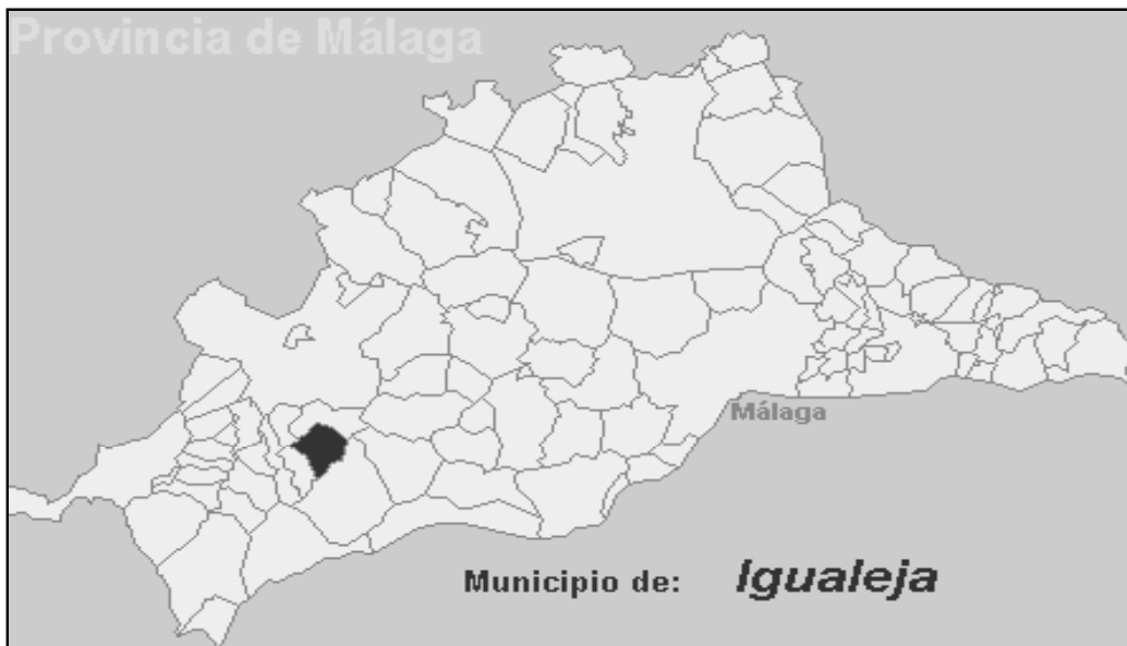
Situación geográfica de Igualeja en el plano de Málaga

trucción, se hallan distintas esculturas de gran valor artístico, de entre las cuales destaca la de San Gregorio Magno, una magnífica talla del s. XVI.