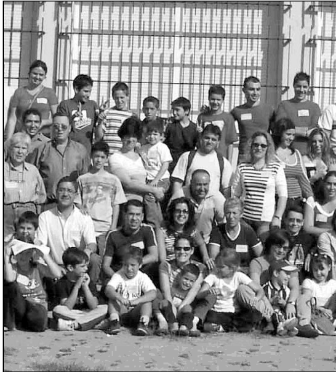
Miembros de Acción Católica de Málaga

En esta ocasión, los participantes de la asamblea harán una profunda reflexión sobre su presencia, como cristianos, en todos los ambientes. Por ejemplo, reflexionarán sobre cómo la condición de bautizados y seguidores de Jesús lleva implícita la presencia pública, para hacer presente el Reino de Dios en el mundo, ocupándose de los asun-