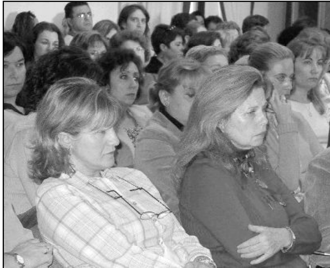
Profesores de Religión en un encuentro diocesano de formación

3. Que una parte de dicha campaña consiste en el envío de miles de cartas a los fieles de la diócesis. Entre ellos, la han recibido religiosos, jardineros, jubilados, limpiadoras, administrativos, médicos, taxistas y profesores de religión. Contra lo que afirma la noticia recurriendo al entrecomillado, a nadie "se le exige", sino que como dice la carta literalmente, a todos se les "pide" que se apunten con una cuota fija domiciliada para el mantenimiento de la Iglesia diocesa-