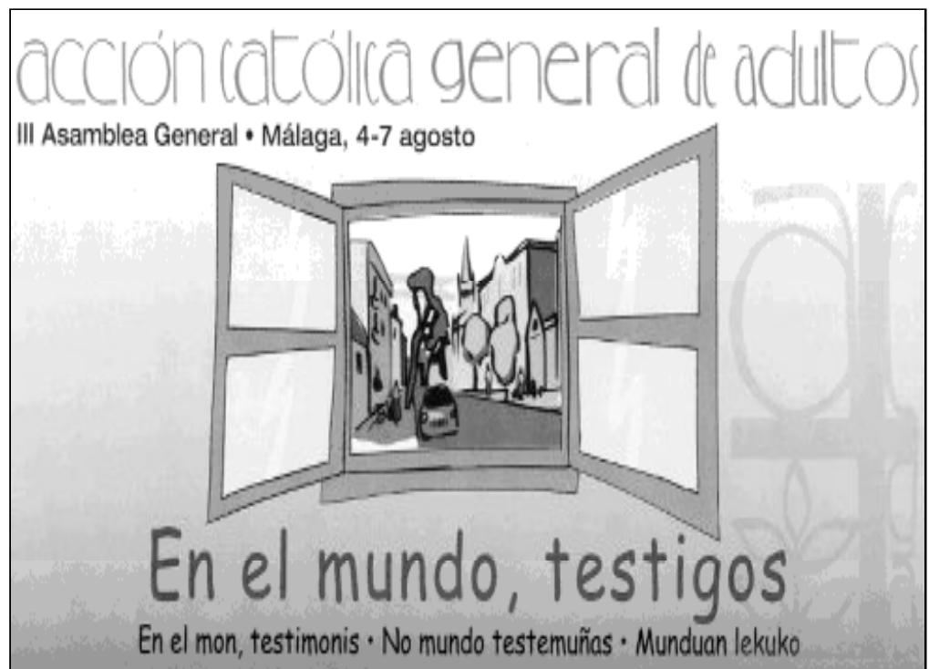
Cartel de la III Asamblea General de Acción Católica de Adultos