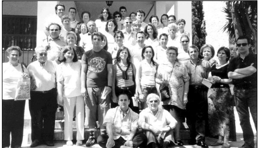
Participantes en un Cursillo de Cristiandad de la diócesis

Habría que preguntarse si no se están desaprovechando instrumentos muy valiosos, como los Cursillos de Cristiandad, de los que se habló en el número anterior de DIÓCESIS; la Acción Católica,