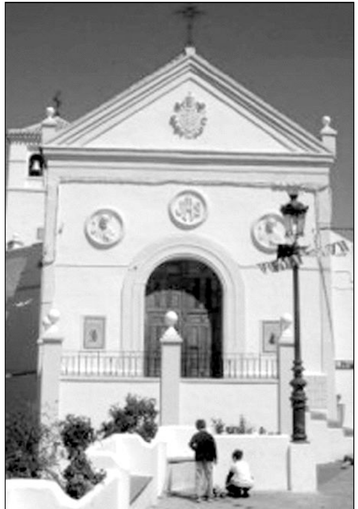
Fachada de la parroquia de Iznate

También destacan la festividad de San Antonio y las Cruces de Mayo, que se festejan de modo muy popular. Los vecinos confeccionan una gran cruz, que luego acompañan en procesión por sus calles.