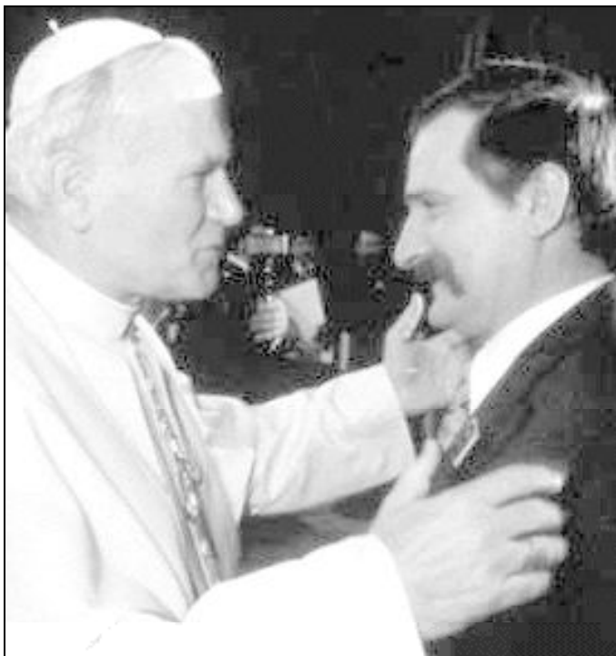
Lech Walesa y Juan Pablo II en un encuentro entre ambos

«Entonces la nación polaca y otras muchas despertaron», puntualizó el electricista que se convertiría en el primer presidente democrático del país tras la posguerra en un acto conmemorativo en el que fue el único orador de honor. Walesa declaró que la visita de Juan Pablo II en 1979 a Polonia dio a los polacos el valor para rebelarse contra los líderes comunistas del país. «Independientemente de lo que hoy se piense o del precio que pagamos entonces, hemos