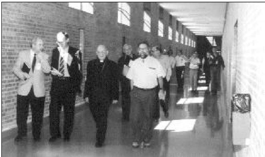
Como todos los años, el Sr. Obispo visitará la cárcel con motivo de la fiesta de la Merced, patrona del mundo penitenciario

Pero los ejercicios espirituales no son exclusivamente para curas. También los jóvenes tendrán la oportunidad de un tiempo y de un espacio para orar y ponerse en manos del Señor al comienzo del curso. El Secretariado de Pastoral de Juventud tiene programada la celebración de un retiro que comenzará el 30 de septiembre y finalizará el 2 de octubre. Para más información, pueden llamar al 952 22 43 86 y preguntar por algún responsable