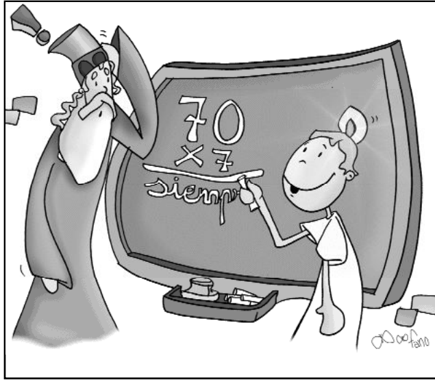
"Señor, ¿cuántas veces he de perdonar a mi hermano cuando me ofenda? Siempre."