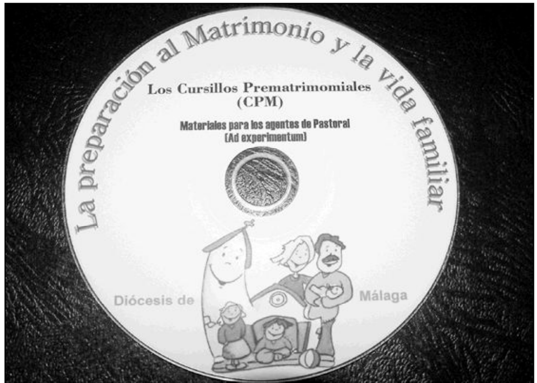
Los materiales para la preparación al matrimonio cuentan con recursos audiovisuales basados en las nuevas tecnologías