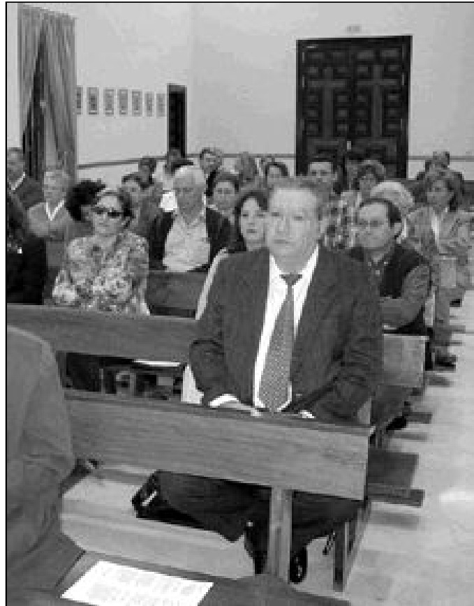
Cuando llega el domingo, el cristiano dedica el día a tener un encuentro con el Señor

El hecho de participar en la Eucaristía o Misa se comprende a la luz de esta experiencia espiritual y religiosa. Hay personas que han perdido esta