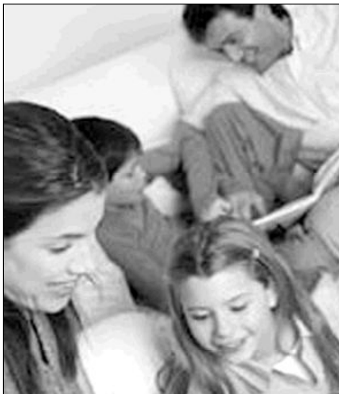
La nueva ley apunta a convertir al Estado en el único educador, olvidando a los padres

Se considera la educación como una actividad de servicio público y, por tanto, según la legislación española, de exclusiva competencia del poder estatal. De ahí que la