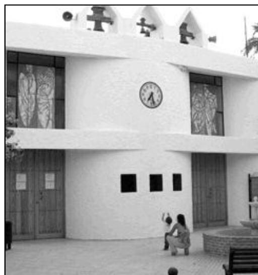
La parroquia de La Cala de Mijas tiene dos templos: el de Santa Teresa (dcha.) y el de San Miguel Arcángel (izquierda)

la liturgia sino en todas las actividades. Cuenta con su Consejo y con un representante en el Consejo Parroquial.