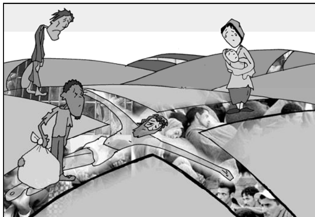
“Id a LOS cruces de los caminos, id a LAS cruces de los caminos”

bréis conmigo este acontecimiento tan especial, estáis todos invitados, disfrutad”.