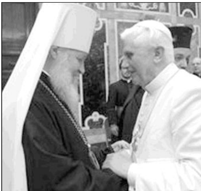
Benedicto XVI ha pedido que se que se tutele la libertad religiosa.

En su mensaje, enviado por el cardenal Angelo Sodano, Benedicto XVI invitó a los participantes a promover «desde el patrimonio espiritual y cultural de cada