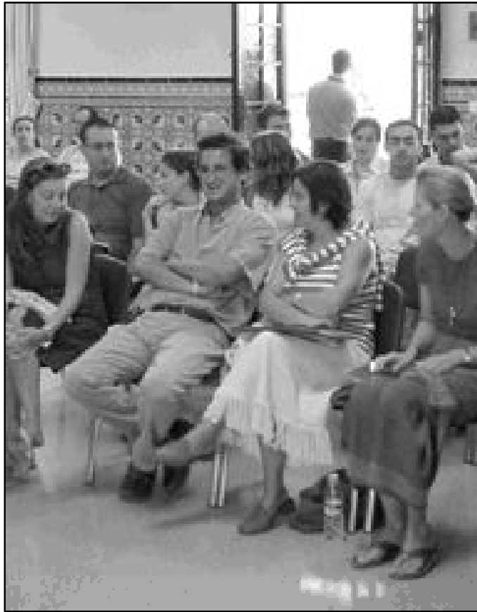
Encuentro de agentes de pastoral prematrimonial en la Casa Diocesana

Durante este curso se trabajará con el material, y se irá poniendo en común en los encuentros que tendrán lugar en la Casa Diocesana (5 de noviembre de 2005 y 4 de febrero de 2006). Al mismo tiempo, se han escogido algunas parroquias donde se llevarán a cabo de modo práctico. El resultado de esta experiencia tendrá como fruto los materiales