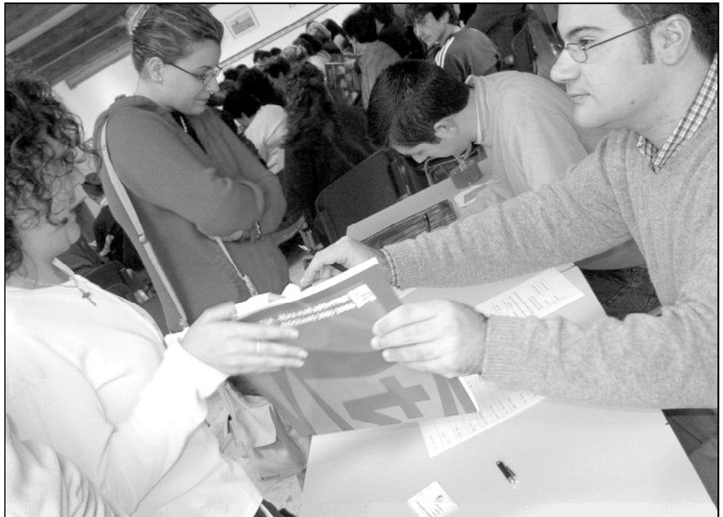
Participantes en un encuentro diocesano de catequistas