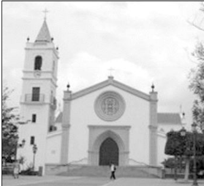
Nuestra Señora del Rosario, en La Cala del Moral

Es, sin duda, una parroquia muy viva en la que todos tienen cabida, sea cual sea su carisma. Entre los diferentes grupos, Cáritas juega un papel muy importante en la comunidad, encargándose de crear conciencia de la necesidad de aportar ayuda a los más desfavorecidos.