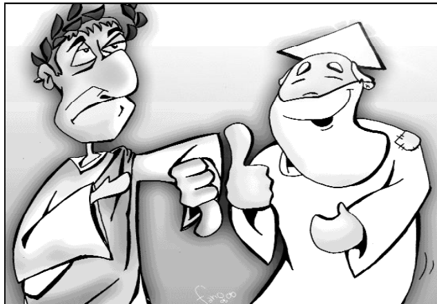
"Al César lo que es del César y a Dios lo que es de Dios."

do salgo, y cuando descanso con la familia y cuando tengo que pagar a la señora que viene a casa a limpiar.