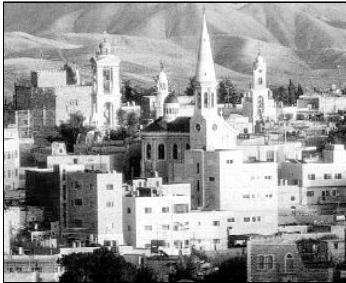
Vistas de la ciudad de Belén

Así se desprende de un llamamiento que han enviado a la agencia del Pontificio Instituto de Misiones Extranjeras (PIME), en el que denuncian: «Los cristianos de Belén están encerrados en una prisión a cielo abierto por un muro de ocho metros de alto, que los priva de terrenos indispensables para su supervivencia». Denuncian en el texto difundido que «el cierre de la tradicional vía para llegar a la Basílica de la Natividad y la apertura de un nuevo punto de control que impone también a los peregrinos horas de espera para salir de Belén, es una forma de barbarie moderna para estrangular económicamente una ciudad, para imponer la inseguridad diaria a un pueblo y para dar apariencia de legalidad a una fla-