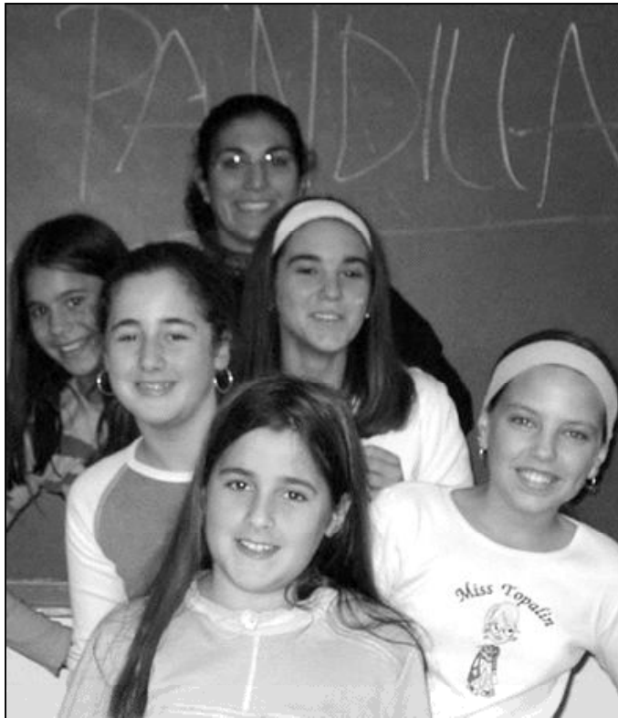
Jóvenes del Movimiento Junior en la parroquia de El Salvador

Dentro del arciprestazgo, el día 22 de diciembre las parroquias de los Valles del Guadiaro y del Genal celebrarán el Festival de Villancicos, que ya se ha convertido en una tradición. En este encuentro festivo, los distintos grupos parroquiales cantan villancicos y algu-