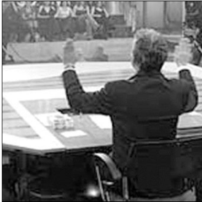
La televisión nos tiene acostumbrados al chisme

Un estudiante que había sido víctima de rumores crueles, escribía más tarde: "Me acuerdo como si hubiera sido ayer. El estómago encogido, las lágrimas reprimidas, la crueldad de alusiones... Me sentía a menudo enfermo en el fondo de mí mismo hasta el punto de hincarme de rodillas en el suelo frío y duro. Sabía que todo eso eran mentiras y no merecía esos ataques, pero esta certeza no