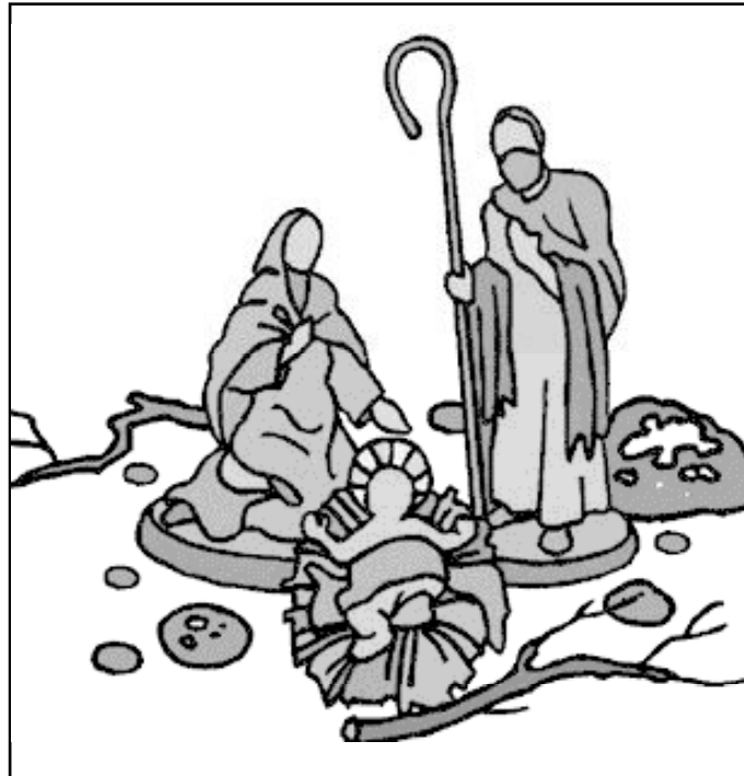
En Navidad celebramos el nacimiento del Señor y la llegada de un nuevo año

La Adoración Nocturna de Málaga también organiza una Eucaristía para las 11 de la noche, que estará presidida por el Sr. Obispo, y tendrá lugar en la parroquia de Stella Maris, situa-