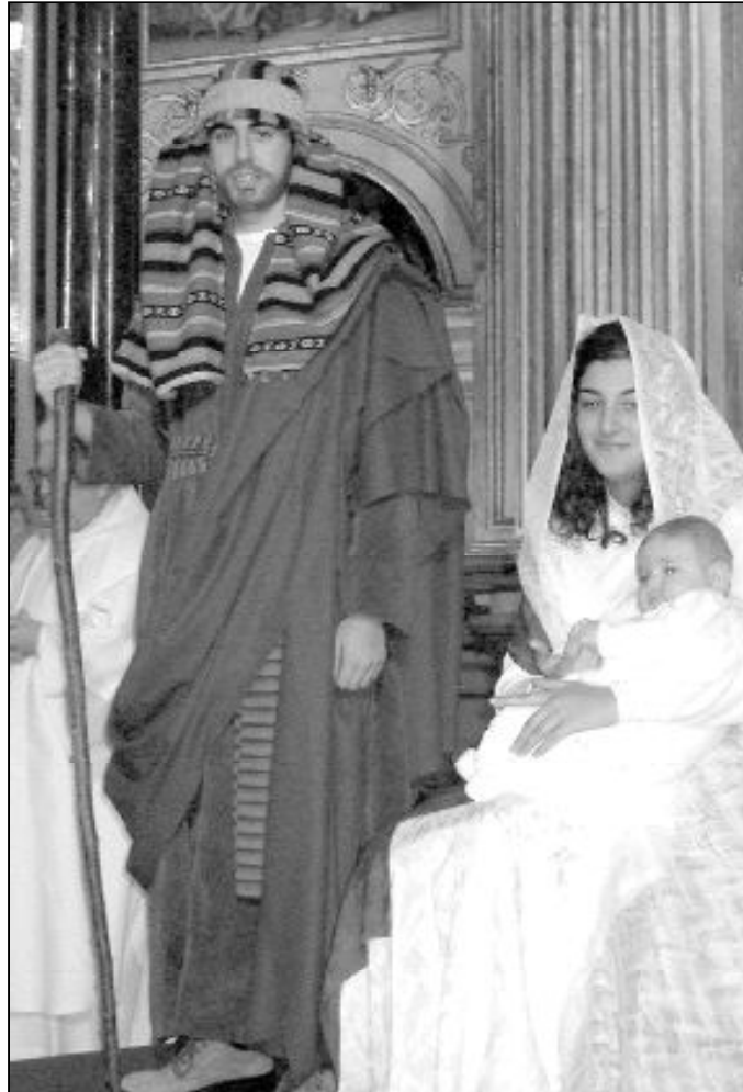
Representación de la Sagrada Familia en el presbiterio de la Catedral