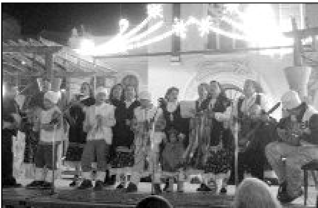
MARATÓN DE VILLANCICOS EN MELILLA

El 16 de diciembre se celebró el VII maratón de villancicos en la Plaza Menéndez Pelayo de Melilla. Un año más, el arciprestazgo organizó este maratón con grupos de todas las parroquias, movimientos y colegios religiosos de Melilla. Doce grupos participaron en el maratón desde las 17 hasta 22 horas.