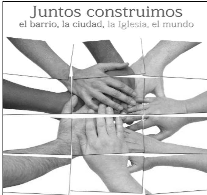
Cartel de la campaña de la Jornada Mundial de las Migraciones

El miércoles día 4 de enero celebramos la fiesta del Beato Manuel González, obispo de Málaga de 1916 a 1935. Fue beatificado por Juan Pablo II el 29 de abril de 2001. La diócesis organiza para ese día la celebración de una Eucaristía en la iglesia de El Sagrario. Será a las 18'30 horas y tanto las Misioneras Eucarísticas de Nazaret como la Unión Eucarística Reparadora invitan