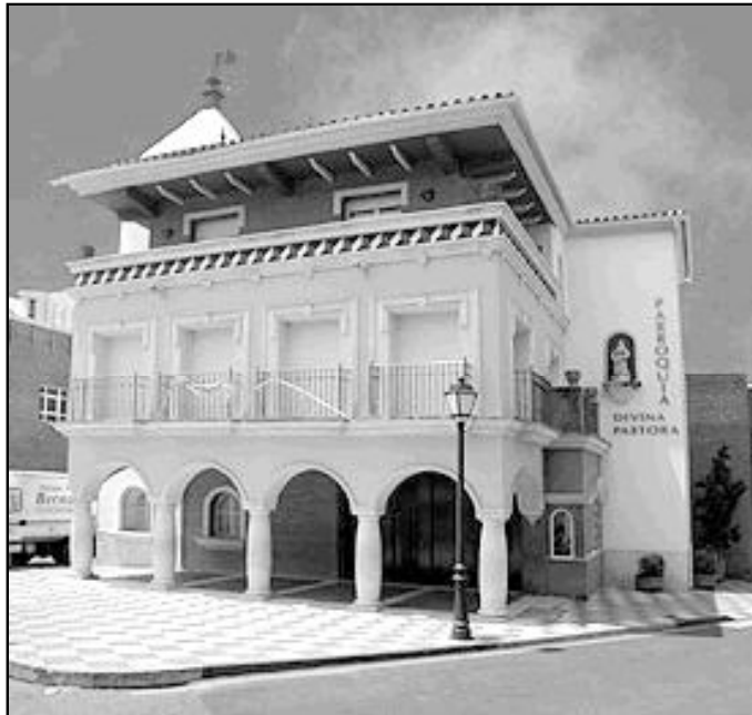
Fachada del complejo parroquial

Se trata de dos tallas de madera de un Crucificado, que preside el altar, y una imagen