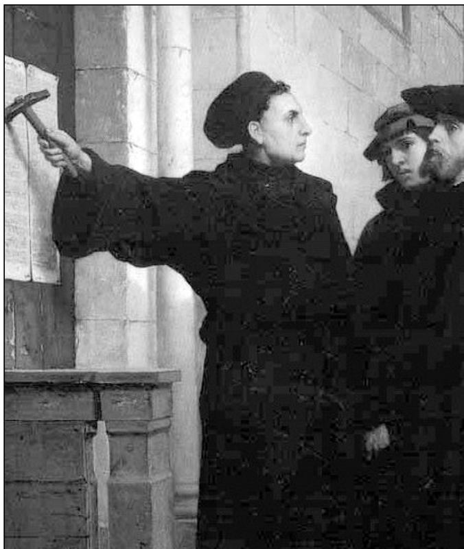
La película, de Eric Till, no acaba de transparentar la figura de Martín Lutero

A decir verdad, los 21 millones euros que ha costado la película no se han sabido emplear correctamente en su construcción. Este docudrama tiene fallos que hacen que el personaje no se acerque al espectador en su máximo esplendor y en la trayectoria de su personalidad extraña. Lutero era una persona apasionada, sin escrúpulos, con agilidad verbal, excelente diatriba y mordaz en sus réplicas. Los demás personajes, Ustinov y Molina, protector y director espiritual de Lutero, también están estudiados de forma esquemática.