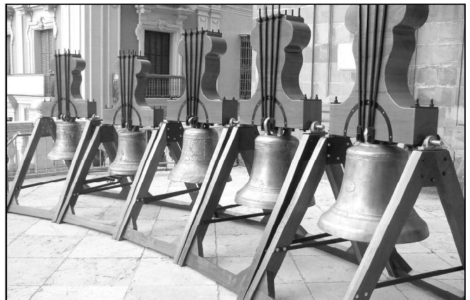
CAMPANAS COMO NUEVAS

El 16 de diciembre se celebró el VII maratón de villancicos en la Plaza Menéndez Pelayo de Melilla. Un año más, el arciprestazgo organizó este maratón con grupos de todas las parroquias, movimientos y colegios religiosos de Melilla. Doce grupos participaron en el maratón desde las 17 hasta 22 horas.