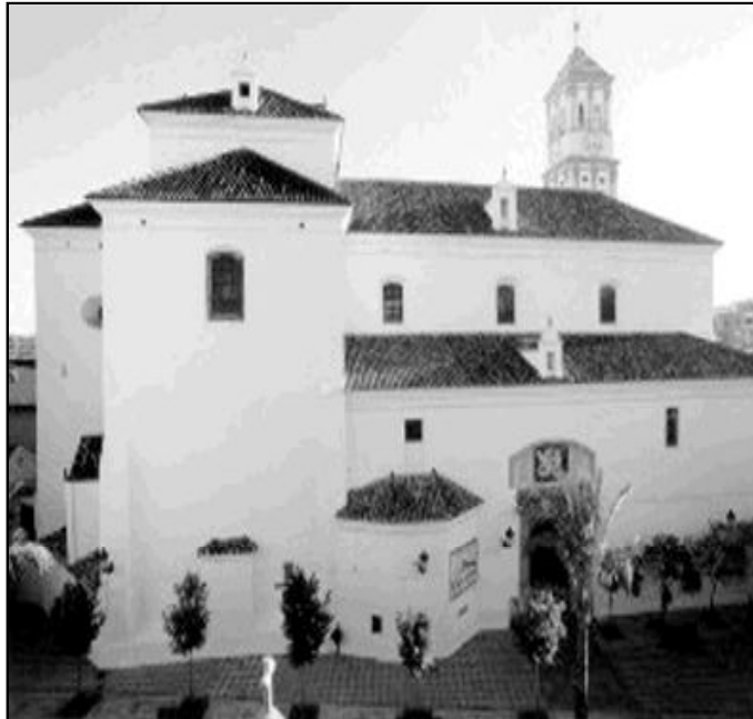
Fachada de la parroquia de la Encarnación

A pesar de que la belleza del edificio arrulla los sentidos de quien