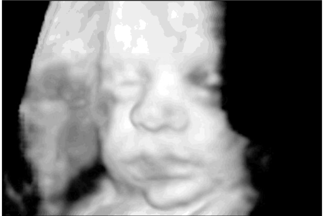
Ecografía de un bebé en tres dimensiones

Por otra parte, el que siga aumentando el número de adolescentes que abortan es el testimonio claro que la política de informar en los colegios sobre el sexo y de repartir preservativos, cuando falta una educación de la persona, no sólo no es eficaz, sino que resulta dañina. De hecho, los embarazos y abortos de adolescentes aumentan. Y aun no se han estudiado los inconvenientes para la salud de la píldora post-coital, que se reparte de manera gratuita también a las adolescentes. Además de ser una especie más de aborto, por lo que merece