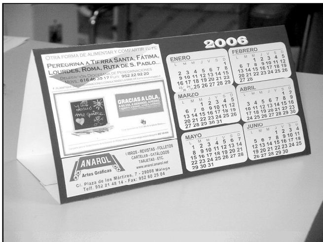
QUE NO FALTE EN NINGUNA CASA

Como ya es tradicional, la revista «Diócesis» obsequia a primeros de año a todos sus lectores con un práctico calendario de mesa. El de este año cuenta con la particularidad de incluir un listado de las peregrinaciones previstas para este año. Si no lo encuentran, pídanse al párroco o pasen a recogerlo a la delegación de Medios de Comunicación Social (C/ Postigo de San Juan, 5. 2º)