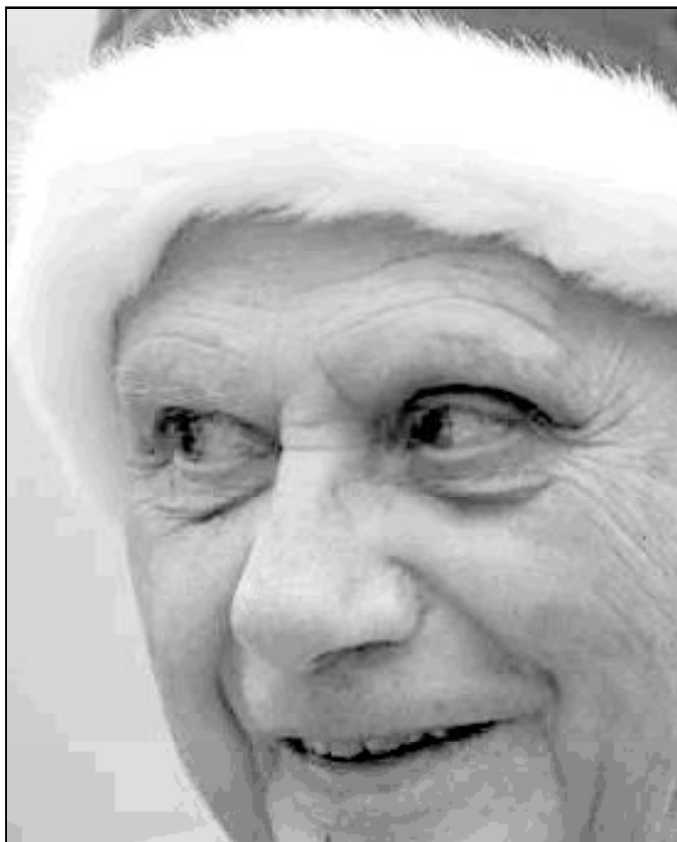
El Papa Benedicto XVI se puso el camauro, un gorro papal paara resguardarse del frío invernal

Por otra parte, el mismo Benedicto XVI, a quien numerosos críticos suelen presentar como un