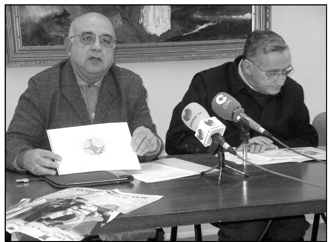
ENCUENTRO MUNDIAL DE LAS FAMILIAS CON EL SANTO PADRE

Como ya es tradicional, la revista «Diócesis» obsequia a primeros de año a todos sus lectores con un práctico calendario de mesa. El de este año cuenta con la particularidad de incluir un listado de las peregrinaciones previstas para este año. Si no lo encuentran, pídanse al párroco o pasen a recogerlo a la delegación de Medios de Comunicación Social (C/ Postigo de San Juan, 5. 2º)