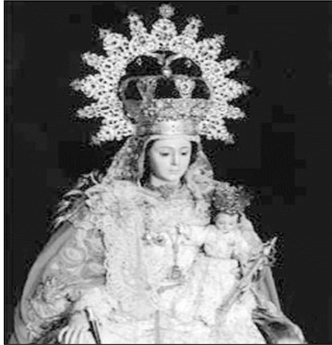
En Málaga, la paz da nombre a la patrona de Ronda (en la imagen), que celebra en estos días su novena; y a la titular del templo de Zalea y la de calle Goya, en Málaga

Benedicto XVI, en su mensaje para la Jornada Mundial de la Paz celebrada el día 1 de enero, destacaba la importancia de la paz como don divino que exige del hombre una acogida responsable. "En la verdad, la paz" era el título de este texto, que puede consultarse íntegro a través de Internet ( www.vatican.va ). El Santo Padre, a través de este documento, llama nuestra atención sobre los peligros que amenazan la paz: el fanatismo religioso, que pretende imponer con violencia su propia convicción acerca de la verdad; y el nihilismo, que mediante la desesperación ante la vida y el futuro cultiva sentimientos de desprecio hacia la humanidad. Los conflictos armados, aunque menores en