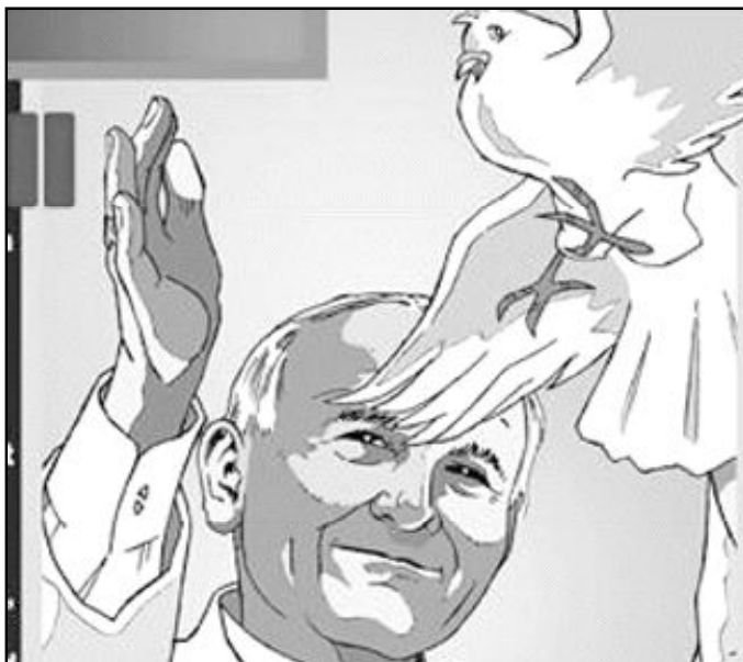
Juan Pablo II será el protagonista de una película de dibujos animados

Desde entonces, varios miembros del congreso han propuesto legislación que exija la consideración de las mascotas en los futuros planes de evacuación. También se está gastando mucho dinero en el cuidado médico de mascotas. En Australia algunos propietarios tienen ahora la oportunidad de utili-