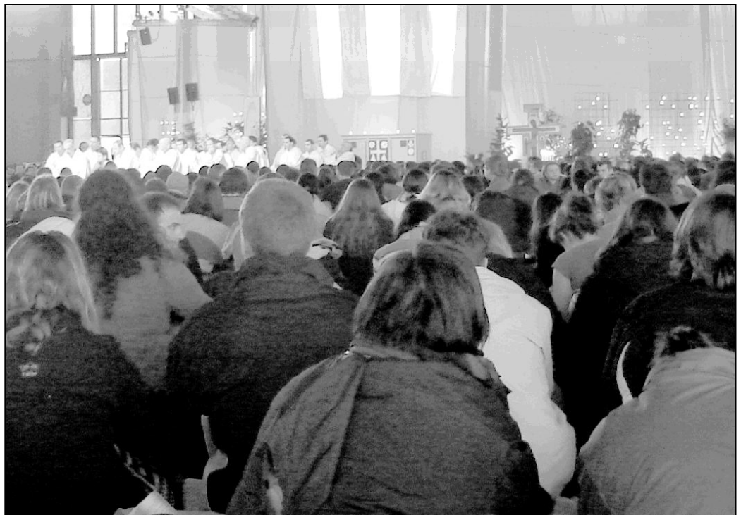
50.000 jóvenes se reunieron en Milán para celebrar el 28 Encuentro Europeo de Jóvenes de Taizé