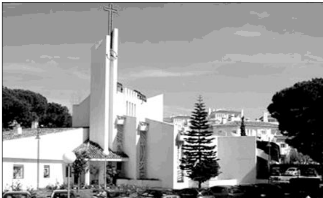
Parroquia de la Virgen del Carmen, en Marbella

A cada celebración, en los meses de julio y agosto suelen acudir en torno a 700 personas. En este original marco, la participación es muy especial debido a los matices que cada cual aporta a los demás por su nacionalidad y cultura.