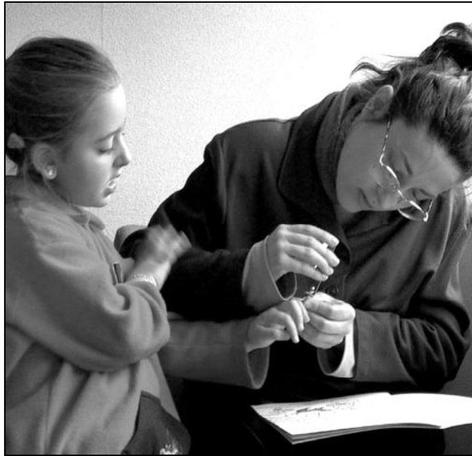
Dios es el único padre que nunca se equivoca

1. Sostiene que demos lo mejor de nosotros mismos, pero es tole-